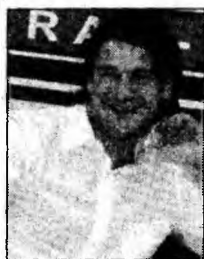
Cristi Chivu

Londra (MF) - Atacantul portughez Cristiano Ronaldo, care a afirmat, în timpul CM, că nu mai vrea să joace în Anglia, din cauza atacurilor la adresa sa din presa britanică, s-a răzgândit și a precizat că dorește să rămână la Manchester United. „Nu am motive să părăsesc un club care m-a susținut mereu, care mi-a dat mereu garanții mari pentru a-mi permite să evoluez ca jucător”, a spus Ronaldo.