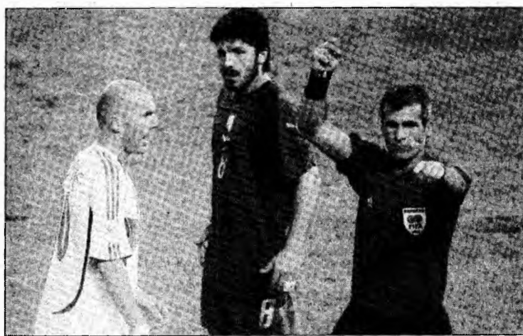
Zinedine Zidane, în momentul eliminării.

„Nu pot să regret gestul făcut, pentru că ar însemna că a avut dreptate să spună tot ce a spus. Nu pot, nu pot să spun asta. Și nu, nu a avut niciun motiv să spună acele