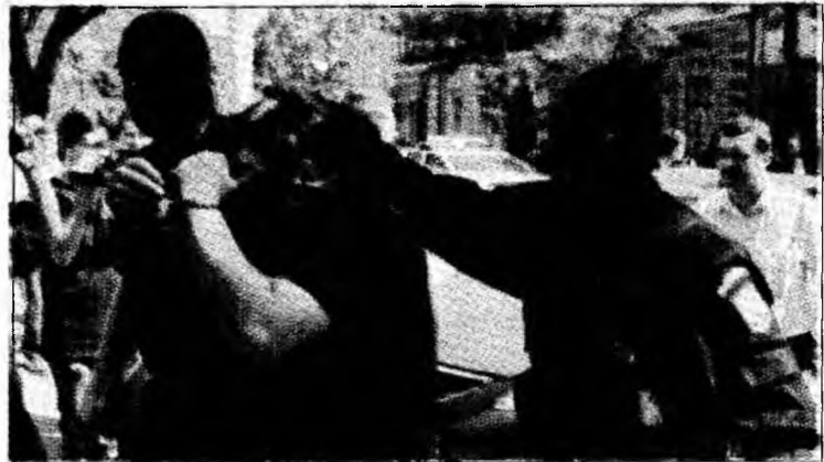
Conduși de "mascați"

De asemenea, în fiecare grupă existau și angajați ai firmei WBC Security, societate