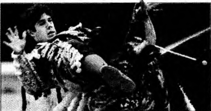
Toreadorul francez Sebastien Castella