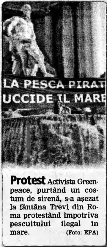
Protest Activista Greenpeace, purtând un costum de sirena, s-a așezat la fântâna Trevi din Roma protestând împotriva pescuitului ilegal în mare.

Fericiții agricultori, care locuiesc în sătucul Stepnoi, situat în nord-estul Kazahstanului, au autentificat inscripția la o moschee locală. „Vom păstra acest ou și suntem de părere că nu se va altera”, a declarat o locuitoare a satului. Recent, un cocș a stârnit emoții printre kazahi, martorii declarând că acesta, în loc să cânte „cucurigu”, strigă în arabă „Allah este mare”.