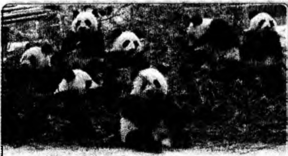
Șapte pui de urs panda s-au născut la Wolong Giant Panda Preserve din Aba, în vestul provinciei chineze Sichuan.

Londra (MF) - Actrița Cameron Diaz s-a logodit cu cântărețul Justin Timberlake cu care are o relație de trei ani. Cuplul a fost fotografiat într-un restaurant din Londra. Diaz (33 ani) nu a făcut nici un efort pentru a ascunde strălucitoarea bijuterie aflată pe degetul inelar. Nici Timberlake nu a făcut nici un secret din faptul că vrea să se căsătorească cu frumoasa actriță, dar a declarat întotdeauna că vrea ca ceremonia de nuntă să fie foarte intimă.