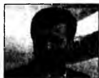
Mahmoud Ahmadinejad