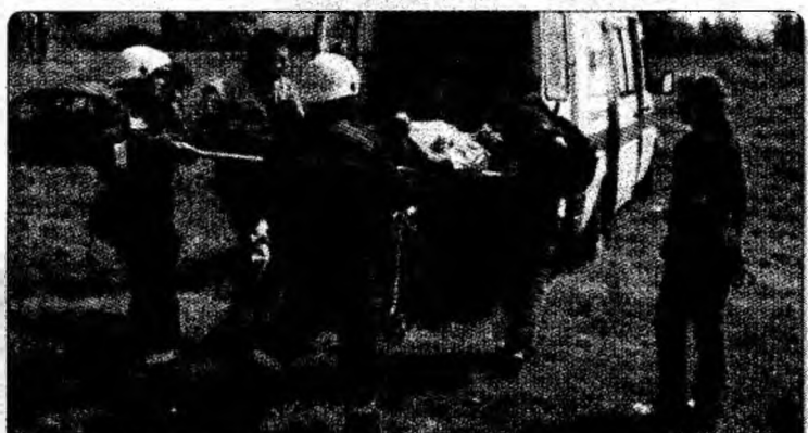
Peste 200 de persoane din cadrul Inspectoratului pentru Situații de Urgență și Hunedoara, Primăriei Deva, Jandarmeriei, Poliției și din formațiunile de Cruce Roșie au participat, ieri, la Sântuhalm, la un exercițiu de alarmare publică în caz de inundații. /p.3

Deva (D.I.) - Cei cinci euro-observatori PD, printre care și deputata de Hunedoara Monica Iacob Ridzi doresc să candideze la alegerile pentru Parlamentul European, ei fiind dispuși să renunțe la mandatele pe care le dețin în Parlamentul de la București. Ei au anunțat că doresc să candideze la alegerile pentru PE care se vor desfășura în Româ-