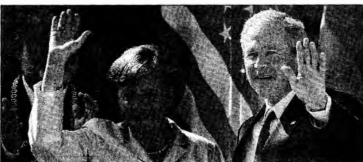
Angela Merkel și George W. Bush

Imediat după destrămarea Uniunii Sovietice, 404.000 de lituanieni au părăsit țara, populația țării scăzând de la 3,6 milioane la 3,2 milioane de locuitori.