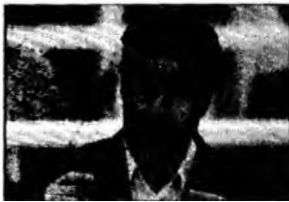
Saddam Hussein

Bagdad (MF) - Fostul președinte irakian Saddam Hussein și o parte dintre cei șapte foști colaboratori ai acestuia, acuzați în procesul privind masacrarea mai multor șiiți, în anii '80, au intrat în greva foamei. Aceștia au boicotat, la fel ca și avocații lor, ultimele audieri desfășurate luni și marți, în fața Înalțului Tribunal Penal irakian. Avocații intenționau să protesteze astfel față de neîndeplinirea solicitărilor pe care le formulaseră, în special cea care viza protecția membrilor apărării, după asasinarea, în iunie, a unuia dintre ei, al treilea de la începutul procesului în octombrie 2005. Acuzății sunt deținuți sub pază americană într-o bază din apropierea Bagdadului.