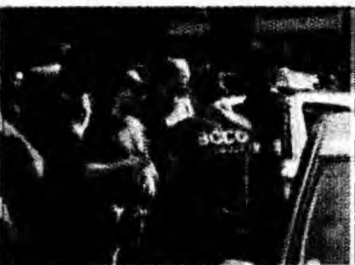
Interlopii hunedoreni au fost duși ieri la Parchet