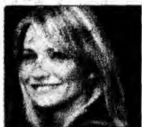
Cameron Diaz

În curând, Angelina Jolie o va încarna pe Mariane Pearl în filmul „A Mighty Heart”, o adaptare a memoriilor lui Pearl despre răpirea și uciderea soțului ei, Daniel, de către militanții pakistanezi, în 2002. Filmul urmează să fie produs de compania deținută de iubitul actriței, Brad Pitt. Inițial, rolul a fost oferit fostei soții a lui Brad Pitt, Jennifer Aniston.