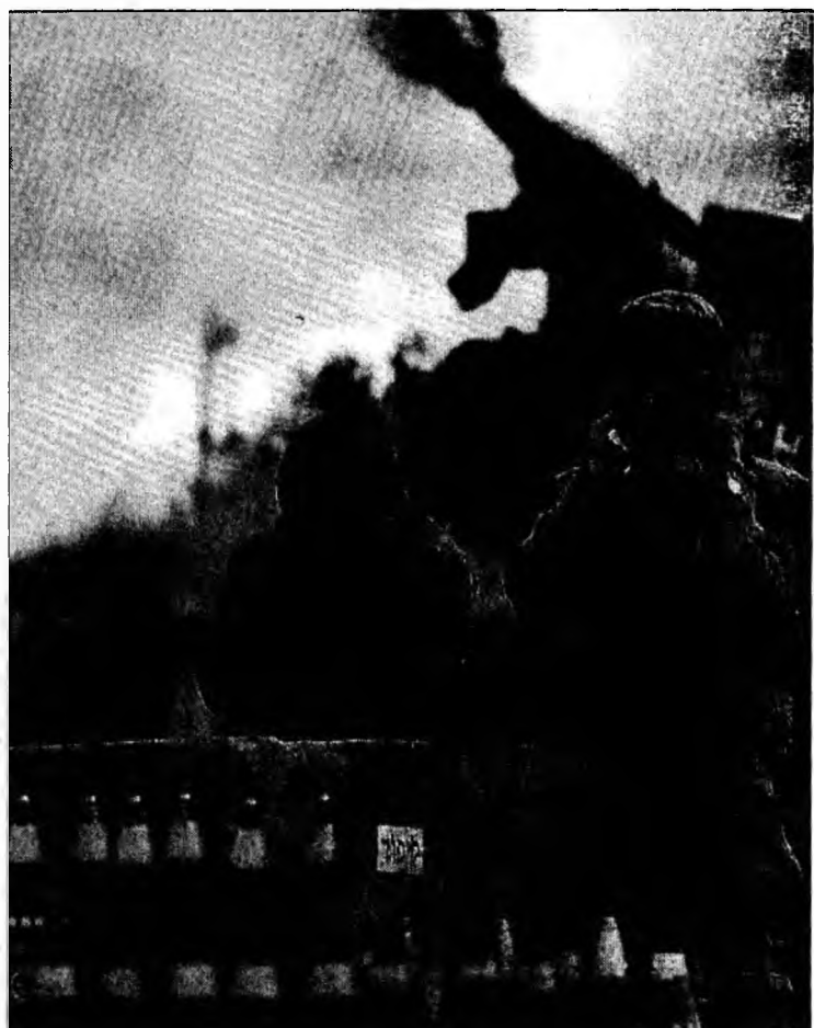
Soldați israelieni în timp ce lansează rachete

Mișcarea șiiită Hezbollah a replicat amenințând că va