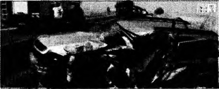
Mașina distrusă în urma impactului frontal pe DN7

în șanțul de pe marginea drumului. Șoferul Opelului a fost grav rănit, pentru eliberarea sa dintre fiarele contorsionate ale mașinii fiind nevoie de intervenția unui echipaj de descarcerare.