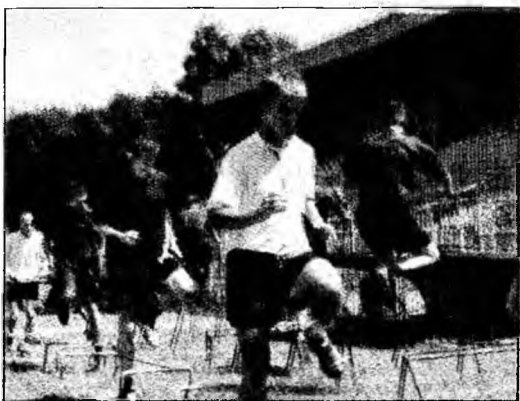
La Corvinul, unii se pregătesc, alții pleacă