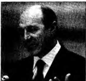
Traian Băsescu