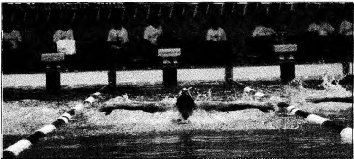
Înotătorii de la CSS Hunedoara au „prins” un an foarte bun

Așadar, ultima etapă a Campionatului Național la