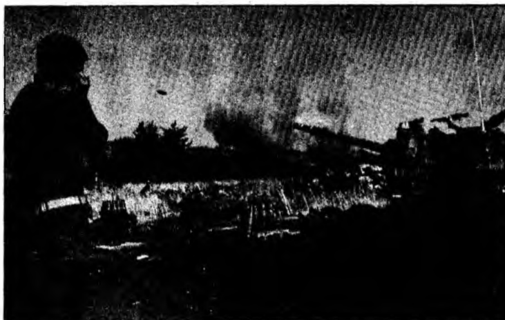
Bombardarea Libanului continuă pe toate căile

■ Israelul decide continuarea „fără limită de timp” a ofensivelor din Liban și Fâșia Gaza.