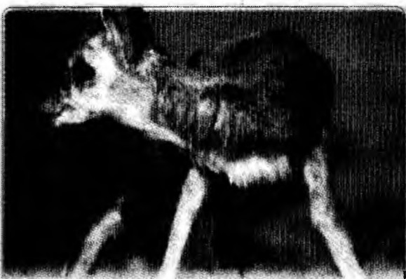
Puiul de antilopă tibetană se străduiește să facă primii pași într-un țarc din Bangkok.

„Acum vreau să-mi privesc fiul crescând, să-i fiu prieten și tată și să-mi petrec timpul cu el. Deci el este prioritatea mea în viață”, a spus actorul. Fiul său și al modelului Kim Bordenave s-a născut în 2003