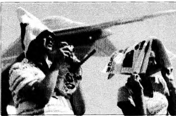
Zilele acestea, temperaturi de peste 30 de grade Celsius

Haga (MF) - Numeroase țări europene se confruntă cu un nou val de caniculă, în Olanda fiind deja înregistrate temperaturi de peste 30 de grade timp de mai multe zile, iar în Belgia meteorologii prognozând pentru miercuri 37 de grade Celsius. Luni seara, două persoane care participau la un marș în estul Olandei au murit din cauza căldurii excesive. În nordul Belgiei, în Flandra, au fost înregistrate marți tempera-