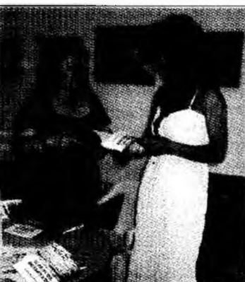
Aspect de la lansare (Foto: T. Manu)