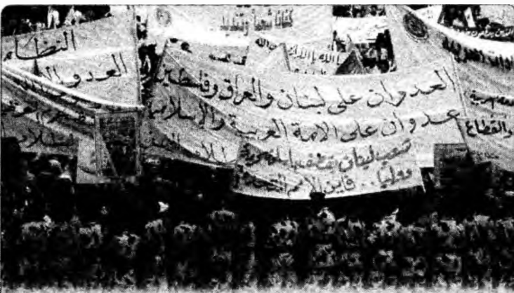
Anti-israel Mii de protestatari au demonstrat ieri, în capitala Yemenului, fluturând steaguri libaneze și palestiniene, împotriva ofensivei israeliene din Liban și Gaza.