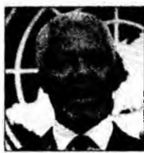
Kofi Annan