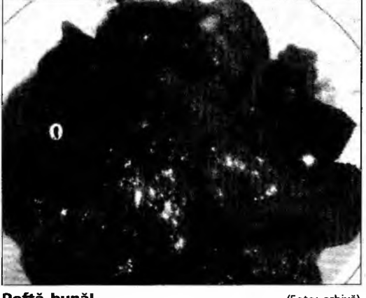
Poftă bună!

Mod de preparare: Se face un răntăș din ulei și făină, care se stinge cu o ceașcă de supă. Se adaugă muștarul și bulionul, amestecând mereu și zahărul, care s-a ars într-o tigăiță separată. Să nu se uite sarea, piperul, busuiocul și cimbrul. Se mai toarnă supă, până ce sosul capătă consistența unei smântâni. Se lasă să dea câteva clocote. Acest sos se servește ca garnitură la aproape orice fel de mâncare.