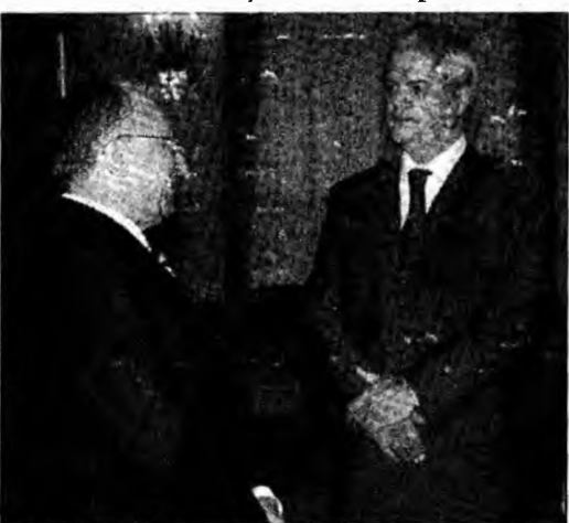
Ion Iliescu și Adrian Năstase

Șeful DNA, Daniel Morar, a declarat, săptămâna trecută, că ancheta în dosarele care îl vizează pe Năstase sunt prioritare și că, în cazul Zambaccian, crede că dosarul va fi trimis în instanță în luna septembrie.