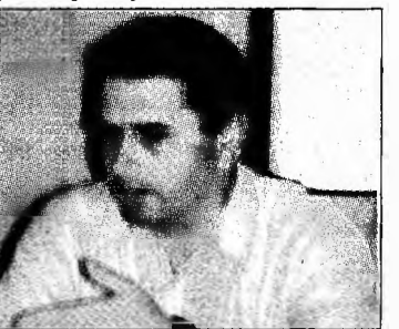
Din nou, la examen

Potrivit sursei citate, PPCD-PNȚCD intenționează să acopere cu cabinete parlamentare toate orașele reședință de județ.