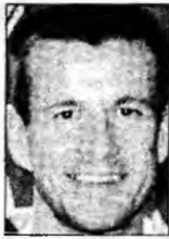
Carlos Dunga

Partida cu Brazilia, care se va juca pe arena Emirates Stadium a echipei Arsenal, va fi prima pentru cei doi selecționeri, argentinianul Alfio Basile, respectiv brazilianul Dunga.