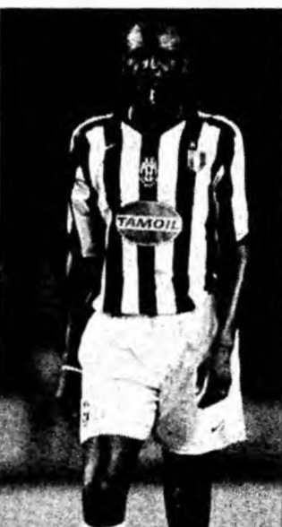
Patrick Vieira

Contractul lui Vieira, în vârstă de 30 ani, cu Inter este valabil patru sezoane, internaționalul francez urmând să încaseze un salariu anual de 5 milioane de euro. Patrick Vieira a fost achiziționat de Juventus în vara anului 2005, de la Arsenal. În comunicatul dat publicității de clubul torinez se arată că sezonul petrecut de Vieira la Juventus a costat „cel puțin 8,6 milioane de euro”.