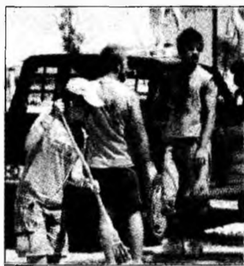
Voluntari RNT la Orăștie

În timpul celor cinci zile cât au stat la Orăștie, cei peste 170 de tineri au ecologizat diferite zone ale orașului, au vopsit pomi, parapeși și bănci, au decolmat șanțuri și rigole, au cosit și tuns vegetația, au salubritat căi de comunicație etc. În plus, au pictat cu personaje din desene animate o sală