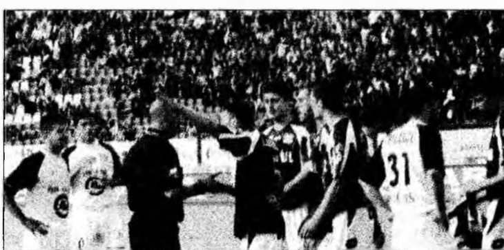
Meciul de la Petroșani a fost marcat de incidente