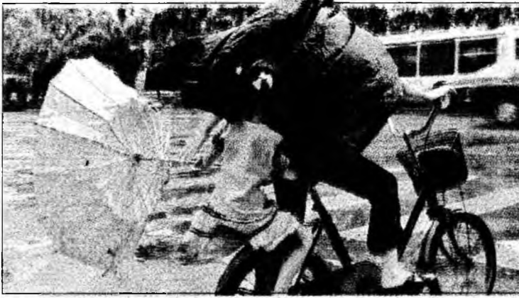
Se apropie taifunul Prapiroon

La ora 02.00 GMT (05.00, ora României), taifunul Prapiroon, care în thailandeză înseamnă „Zeul ploii”, se afla la circa 290 de kilometri sud-vest de Hong Kong, iar meteorologii au anunțat că acesta