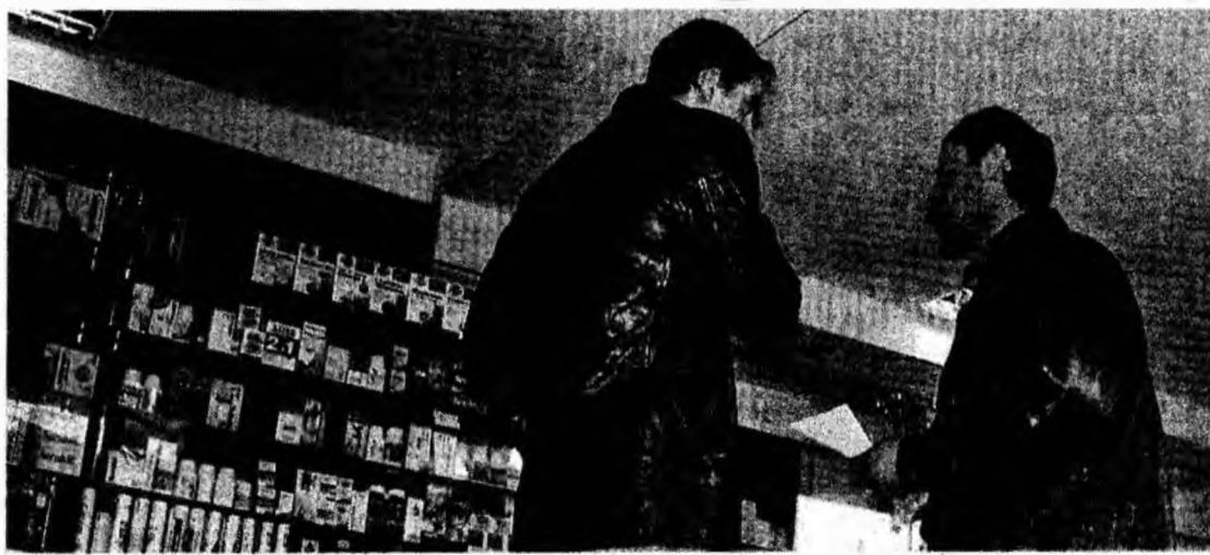
Un hunedorean primește de la stat 33 de lei pentru medicamente