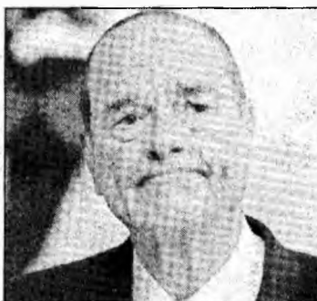
Jacques Chirac

Guvernul lui Villepin s-a confruntat cu o serie de crize în ultimele luni, iar cota sa de popularitate a scăzut până