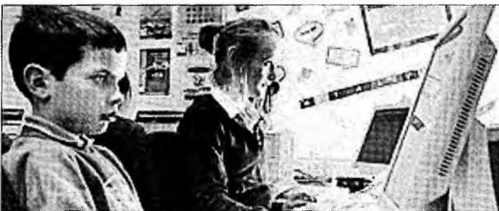
Elevii deprind tainele Internetului