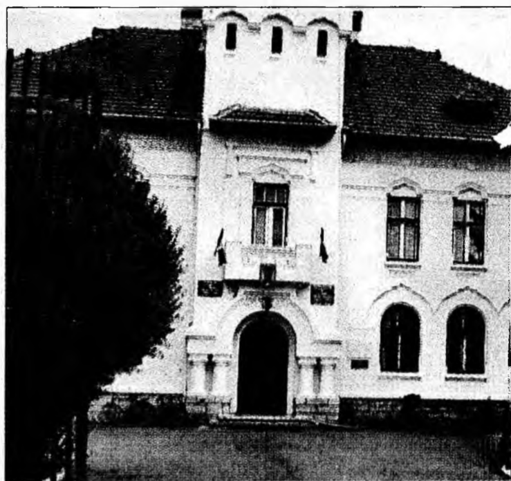
Primăria orașului Geoagiu