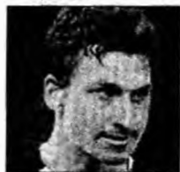
Zlatan Ibrahimović