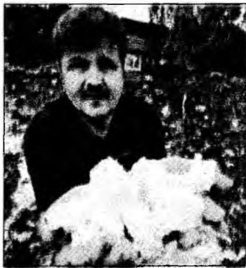
Turiștii, bucușori de zăpadă

Johannesburg (MF) - Căderi de zăpadă au fost înregistrate, miercuri, în Africa de Sud, în special în zona orașului Johannesburg, unde, conform specialiștilor, nu a mai