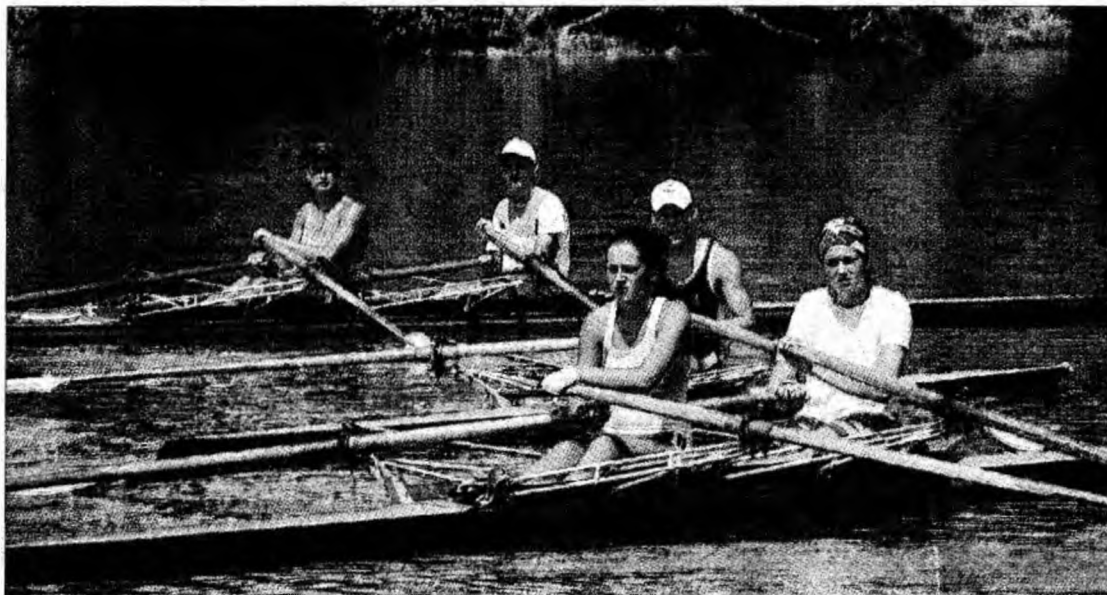
Canotorii deveni au „alergat” aproximativ 13-14 km/zi pe apele Mureșului

Cei șapte vor pleca duminică, 6 iulie, pe litoral și vor lupta pentru un loc pe podium în cadrul concursurilor ce se vor derula în perioada 9-11 august pe Canalul Midia Năvodari. După participarea la CN de Viteză, canotorii vor mai concura în perioada 12-13 august și la Campionatul Național al clu-