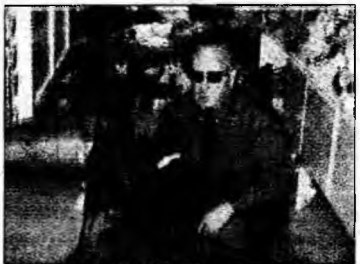
Barney, vinovat

Ursul, fabricat în Germania, în 1909, a fost cumpărat la o licitație care a avut loc în Memphis, Tennessee, de un aristocrat din Somerset, Sir Benjamin Slade. Barney a produs pagube în valoare de aproape 30.000 de euro celorlalți urși din colecție.