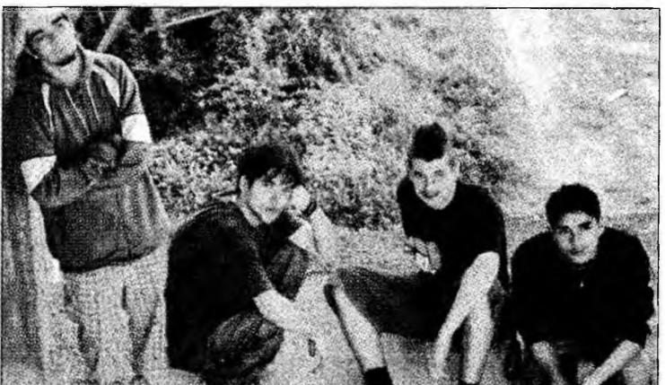
Trupa rock Torpedo

„Rock-ul este în general o muzică agresivă, dar mesajul transmis poate fi și unul pozitiv. Prezintă un stil de viață, bun sau rău, acuma fiecare e liber să aleagă. În general, oamenii se îndreaptă spre stilul muzical sau spre