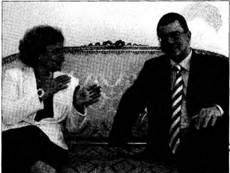
Șeful diplomației ungare, Kinga Goncz, și Răzvan Ungureanu

Lashkar Gah (MF) - Un atentat sinucigaș, comis, ieri, la Lashkar Gah, capitala provinciei Helmand, situată în sudul Afganistanului, a provocat moartea a 17 persoane și rănierea altor 47, a anunțat purtătorul de cuvânt al guvernatorului regiunii. Un kamikaze, care avea asupra lui dispozitive explozive, s-a aruncat asupra unui fost general de poliție, apoi a detonat încărcătura. „Un kamikaze s-a aruncat în aer în centrul unui bazar foarte aglomerat din Lashkar Gah, provocând moartea a 17 persoane și rănierea altor 47, dintre care 15 copii”, a declarat purtătorul de cuvânt. Bilanțul acestui atentat este unul dintre cele mai mari de la începutul anului în Afganistan.