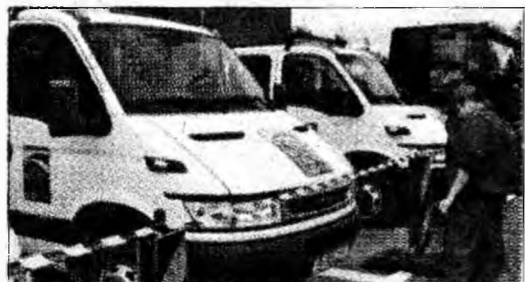
R.A. Drumuri județene s-a dotat