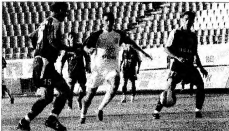
Tribunele stadionului Jiul au fost aproape goale.

clubului au scumpit biletele, un tichet la meciul de duminică cu Poli Iași costând 15 RON cât cel de la meciul anterior de acasă cu Dinamo. Comerțul bazat pe sentimentele spectatorilor față de echipă s-a dovedit necăștigător, la partida cu moldovenii tribunele fiind aproape goale, iar încasărilor mici. La peluză unde de obicei lua loc galeria echipei Jiul nu a fost decât un... banner cu mesajele „Peluza Sud și-a făcut damblaua, lăsăm tribunele să cânte pentru Steaua” și „Rușine”. S-au vândut doar 777 de bilete, cu toate că la meci au asistat 1.500 de spectatori. „Cu banii adunați