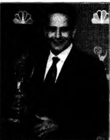
Tony Shalhoub

Vedeta din „Will & Grace”, Megan Mullally, a primit statueta pentru „cea mai bună actriță în rol secundar într-o comedie”. Serialul și-a încetat difuzarea începând de anul acesta. Alan Alda a câștigat un Emmy pentru „cel mai bun