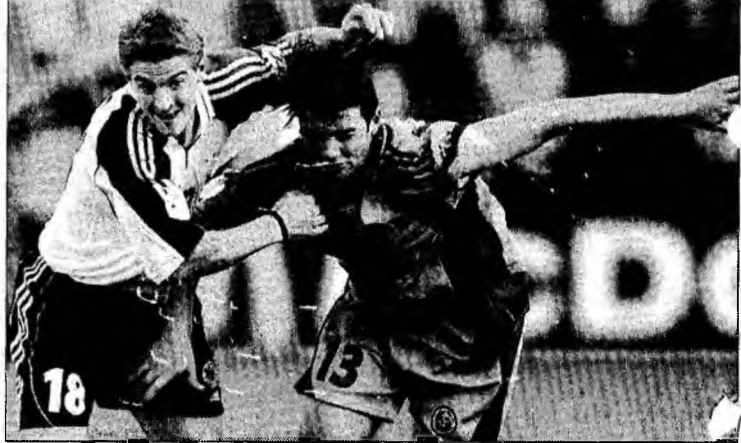
Cristi Chivu își dorește să joace la CE 2008

Căpitanul echipei naționale a precizat că nu vede meciul