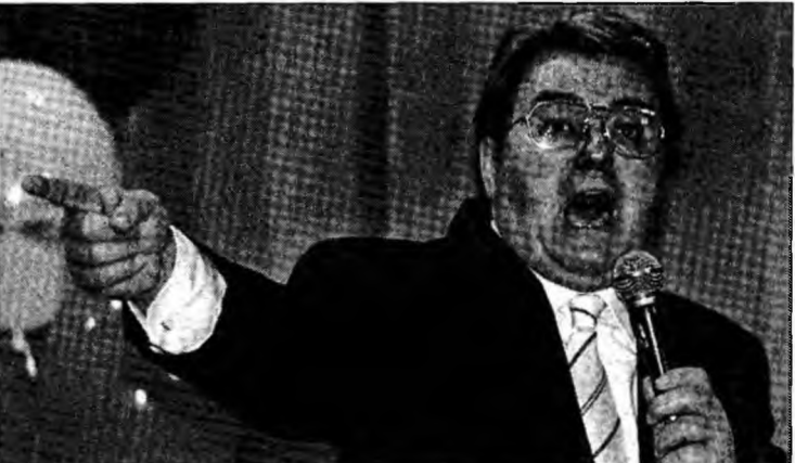
Vicepreședintele Senatului, C.V. Tudor

Mircea Dinescu, membru al Colegiului CNSAS, a declarat, duminică, că SIE a trimis date noi despre Corneliu Vadim Tudor, al cărui caz trebuie rediscutat, iar liderul PRM trebuie audiat, verdictul dat de vechiul Colegiu fiind afectat de viciu de procedură, senatorul nefiind audiat.