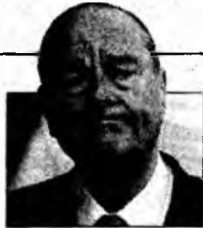
Jacques Chirac