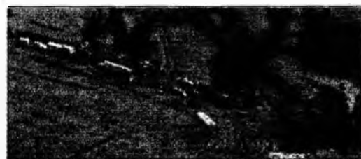
S-a prăbușit după decolare

● Aventură de o noapte. John Lennon a avut o aventură de o noapte, în 1963, cu managerul homosexual al trupei Beatles, Brian Epstein, potrivit lui Hunter Davis, biografii oficial al formației britanice.