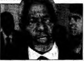
Kofi Annan

Cairo (MF) - Secretarul general al ONU, Kofi Annan, a început, ieri, un turneu în Orientul Mijlociu, care va cuprinde, în special Libanul, Egiptul, Iordania și Siria. El a ajuns, ieri, la Beirut, unde va examina împreună cu oficialii libanezi proiectul dislocării forței internaționale și securizarea frontierei cu Siria, urmând ca azi să se deplaseze la Cairo, pentru o întâlnire cu președintele Hosni Mubarak. Annan va vizita mâine Iordania, unde se va întâlni cu regele Abdullah al II-lea, după care se va deplasa la Damasc, ambele vizite având pe agendă dezbaterile situației din regiune. Secretarul general al ONU se va deplasa și în Israel, Qatar, Turcia și Arabia Saudită, dar și în Iran.