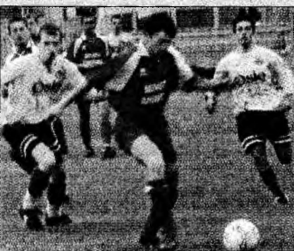
Liga a IV -a incepe in septembrie

Agrocompany Băcia - Gloria Geoagiu Victoria Călan - Constructorul Minerul Aninoasa - Inter Petrila Aurul Brad - Universitatea Colegiul Matei Corvin - CFR Marmosim Metalul Crișcior - Retezatul Hațeg