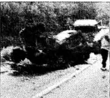
Tirul a zdrobit microbuzul

La fața locului a fost necesară intervenția unui echipaj de descarcerare, care să-i scoată dintre fiarele contorsionate pe ocupanții autoutilitare. Circulația autovehiculelor pe sectorul de drum menționat a fost oprită mai mult de o oră