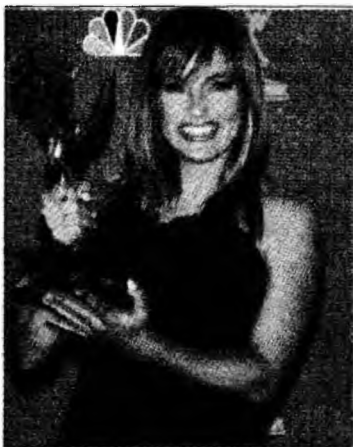
Mariska Hargitay

Jeremy Piven, protagonist al serialului „Entourage”, a luat trofeul pentru „cel mai bun actor în rol secundar într-o comedie”, în timp ce „The Daily Show with John Stewart” a câștigat premiul pentru „cea mai bună serie de varietate, muzică și comedie”. Show-ul a câștigat și premiul pentru „cel mai bun scenariu”. Comedia „My Name is Earl” a plecat acasă cu trofee pentru „cel mai bun scenariu” și „cea mai bună regie” la categoria comedie. Tony Shalhoub a obținut trofeul „cel mai bun actor în rol principal” la categoria comedie, pentru rolul din „Monk”. „Cea mai bună actriță în rol principal într-un