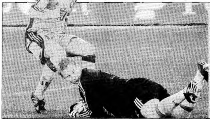
Mutu a marcat ultimele 5 goluri ale Naționalei

Selecționerul și-a exprimat regretul pentru faptul că a fost nevoit să renunțe la fundașul