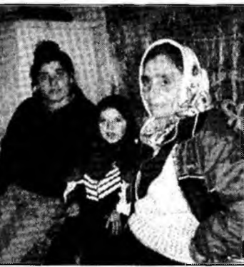
Ajutorul social a crescut

al familiei. Pentru cei care nu au nici un venit, ajutorul social pleacă de la 92 de lei noi, în cazul unei persoane singure, și ajunge până la 341 de lei noi, pentru familii formate din cinci persoane.