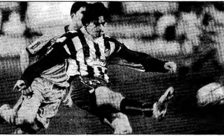
Contra a jucat de multe ori cu Real Madrid

„Momentul adevărului pentru echipa națională va fi când vom obține o nouă calificare. Drumul acum începe și sper să înceapă cât mai bine. În ziua de astăzi nici un meci nu mai este ușor, mai ales cu Bulgaria și Albania, care, cred eu, sunt două