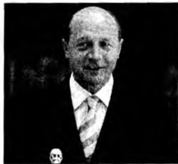
Președintele Traian Băsescu

Președintele Traian Băsescu a precizat, după ședința CSAT, că România nu se va