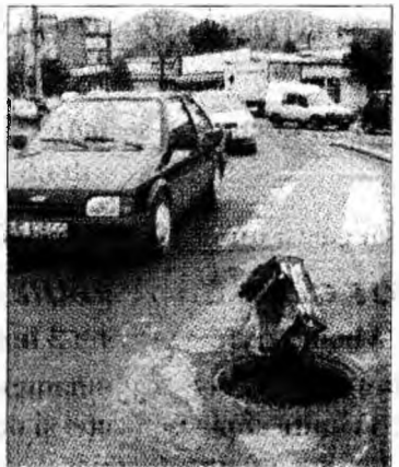
Capcanele șoselelor persistă

tem antifurt, fie dintr-un material special, precum materialul plastic, care nu prezintă interes pentru hoții de fier vechi.