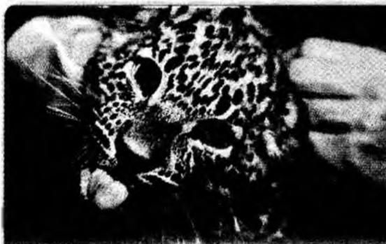
Vaccinat Unul din cei trei pui de panteră, care s-au născut la Burgers Zoo din Olanda, a primit primul vaccin.

Los Angeles (MF) - Angelina Jolie a cheltuit recent aproape trei milioane de dolari pentru a achiziționa un avion. Vedeta și-a cumpărat avionul după ce și-a luat licența de pilotaj. Ea a făcut această achiziție din dorința de a putea să își transporte oricând și oriunde familia, pe Shiloh Nouvel și pe cei doi copii adoptați, Maddox și Zahara. Avionul pe care Angelina l-a cumpărat este cel mai mare avion propulsat de un singur motor care există actualmente pe piață.