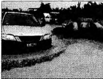
Haiti, Port au Prince

■ Uraganul Ernesto a scăzut în intensitate între Haiti și Cuba dar se îndreaptă spre Florida.