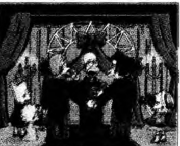
„The Simpsons”

actor în rol secundar într-o dramă”, pentru rolul din „The West Wing”, difuzat până de curând de NBC. Blythe Danner a obținut trofeul pentru „cea mai bună actriță în rol secundar într-o dramă” pentru rolul din serialul „Huff”, a cărui producție a fost sistată.