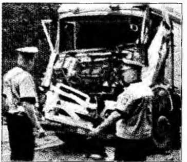
Polițiștii fac măsurători