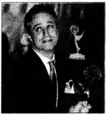
John Stewart

O modificare în procedurile de jurizare a fost operată în ideea de a conduce la o paletă mai diversificată de nominalizați. În urma acestei acțiuni, „Grey's Anatomy” și „Two and a Half Men” au câștigat mai multe premii, în timp ce „Lost”, care a luat trofeul „cea mai bună dramă” anul trecut, a plecat acasă fără nici un trofeu. „Cel mai bun serial de comedie” a fost desemnat „The Office” iar la „cel mai bun serial dramatic” a fost premiat „24”.