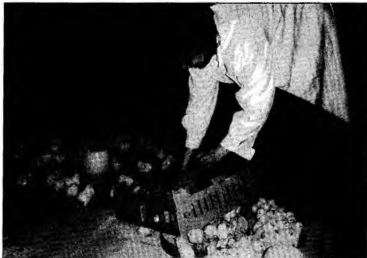
Valoarea subvenției pentru puii broiler a fost dublată

Pentru a primi subvenția agenții economice trebuie să prezinte Agenției de Plăți Hunedoara facturi fiscale de