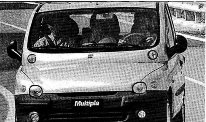
Prețul mașinilor second-hand va scădea

Prețul mașinilor second-hand va scădea în 2007, odată cu eliminarea taxelor vamale și a accizelor.