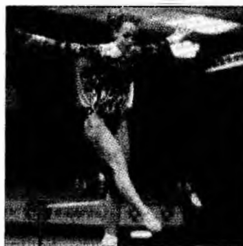
Sandra Izbașa la bărnă