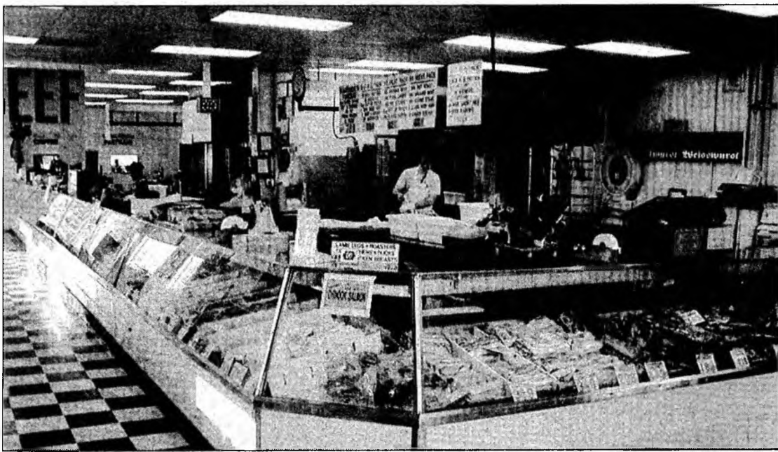
Prețul produselor din carne de porc se va majora 25-30%

Deva - Prețul cărnii de porc se va majora cu până la 30% din luna septembrie după ce materiile prime au înregistrat creșteri în această vară prin scumpirea utilităților. Un motiv în plus a fost și faptul că prețul materiei prime a crescut pe piața europeană, iar producția internă este mult sub nivelul cererii. „Din punct de vedere al firmei noastre, prețul la carnea de porc și la mezeluri se va menține același în primele zile ale lunii septembrie.