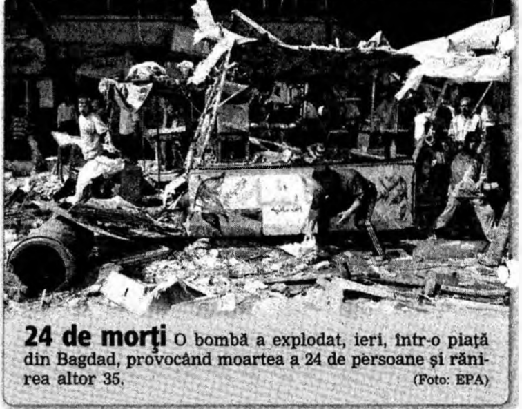
24 de morți O bombă a explodat, ieri, într-o piață din Bagdad, provocând moartea a 24 de persoane și rănierea altor 35.