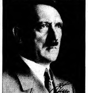
Adolf Hitler, posedat

Vatican (MF) - Adolf Hitler și Stalin au fost posedați de diavol, potrivit exorcistului-șef de la Vatican, Gabriele Amorth. Preotul Gabriele Amorth, exorcist în care are încredere Papa Benedict al XVI-lea, a făcut această declarație într-un interviu pentru Radio Vatican. Preotul Amorth a efectuat peste 30.000 de exorcizări de-a lungul timpului. „Sunt convins că nazișii erau cu toții posedați. Tot ce trebuie să faci este să te gândești la ce au făcut Hitler și Stalin. Aproape sigur erau posedați de diavol”, a spus el. Potrivit unor documente secrete de la Vatican, care au fost recent declassificate, Papa Pius al XII-lea a încercat să realizeze de la mare distanță exorcizarea lui Hitler, operațiune care nu a avut succes.