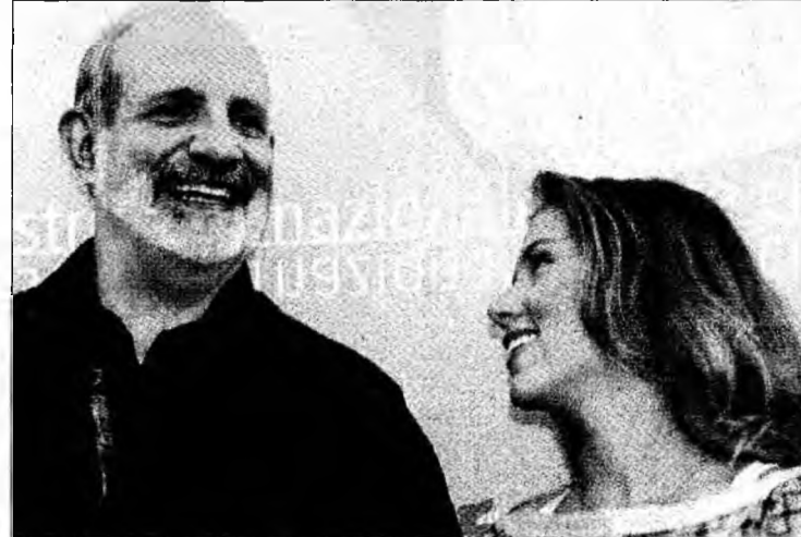
Brian de Palma alături de Scarlett Johansson

Veneția (MF) - Filmele americane din competiția pentru Leul de Aur de la Veneția speră să atragă atenția publicului la festivalul care a început ieri, pentru a-și crește astfel șansele de a intra în cursa pentru Oscarurile din 2007. Festivalul, care durează 11 zile și are loc la Lido, a început cu filmul „The Black Dahlia”, povestea a doi polițiști care primesc misiunea să ancheteze o crimă brutală comisă asupra unei actrițe necunoscute publicului. Acțiunea are loc în 1947. Filmul, regizat de Brian