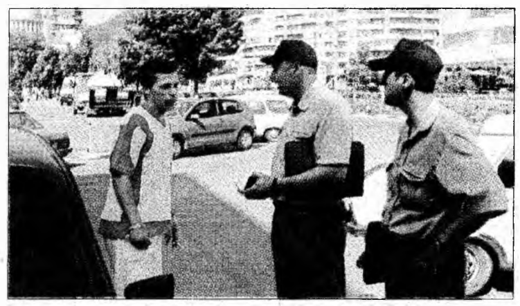
Polițiștii comunitari nu au mijloace de constrângere