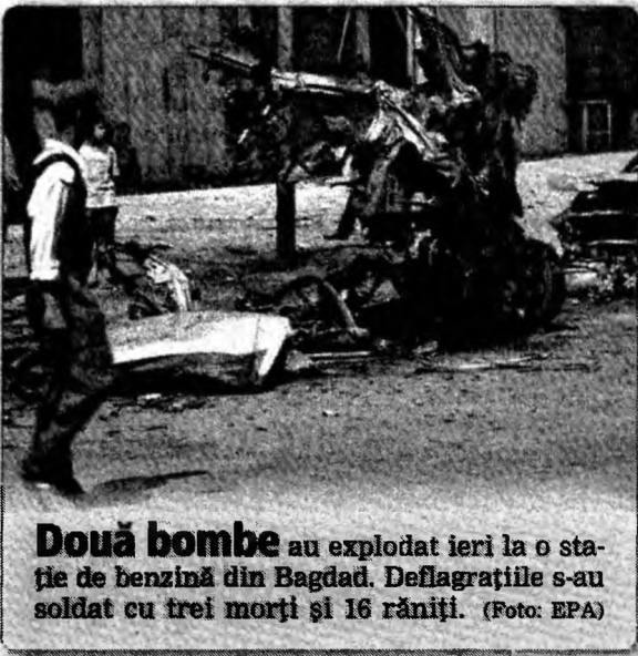
Două bombe au explodat ieri la o stație de benzină din Bagdad. Deflagrațiile s-au soldat cu trei morți și 16 răniți.

În aceste condiții, ministrul de Externe a afirmat că România s-a asigurat că procedurile formale nu mai pot „da dureri de cap” Bucureștiului.