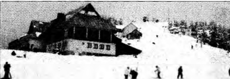
Zăpada revine în stațiunea Parâng