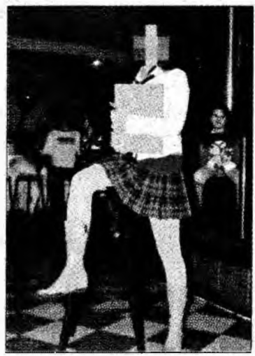
Un pas mic între modeling și... damă de companie