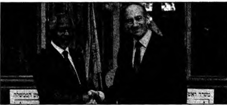
Kofi Annan și Ehud Olmert

Operațiunile militare israeliene din Liban, declanșate pe 12 iulie 2006 împotriva milițiilor Hezbollah, s-au soldat cu distrugerea unei mari părți a infrastructurii acestei țări. Guvernul a declarat Libanul drept țară calamitatoasă și a solicitat asistență internațională și ajutoare imediate - alimente, medicamente, materiale pentru adăpostirea refugiaților.