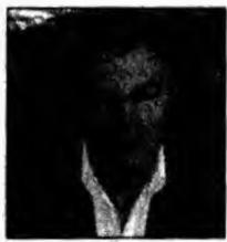
Radu Berceanu