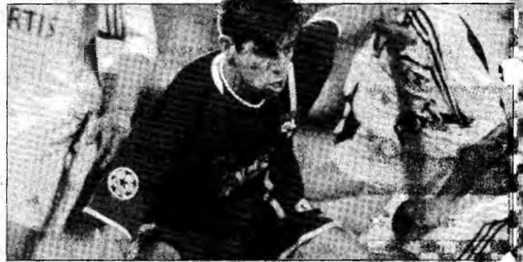
Brazilianul Juninho, de la Lyon, e considerat cel mai bun executant al loviturilor libere din lume.