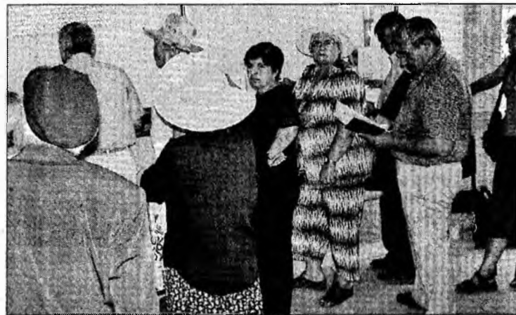
Casa Județeană de Pensii

inscriere nouă la pensie. Având în vedere prevederile art.7 alin.(3) din Legea nr.19/2000, odată cu trecerea la pensia pentru limită de vârstă, persoana în cauză trebuie să opteze între pensia pentru limită de vârstă și pensia de urmaș. S-a făcut acest lucru și față de pensia de limită de vârstă (din sectorul agricol) pensia de urmaș are un quantum mai mare. Nu le puteți încasa pe amândouă din motivul menționat. Cazul dumneavoastră a fost înaintat Direcției de îndrumare Metodologică din