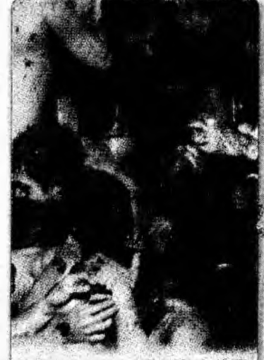
Tomatina în jur de 40.000 de „luptători” au participat la „Tomatina”. bătaia cu roșii care are loc, în fiecare an, pe străzile orașului spaniol Bunol.