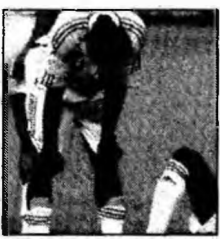
Makelele e epuizat

Paris (MF) - Mijlocășul Claude Makelele, care face obiectul unei polemici între selecționerul Franței, Raymond Domenech și Jose Mourinho, antrenorul său de la Chelsea, ar putea disputa aproape 70 de meciuri în acest sezon. În cazul în care Chelsea va ajunge în finala Cupei Angliei, a Cupei Ligii, a Ligii Campionilor, adăugând Supercupa Angliei și meciurile din campionat, francezul ar putea juca peste 60 de meciuri. Dacă se adaugă cele șase meciuri ale Franței contând pentru Euro-2008 și cele două partide amicale ce ar urma să fie disputate până în iunie 2007, Makelele ar putea ajunge la 70 de meciuri în 10 luni.