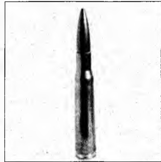
Cartușul de la Baru Mare