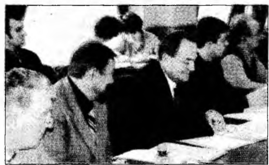
Consiliul Județean Hunedoara