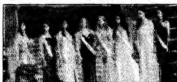
Reginele frumuseții

În pofida violențelor și disperării, un fost activist (interpretat de Clive Owen) este de acord să ajute la transportarea unei femei africane însărcinate într-un loc sigur aflat în largul mării. Nașterea copilului ar putea contribui la salvarea lumii de la dispariție. Filmul oferă o viziune întunecată asupra unui viitor nu foarte îndepărtat.