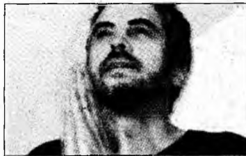
Alfonso Cuaron

■ Regizorul mexican Alfonso Cuaron și-a prezentat filmul „Children of Men” la Veneția.