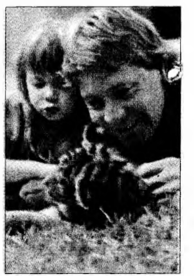
Steve și Bindi

În iunie 2006, o broască țestoasă pe nume Harriet a murit în grădina lui Irwin. Țestoasa gigant de Galapagos a aparținut, după toate probabilitățile, colecției lui Charles Darwin. Irwin, care a prins primul crocodil la vârsta de nouă ani, a avut mai multe întâlniri aproape mortale cu animale periculoase dar spunea adesea că nu a fost mușcat de vreun șarpe veninos sau de vreun crocodil.