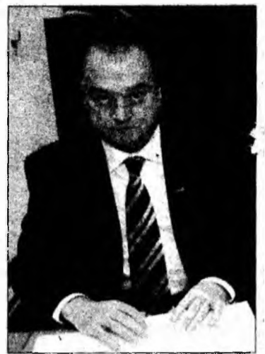
Ministrul Administrației și Internelor, Vasile Blaga

Vasile Blaga va avea, de asemenea, o întâlnire cu Susanne Kastner, vicepreședintele Bundestag, întâlnire care constituie oportunitate de reiterare a unor aspecte de interes pentru parlamentarii germani, din domeniul de competență al Ministerului Administrației și Internelor.