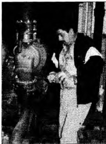
În prima lună de iarnă, căldura se va factura la 107,5 lei/Gcal

Conform calendarului anual se estimează că în perioada 10-15 octombrie va începe furnizarea agentului termic.