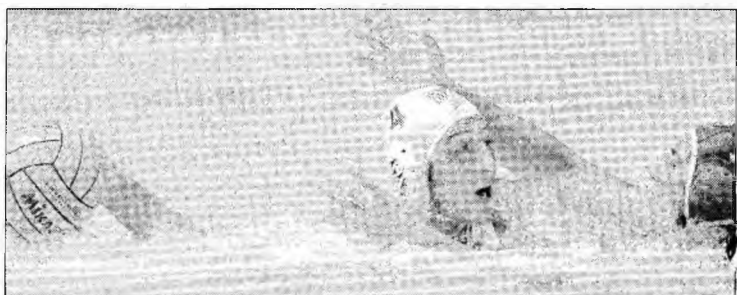
Naționala de polo impresionează la CE 2006

gariei: „Adevărul este că echipa Bulgariei n-a jucat niciodată atât de prost, mai ales împotriva unui adversar nu chiar atât de înspăimântător. Echipei i-a lipsit organizarea, fundașii doar au degajat mingea, iar Stilian Petrov încerca să acopere găurile. N-am avut nici o idee de joc. Poate că Stoicikov comunică cu Dumnezeu, pentru că nu meritam acest egal”.