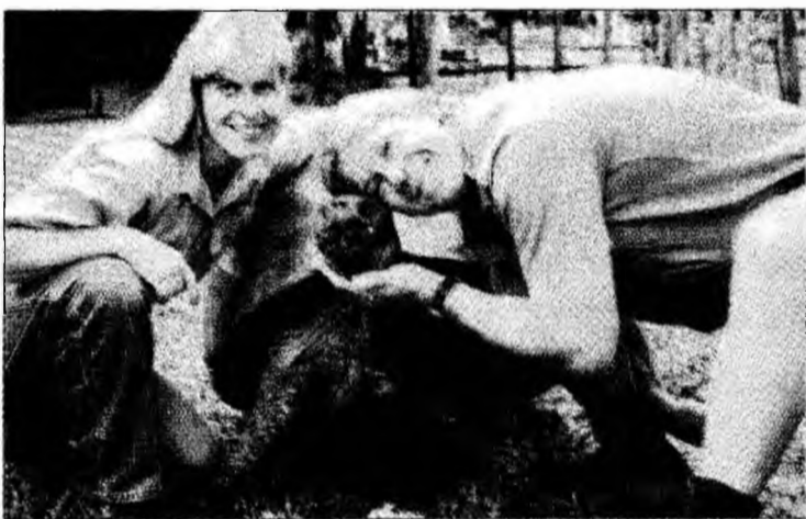
Terri, Steve Irwin și broasca țestoasă Harriet

■ Celebrul „vânător de crocodili” Steve Irwin a murit strâpuns de țepii unui pește marin.