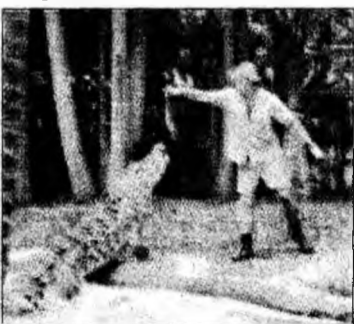
Hrănind crocodilul

El și-a întâlnit soția de origine americană, Terri, la