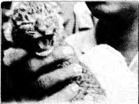
Puiul de leopard este un mascul în vârstă de numai patru zile care, împreună cu mama lui, va crește în parcul Mahananda Wild Life Sanctuary, India.