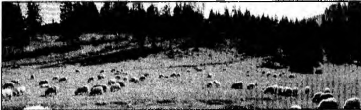
Se dau bani pentru întreținerea pajștilor montane

Deva - Beneficiarii sprijinului sunt producătorii agricoli (persoane fizice, persoane juridice, asociații ale crescătorilor de bovine, ovine, ca-