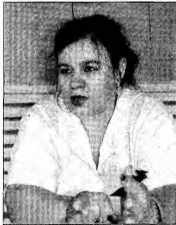
„Nu ne putem odihni!”

za focuri de artificii după ora 23.00, iar dacă acest lucru se întâmplă, el constituie contravenție. O să le cer oamenilor din Primărie să verifice în perioada când se organizează nunți dacă se respectă acest program, iar în momentul în care nu se respectă vom trece la sancțiuni. Legat de petrecăreții care tulbură liniștea dimineața, voi lua legătura cu directorul Serviciului Poliție Comunitară pentru a trimite, în fiecare sâmbătă, câte o patrulă în zonele unde sunt nunți.