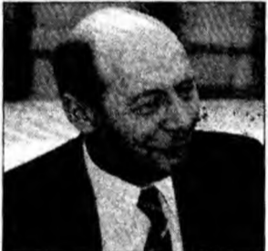
Traian Băsescu

București (MF) - Președintele României a cerut, ieri, Coreei de Nord să revină la negocierile multilaterale privind dezarmarea nucleară și să impună din nou moratoriul privind testele cu rachete cu rază lungă de acțiune. „Credem că singurul format viabil pentru rezolvarea problemelor de securitate în Peninsula Coreea este cel al negocierilor în șase”, a declarat Traian Băsescu, într-un interviu acordat agenției de știri Yonhap. Negocierile în șase, cu participarea celor două Corei, a Chinei, Statelor Unite, Japoniei și Rusiei, sunt blocate din luna noiembrie a anului trecut. La începutul lunii iulie, Coreea de Nord a testat șapte rachete, inclusiv una de tip Taepodong-2 cu rază lungă de acțiune.