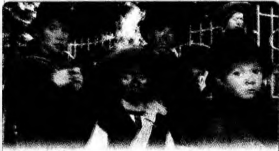
Coșarii Duminică a avut loc, în St. Maria Maggiore (Italia), a 25-a întâlnire internațională a coșarilor, la care au fost prezenți 1.000 de reprezentanți din 15 țări.

● Dispăruți. Patru persoane au fost date dispărute după trecerea ciclonului John în nord-vestul Mexicului, unde au fost înregistrate inundații puternice.