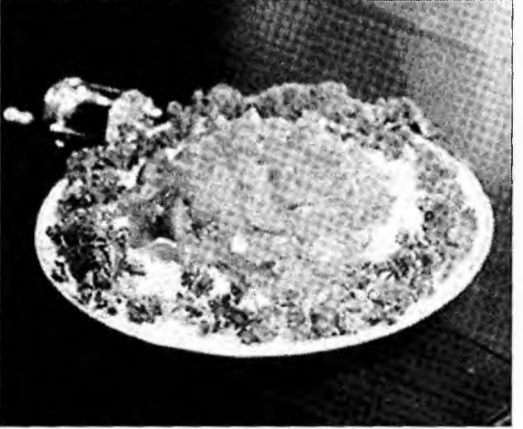
Poftă bună!