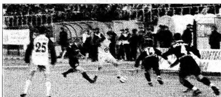
Meciul CFR Cluj-Jiul va fi televizat de TVR 2

Primul meci al minerilor care va fi transmis este cel din etapa a VI-a, în care Jiul va juca în deplasare, sâmbătă, 9 septembrie, cu actuala lide-