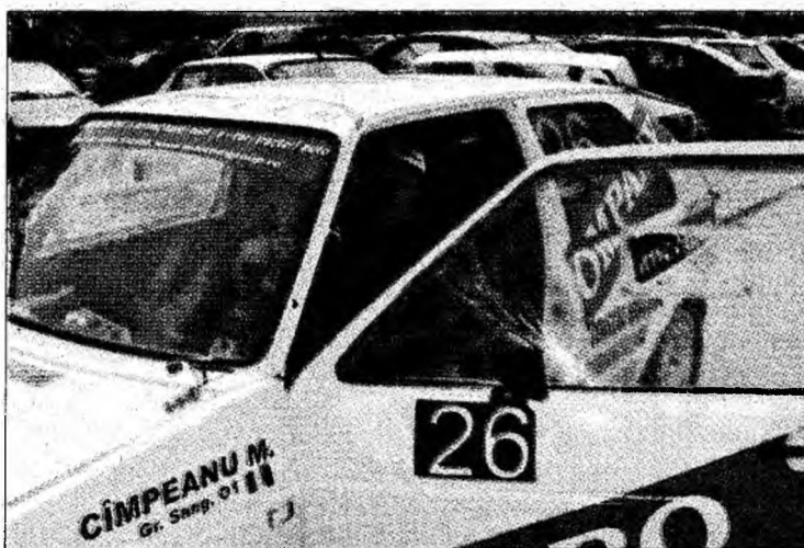
Performanțele mașinii pilotate de Câmpeanu sunt modeste

■ Pilotul brădean e nemulțumit de performanțele VW-ului Golf pe care concurează.