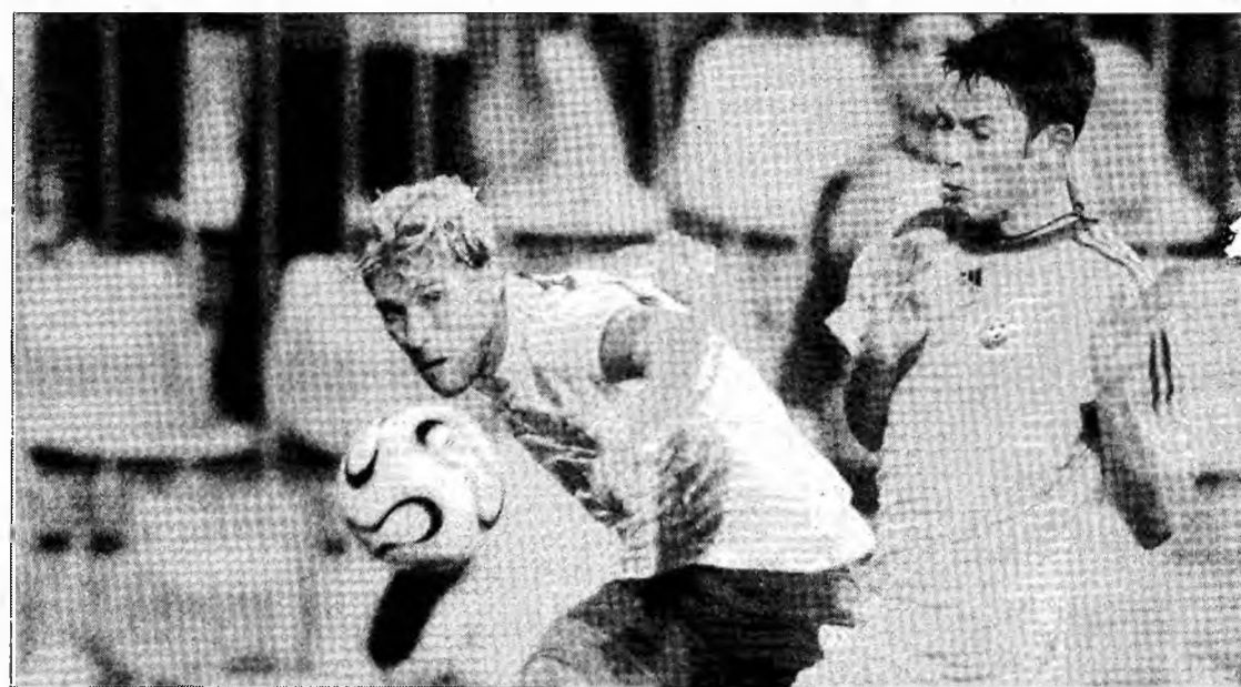
România a început cu stângul campania de calificare la Euro 2008

București (MF) - Naționala de polo a României a învins, ieri, la Campionatul European de la Belgrad, echipa Slovaciei, cu scorul de 7-6 (1-2, 4-2, 1-1, 1-1), în cea de-a patra partidă a grupei A. Elevii lui Vlad Hagi au învins la limită naționala Slovaciei, deși au început, din nou, mai slab. Conduși după prima repriză, poloștii români au stabilit soarta partidei în repriza secundă, pe care au câștigat-o