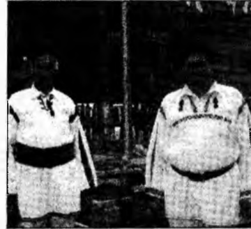
Ciobani de la Beriu