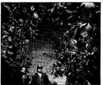
La mere subvenția este de 120 lei/tonă

beneficia de un sprijin financiar de 120 lei pentru o tonă de mere, 200 lei pentru o tonă de prune, respectiv 300 lei pentru fiecare tonă de piersici sau struguri de masă. Cererile pentru subvenții trebuie depuse la Agenția de Plăți și Intervenție pentru Agricultură, în termen de 30 de zile de la livrare.