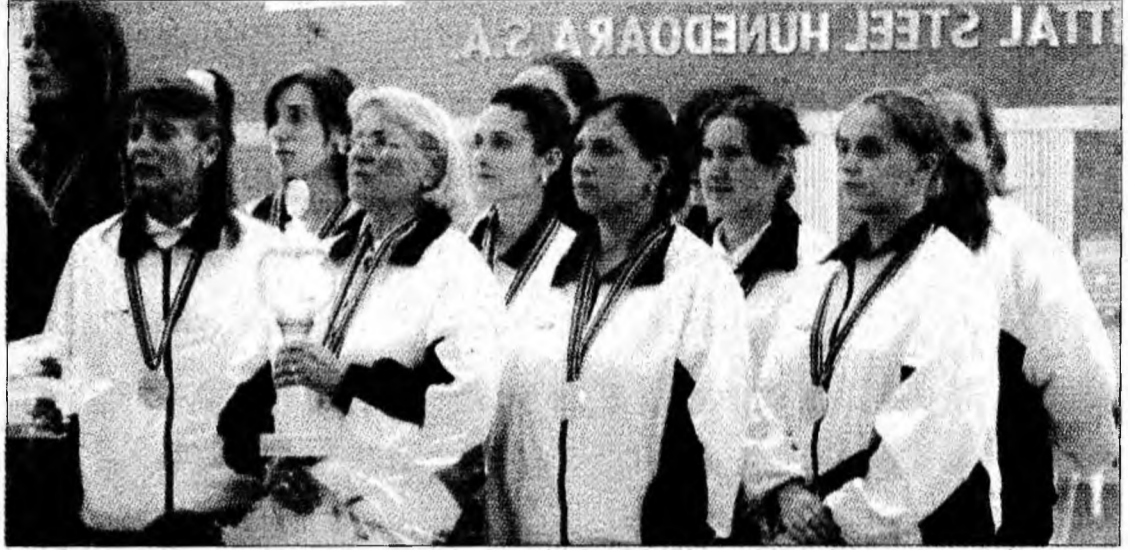
Rapid București este vicecampiona Europei

Deva - Apreciată ca cea mai importantă competiție din acest an organizată de județ, cea de-a 18-a ediție a Cupei Europei la popice s-a încheiat sâmbătă, la Hunedoara, cu succesul echipei Brest Cernikca din Slovenia, în competiția feminină, și cu cea a formației germane Staffelberg Staffelstein în concursul masculin. Ajunsă în finală, CS Rapid Voința București s-a clasat pe locul II la feminin. Trebuie remarcat faptul că jucătoarele slovene au invins cu 6-2 în disputa cu reprezentanta țării noastre CS Rapid Voința București. Cele mai bune rezultate ale echipei române