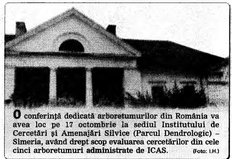
O conferință dedicată arboreturilor din România va avea loc pe 17 octombrie la sediul Institutului de Cercetări și Amenajări Silvice (Parcul Dendrologic) - Simeria, având drept scop evaluarea cercetărilor din cele cinci arboreturi administrate de ICAS.

pagina de Internet: www.mapn.ro/recrutare . Un soldat sau gradat voluntar va beneficia de: venituri salariale care pornesc de la 1000 lei, la care se adaugă diferite sporuri în funcție de specialitatea militară și de condițiile de muncă, echipament gratuit, compensație pentru chirie în cazul în care nu are locuință, asistență medicală gratuită, posibilitatea de continuării studiilor, precum și perspective de evoluție într-o carieră militară permanentă.