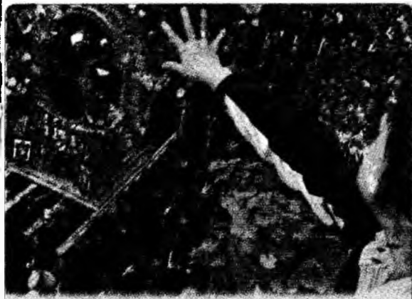
O femeie aruncă flori, de la balcon, în timpul procesiunii „Domnul Minunilor”, care se desfășoară în Lyma, Peru.

● Sumă record. O machetă a Starship Enterprise a fost vândută cu o sumă record, 576.000 $, în cadrul unei licitații organizate la New York și care a marcat celebrarea a 40 de ani de seriale science-fiction. Miniatura navei Enterprise-D, cu lungimea de 198 de centimetri a fost utilizată în secvențe ale „Star Trek”. (MF)