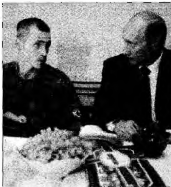
Vladimir Putin

■ Copiii Rusiei l-au prezentat pe președintele Vladimir Putin în diferite ipostaze.