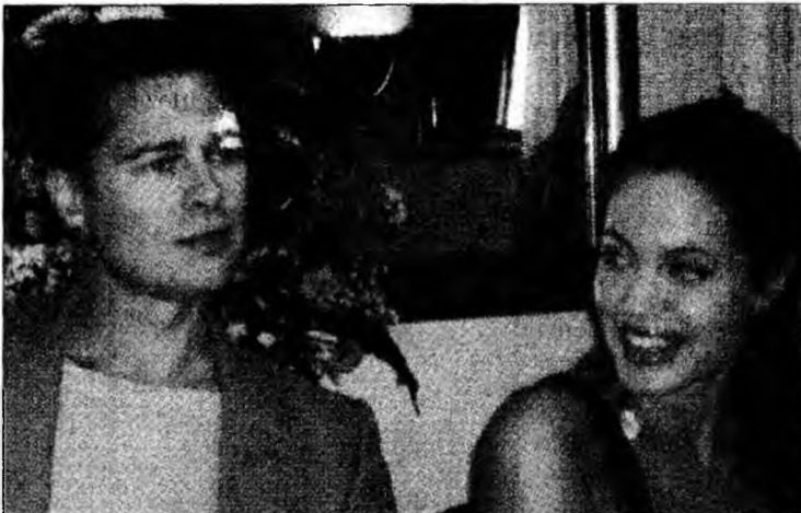
Brad Pitt și Angelina Jolie

■ Angelina Jolie e dezamăgită că ea și Brad nu vor filma pentru producția „A Mighty Heart”.