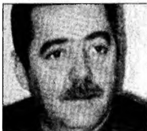
Cezar Preda

Riga (MF) - Guvernul de coaliție de centru-dreapta din Letonia a câștigat 43,3 la sută din voturi, în primele alegeri legislative din statul baltic, organizate după integrarea țării în UE, în 2004, potrivit rezultatelor definitive publicate ieri dimineață de Comisia de control a alegerilor. Premierul Aigars Kalvītis a sărbătorit rezultatul la ieșirea de la urne ca pe un semn de victorie. Analizii au declarat că rezultatul indică faptul că Partidul Poporului, aflat la guvernare alături de Verzi, Uniunea Fermierilor și partidul Primul din Letonia, vor rămâne în guvernare în combinație cu o altă formațiune care se va alătura coaliției.