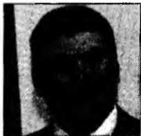
Aigars Kalvītis

Buzău (MF) - Vicepreședintele Partidului Democrat Cezar Preda a declarat, ieri, la Buzău, că susține ideea organizării alegerilor anticipate. Parlamentarul buzoian a spus că este adeptul acestei idei pentru că este nevoie de o majoritate stabilă pentru a guverna țara. Pe de altă parte, vicepreședintele PD a mai spus că a susținut și va susține în continuare în interiorul PD participarea la alegerile europarlamentare pe liste separate. Democratul Radu Berceanu a susținut, joi, că, în încercarea de a-i convinge pe liberali să accepte declanșarea de alegeri anticipate, PD a propus PNL ca actualul prim-ministru, Călin Popescu Țăriceanu, să conducă Guvernul încă doi ani după alegeri.