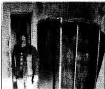
Una din camerele părăsire

Condițiile insalubre, lipsa apei curente, a gazului, precum și a curentului fac din Căminul nr. 3 doar un adăpost contra ploii și vântului, în ale cărui camere fiecare a reușit să-și încro-