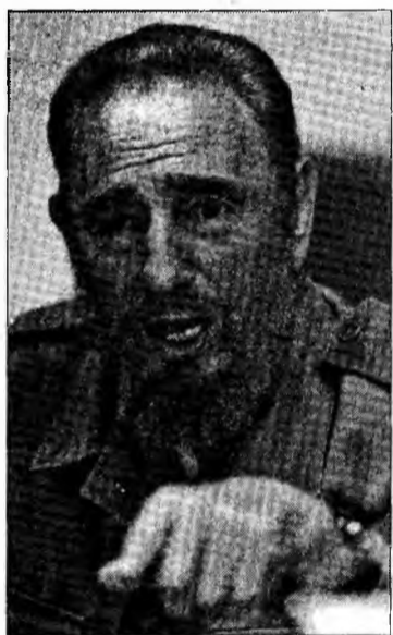
Fidel Castro

Fidel Castro nu a mai fost văzut la televiziune sau în fotografii după summitul Țării Nealiniate, dintre 15 și 17 septembrie, în urmă cu trei săptămâni.