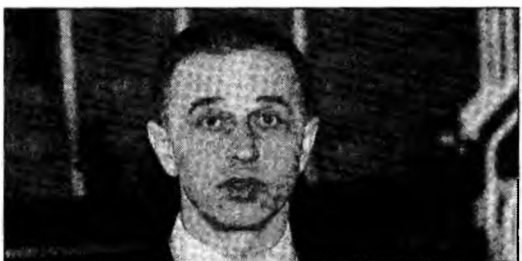
Mircea Geoană

Geoană a declarat că organizarea Congresului extraordinar nu este motivată de un „subterfugiu” de a se prelungi mandatul actualii conduceri. El a precizat că este important ca PSD să organizeze Congrese distincte pentru modificarea Statutului și pentru alegerea conducerilor naționale și teritoriale.