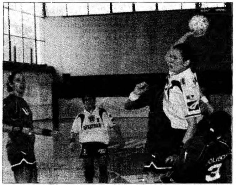
Cartaș a trecut greu de apărarea clujencele

handbal feminin. Adevărul este că de mult nu l-am văzut atât de cătrănit pe Munteanu, dar probabil, are motivele lui, bănuim, foarte serioase. Oricum, vorbele au fost spuse în urma înfrângerii pe care devencele au suferit-o pe teren propriu cu scorul de 21-23. Jolidon s-a dovedit o nucă prea tare de spart pentru Cetate, o echipă solidă, matură și mai experimentată. Acest lucru s-a văzut cu deosebire în partea a doua a jocului. Deși s-a pornit de la 12 - 12 la pauză, clujencele au înclinat tot mai mult balanța în favoarea lor. Încet, dar sigur. Nu la diferență mare, dar nu le-au lăsat devencelor nici o șansă. Trebuie spus însă că handbalistele noastre au avut de