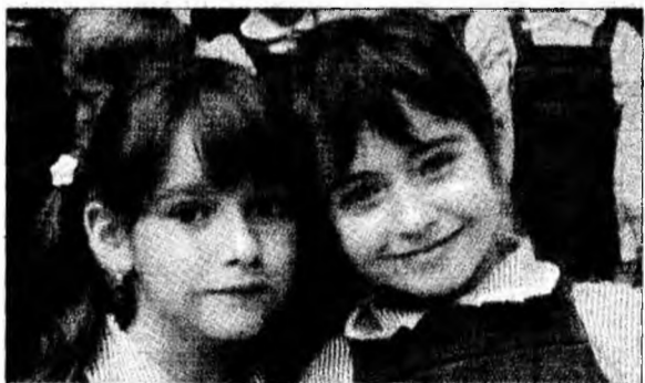
Împreună de la grădiniță la școală