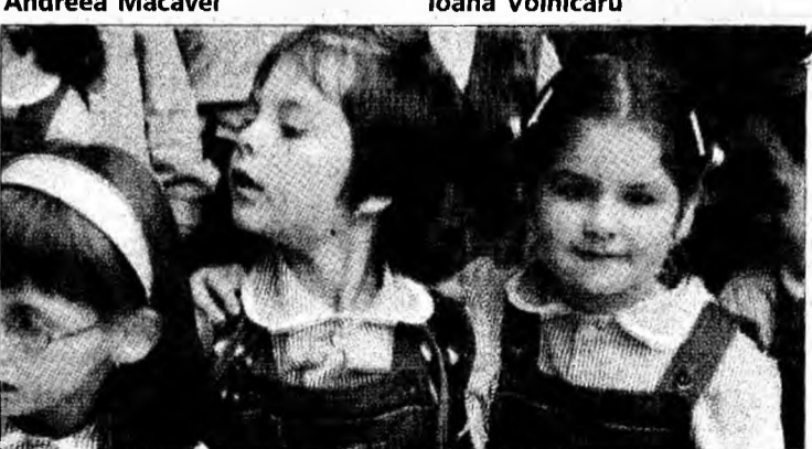
Colegi în clasa I