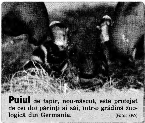
Puiul de tapir, nou-născut, este protejat de cei doi părinți ai săi, într-o grădina zoologică din Germania.

Paris (MF) - Radiodifuzorii britanici BBC și ITV au câștigat premiile pentru cele mai bune reportaje radio și de televiziune la a 13-a ediție a premiilor Bayeux pentru corespondenții de război, care au fost decernate sâmbătă seară. Lucrările câștigătoare au fost alocate dintr-un număr de 28 de reportaje preselecționate și realizate în perioada 1 iunie 2005 - 31 mai 2006. Juriul care a decernat premiile a fost prezidat de secretarul general al organizației Reporters sans Frontières, Robert Ménard. Premiile Bayeux pentru corespondenții de război sunt însoțite de o recompensă financiară în valoare de 7.600 euro entru fiecare categorie.