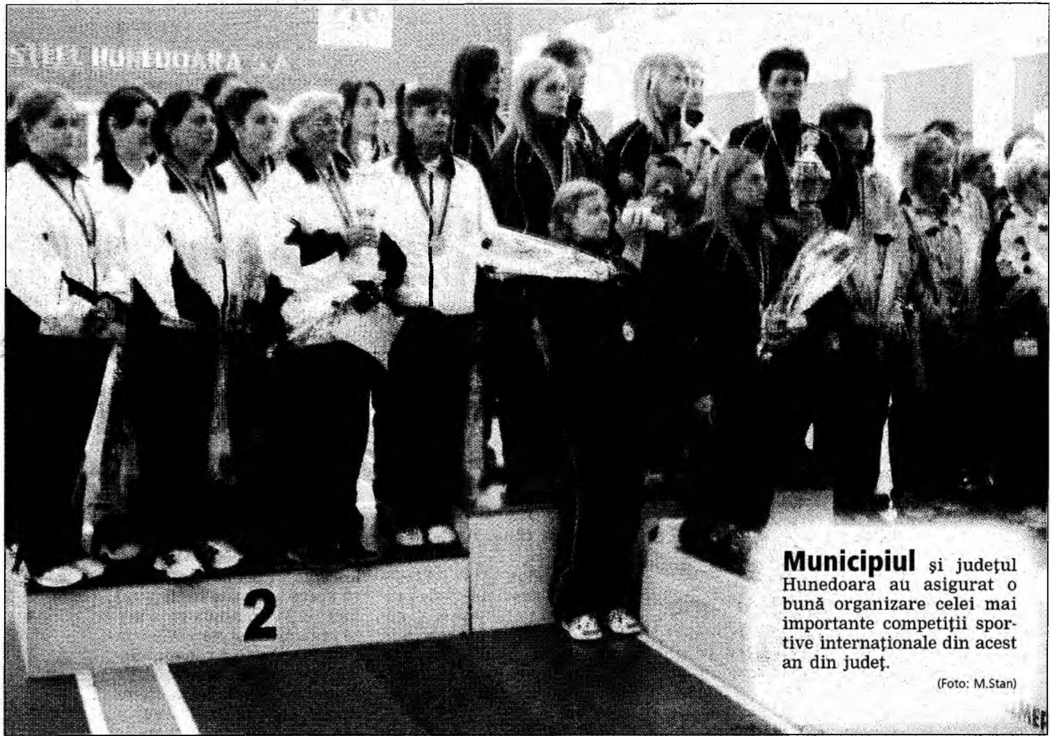
Municipiul și județul Hunedoara au asigurat o bună organizare celei mai importante competiții sportive internaționale din acest an din județ.