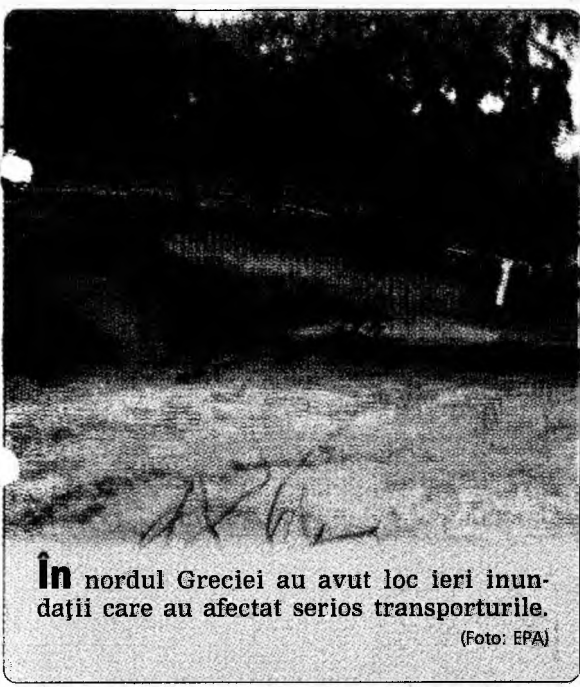
În nordul Greciei au avut loc ieri inundații care au afectat serios transporturile.