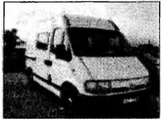
• vând Renault Master, af 2002, preț 9.150 euro. Tel. 776131. (T)