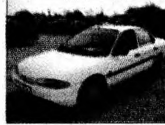
• vând Ford Mondeo, af 1994, benzină, 2 airbag-uri, servofrână - direcție, sistem antifurt, preț 3700 euro, neg. Tel. 0721/270581. (T)