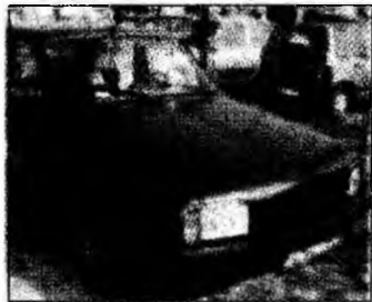
• vând Dacia 1310, af 1996, unic proprietar, preț 2000 euro, negociabil. Tel. 247678. (T)