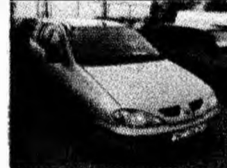
• vând Renault Megane 1.9 Diesel, af 2001. Tel. 0722/677995. (T)