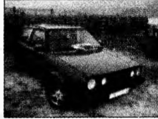
• vând Golf II 1.6 Diesel, elemente 90, trapă, tehnic foarte bună. Tel. 0721/223774. (T)