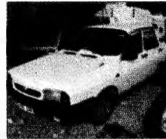
• vând Dacia 1310, cutie 5 trepte, af 1995. Tel. 0722/442201. (T)