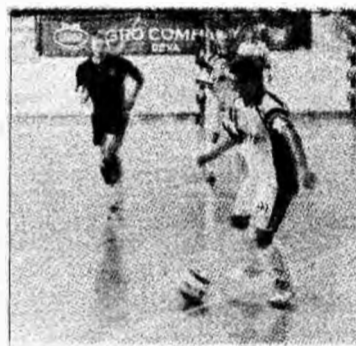
Devenii nu au voie să piardă

promovata Energia Focșani, iar FC CIP e doar pe cinci, din cauza celor două restanțe. „Toate echipele din campionat vor încerca să ne pună probleme pentru că avem performanțe internaționale. Chiar și așa băieții nu au voie să piardă nici un meci în competiția internă, indiferent de faptul că avem un program greu și încărcat”, afirma George Mara, președintele executiv al FC CIP. „După meciul de la Craiova, jucăm, sâmbătă, în etapa a șaptea, la