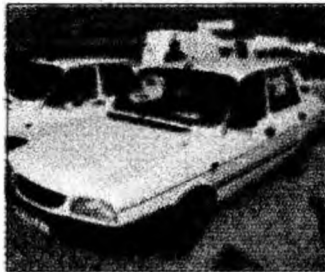
• vând Dacia 1310, af 2000, VT 2008, M 1400, 5 viteze, asigurare radiată, unic proprietar, stare impecabilă. Tel. 0724/561138. (T)