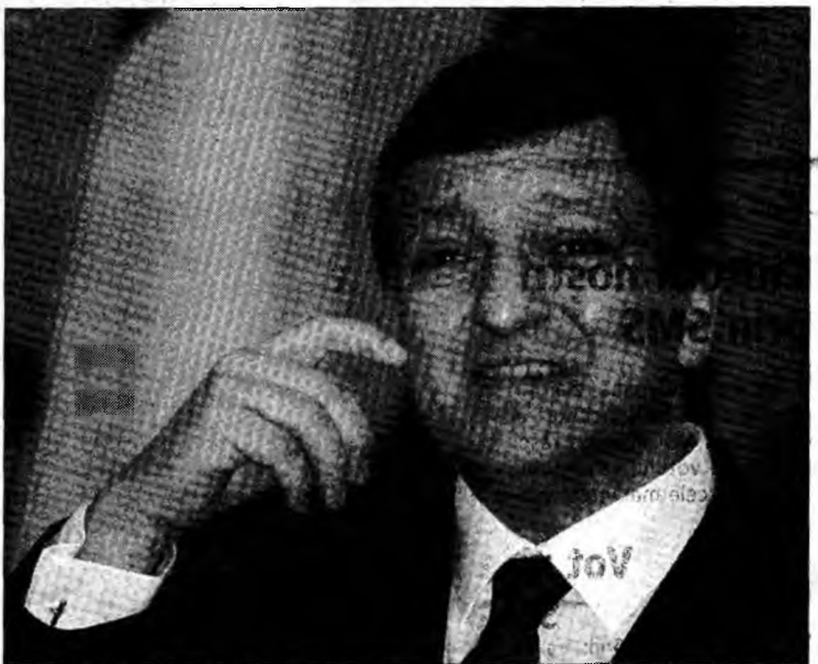
Jose Manuel Durao Barroso va alege comisarii

Potrivit Tratatului de la Nisa, România și Bulgaria au dreptul la un reprezentant în cadrul Executivului european, de la Bruxelles. Însă în