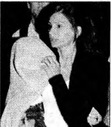
Bona cu copilul

Copilul a părăsit luni aeroportul din Lilongwe.