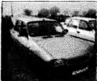
• vând Dacia 1310, af 1998, GPL, RAR 2008, preț 68 milioane lei. Tel. 0721/210532. (T)