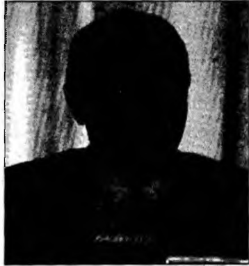
Traian Băsescu

310/26.09.2006 a Colegiului Consiliului Național pentru Studiul Arhivelor Securității privind-l pe Traian Băsescu, care face referire la aceste documente.