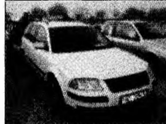
• vând VW Passat TDI PD, af 2003, abs, esp, 4 airbag, pachet Winter Plus, preț 10.800 euro, neg. Tel. 0741/077797, 0788/970470. (T)