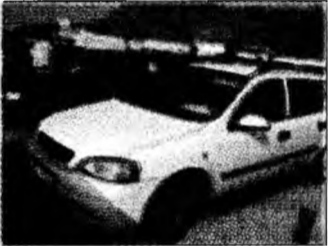
• vând Opel Astra Caravan 1,7 DTI, af 2001, comenzi volan, geamuri și oglinzi electrice, preț 7.350 euro, negociabil. Tel. 0722/966280. (T)