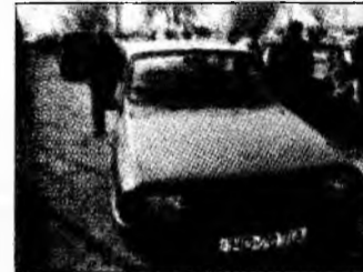
• vând Dacia break 1310, af 1989, vopsea originală, stare perfectă, preț 55 milioane lei. Tel. 282341, 0729/811033. (T)