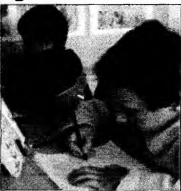
Elevii vor avea în școli tot ce-și doresc

Deva - Această sumă reprezintă, comparativ doar cu anul 2006, o creștere de 132,1%. Este pentru prima dată când Educației îi sunt alocate astfel de sume. La procentul de 5,2% se adaugă 1.910,8 milioane de lei pentru componenta de cercetare, precum și 876,16 milioane de lei pentru asigurări și asistență socială (alocația). Acest buget va permite continuarea programelor derulate sau începute în 2006, care, dacă nu au