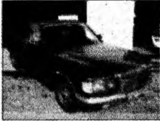
• vând Mercedes 126 SEL 3000 Diesel 81, full-option, motor 63.000 km. Tel. 0744/544999, 0722/744203, 00381638787839. (T)