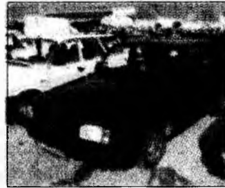
• vând Dacia, af 1998 decembrie, culoare vișiniu-metalizat, stare bună, sunt al 2-lea proprietar. Tel. 0740/122840. (T)