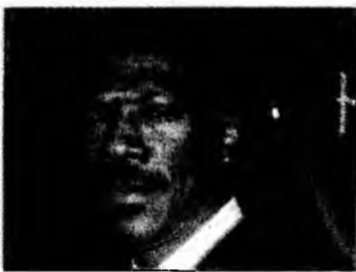
Eddie Murphy

Los Angeles (MF) - Actorul Eddie Murphy și Mel B, membră a fostei trupe britanice Spice Girls, se vor căsători luna viitoare la Los Angeles, conform unor surse apropiate cuplului. Murphy (45 ani) și Mel B (31 ani) au făcut cunoștință prin prieteni comuni