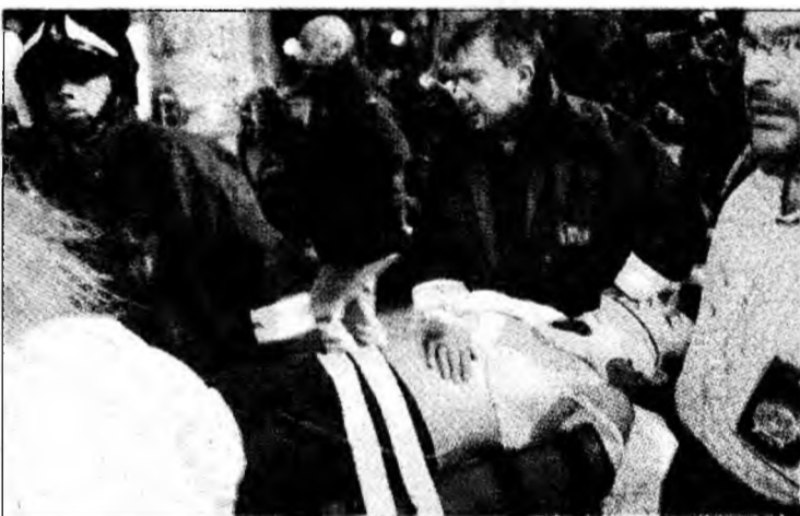
Echipajele de intervenție au scos răniții

Mecanicul garniturii de metrou a decedat în urma rănilor suferite, la scurt timp după ce a fost extras dintre fiarele contorsionate ale va-