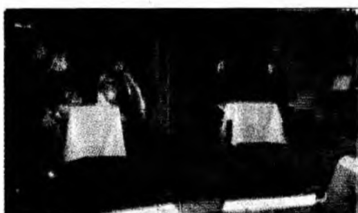
Distribuția cuprinde aproape toți angajații

Deva (M.S.) - Reintroducerea educației rutiere în școli ar putea preveni o parte din accidentele de circulație care se produc în România, apreciază senatorul hunedorean Viorel Arion (PNL). În opinia sa, cursurile de educație rutieră ar putea începe încă din ciclul gimnazial și ar putea fi însoțite de manuale adecvate. Pentru a-și susține ideea, parlamentarul liberal a adresat o interpelare ministrului educației, Mihail Hărdău, în care solicită date despre campaniile desfășurate în școli pentru prevenirea și combaterea accidentelor rutiere, precum și despre viitoarele acțiuni ce ar urma să fie programate în unitățile de învățământ. Potrivit senatorului Arion, în primele șase luni ale acestui an, polițiștii au constatat 10.997 infracțiuni comise la regimul circulației rutiere, soldate cu 2.764 de accidente grave în urma cărora și-au pierdut viața 976 de persoane, iar alte 2.257 au fost rănite. În ceea ce privește județul Hunedoara, în anul 2005 au avut loc 662 de infracțiuni la regimul circulației rutiere, cu 159 de accidente grave în care au decedat 81 de persoane și 122 au fost rănite. Statisticile mai arată că aproape jumătate din accidentele de circulație s-au produs din cauza neatenției pietonilor care au traversat strada prin locuri nepermise.