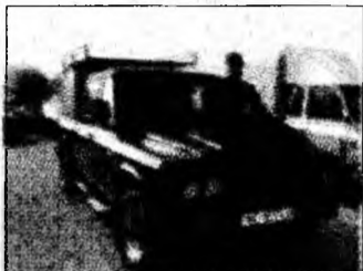
• vând Aro 324 Diesel, af 1998, preț negociabil, și remorcă 1,5 tone, preț 5000 euro. Tel. 0723/664539. (T)