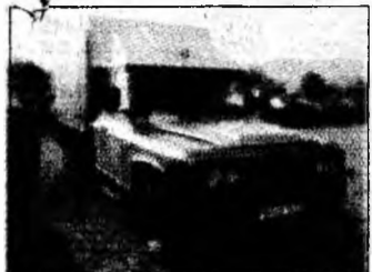
• vând Aro camionetă, motor Brașov, servo, af 1999, preț 3.300 euro, negociabil. Tel. 0746/914772. (T)