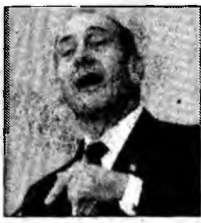
Ehud Olmert