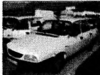
• vând Dacia break, af 2004, injecție, unic proprietar, acte la zi, impecabilă, preț 12.700 ron, negociabil. Tel. 0723/174523. (T)