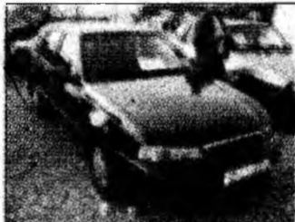
• vând sau schimb Cielo, af 2000, climă, muzică, unic proprietar, preț 5.500 euro, neg. Tel. 0722/369529. (T)