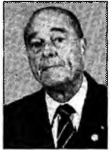
Jacques Chirac

Odată cu promulgarea și publicarea legii, procedurile de ratificare a Tratatului s-au încheiat în Franța, comentează Deutsche Welle în pagina electronică. Adunarea Națională a Franței a ratificat Tratatul de aderare la 27 iunie, iar Senatul francez la 3 octombrie, fără a ridica obiecții majore.