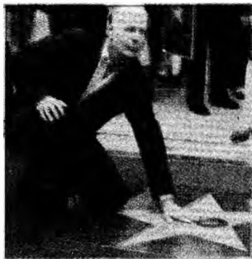
Bruce Willis are stea

Bruce Willis este a 2.321-a personalitate care primește o stea pe celebrul Bulevard al gloriei, care se întinde pe două artere ale istoricului cartier al cinematografilei americane. Stelele onorează