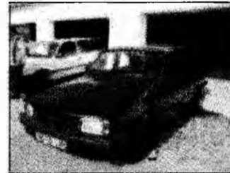
• vând Dacia break, af 1996, stare impecabilă, preț 56 milioane lei. Tel. 0720/509575. (T)