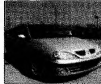
• vând Renault Megane 2003, 35.000 km, climă, 4 airbag-uri, ABS, full electrice, radiocasetofon, 8200 euro. Tel. 0744/208283, 21145. (T)