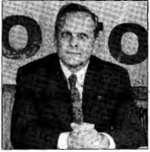
Theodor Stolojan