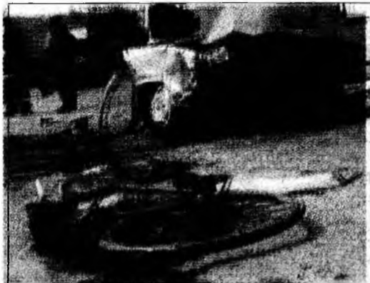
Accidentele rutiere provoacă suferință.

● Amenzi. În urma acțiunilor și controalelor efectuate în trasee, în ultimele 24 de ore s-au aplicat 142 amenzi la legea circulației, din care 25 la regimul de viteză și s-au ridicat în vederea suspendării 9 permise de conducere, din care 4 pentru consum de alcool și 12 certificate de înmatriculare. (I.H.)