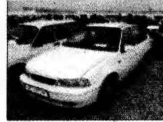
• vând Cielo af 1999, 4 geamuri electrice, alarmă, sonorizare Panasonic. Tel. 0722/567347. (T)