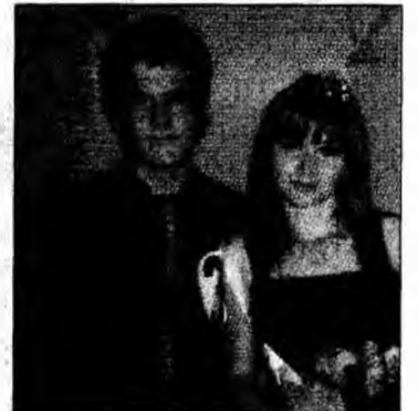
Miss și Mister 2006