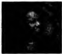
Condoleezza Rice