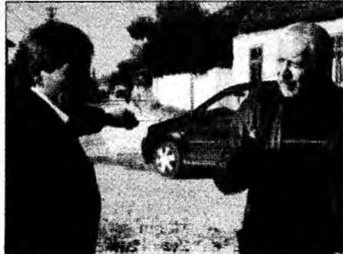
Primarul și Micloș - poziții ireconciliabile