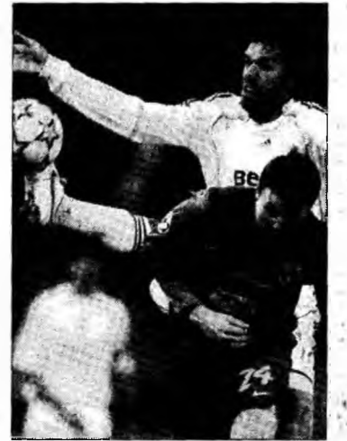
V. Nistelrooy a marcat golul cu numărul 50 în Ligă

doua am echilibrat jocul, dar am făcut din nou erori. Saban nu a avut o zi tocmai fericită. Am mizat pe experiența superioară a lui Saban comparativ cu Stancu, dar la acest nivel orice greșală se plătește. Noi am făcut din nou greșeli și le-am plătit imediat”, a spus antrenorul stelist.