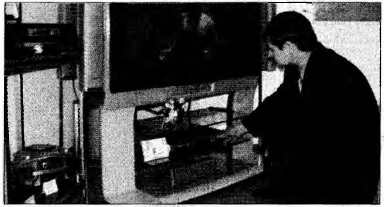
Majoritatea produselor vândute prin „credite cu buletinul” erau electrocasnicele

Potrivit normei BNR, rata lunară plătită pentru un credit nu poate depăși 30% din venitul net al solicitantului în cazul unui împrumut pentru consum și 35% în cazul unui credit imobiliar. Venitul net va fi stabilit după scăderea cheltuielilor de întreținere. În cazul în care o persoană are mai multe credite în derulare, angajamentele totale de plată lunară nu trebuie să depășească 40% din veniturile nete. În aceste condiții, magazinele care vindeau produse, electrocasnice în special, doar pe bază de buletin și fără garanți, vor înceta acest gen de creditare.