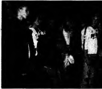
O probă pentru fiecare

Deva (M.S.) - Colegiul Național Traian a avut balul bobocilor, ieri, la Sala Sporturilor din Deva. Privind atâția tineri frumoși, nu ne puteam gândi decât la cum a fost și pe vremea noastră. Dar obiceiurile se pare că se păstrează. Nu au lipsit concursul de Miss și Mister și deja celebrele probe ca: proba-surpriză, proba de cultură generală și cea opțională. Dansul și prezentările de modă au dat o culoare aparte atmosferei. Miss Colegiul Tra-