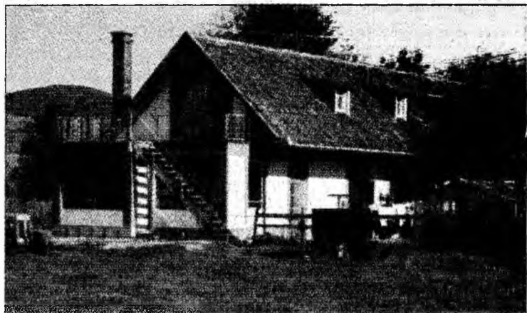
S-a investit în dormitorul asistaților social

Primarul Octavian Roman aduce și el acuzații administratorului ProVita. „Când s-a înființat această fundație eram consilier. Am sprijinit inițiativa, dar acum când am văzut că scopul inițial este mult denaturat am hotărât împreună cu Consiliul Local să-l evacuăm. Deși are spațiu să cazeze 10 copii, la ora actuală, aici sunt doar trei. Folosește acești copii la muncă și vinde produsele muncii lor. Numai pe lapte obține 10 milioane lu-