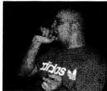
M&G în concert