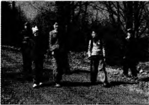
Elevii nu vor mai merge la școală kilometri întregi pe jos!

● Închidere de proiect. O sesiune de închidere a proiectului Clubul Copiilor Informați, cu tema „Un om informat este un om liber”, are loc azi, între orele 10.30 - 16.00, la Colegiul Tehnic Agricol „Al. Borza” Geoagiu. Sesiunea este organizată de Asociația „Sprijiniți Copiii” și ISJ Hunedoara. (S.B.)