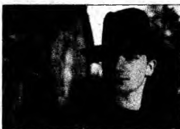
Pălăria buclucașă

■ Bono, solistul trupei irlandeze U2, a fost chemat la tribunal din cauza unei pălării.