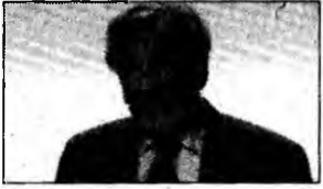
Elie Wiesel

Ierusalim (MF) - Scriitorul american laureat al Premiului Nobel pentru Pace, Elie Wiesel, este considerat unul dintre posibilele candidați la succesiunea președintelui israelian Moshe Katsav, acuzat de viol și hărțuire sexuală, relatează cotidianul Maariv. Wiesel, supraviețuitor al lagărelor naziste, nu a fost contactat oficial, deocamdată. Wiesel, născut în România, în 1928, ar putea dobândi foarte rapid și cetățenia israeliană, în cazul în care va fi desemnat președinte. Actualul președinte, Moshe Katsav, bătut de viol și hărțuire sexuală, ar putea fi nevoit să demisioneze, în condițiile în care poliția a recomandat demararea procedurii judiciare împotriva lui.