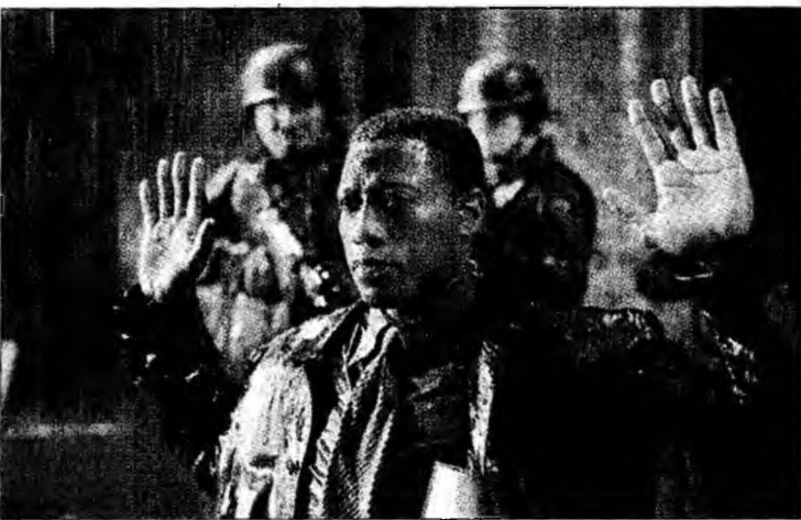
Snipes ar putea primi până la 16 ani de închisoare

■ Actorul american Wesley Snipes a refuzat să returneze circa 12 milioane de dolari.