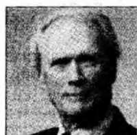
Eastwood

New Delhi (MF) - Actorii Brad Pitt și Angelina Jolie au probleme cu autoritățile indiene, după ce elicopterul cu care circulau a aterizat fără permisiunea acestora pe proprietatea privată a unui hotel. Celebruul cuplu se află în India pentru filmările la drama „A Mighty Heart”, un film biografic despre un reporter american de la Wall Street Journal, Daniel Pearl. Elicopterul cu cele două vedete a aterizat pe proprietatea privată a unui hotel din orașul Jodhpur, Rajasthan. Echipajul elicopterului a anunțat necesitatea unei aterizări de urgență, conform cotidianului Times of India. Managerul hotelului a indicat faptul că elicopterul, aparținând unei companii indiene, a încălcat legea proprietății private. Amendă pentru acest delict nu a fost făcută publică.