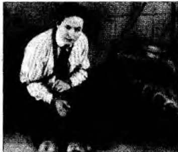
Harry Houdini