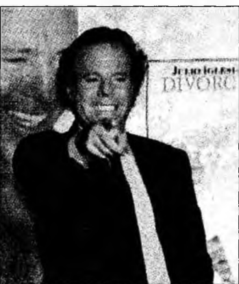
Julio Iglesias