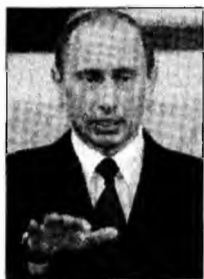
Vladimir Putin