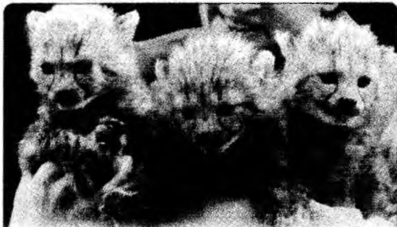
Trei pui de ghepard s-au născut în urmă cu o lună la grădina zoologică din Hanovra, Germania.

● Trece pe revizie. NASA a dat undă verde pentru misiunea de revizie a telescopului spațial Hubble, care ar trebui să asigure funcționarea acestuia până cel puțin în 2013.