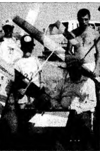
Brădenii au confirmat din nou