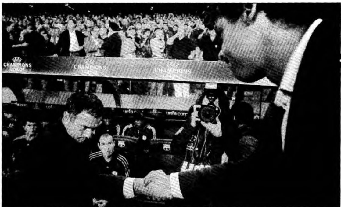
Jose Mourinho, antrenorul de la Chelsea, și Frank Rijkaard, de la Barcelona, și-au strâns mâinile

București - Echipele PSV Eindhoven, Bayern München, Liverpool și Valencia s-au calificat, marți seară, în optimele de finală ale Ligii Campionilor, în urma meciurilor disputate în etapa a IV-a a grupelor competiției. Bayern München a terminat la egalitate, scor 0-0, meciul cu Sporting Lisabona și ocupă primul loc în grupa B, cu 10 puncte. În celălalt meci al grupei, Internazionale Milano a învins, cu scorul de 1-0, formația Spartak Moscova. Internazionale ocupă locul doi în grupă, cu 6 puncte, fiind urmată de Sporting Lisabona, cu cinci puncte, și de Spartak Moscova, cu un punct. În grupa C, PSV Eindhoven și Liverpool au obținut calificarea în optimi. PSV Eindhoven a învins pe Galatasaray Istanbul, cu scorul de 2-0, prin