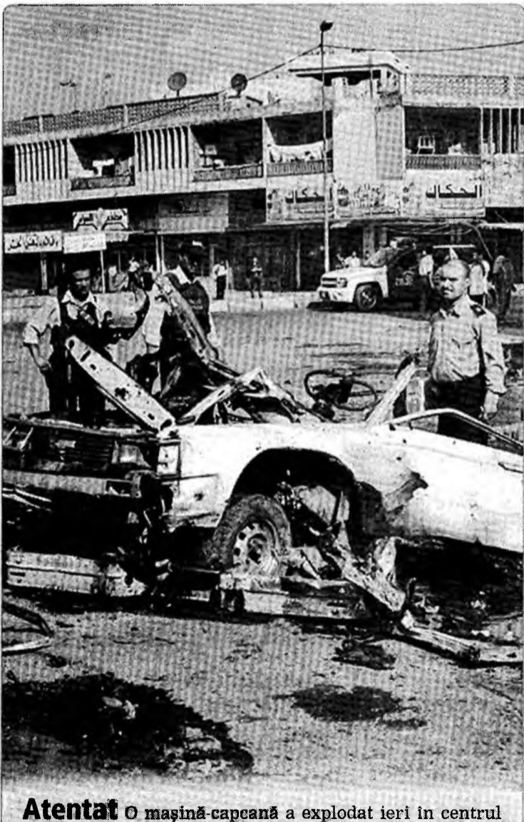
Atentat O mașină-capcană a explodat ieri în centrul Bagdadului, deflagrația ucigând șapte irakieni și rănind alți zece.

Considerând că României i se cuvenea un portofoliu mai important și că cel al multilingvismului constituie „o umilintă” pentru țara noastră, PSD solicită ca autoritățile guvernamentale să inițieze o consultare politică internă, pentru a determina Comisia Europeană să schimbe mandatul atribuit României.