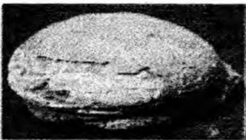
Ou fosilizat de dinozaur

Deva - Expoziția aparține studenților de la Universitatea de Arhitectură și