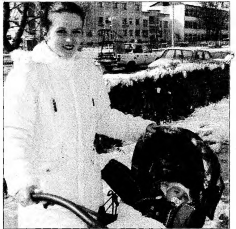
Iarna trebuie să fim gros îmbrăcați

- Saci de dormit - pentru a fi sigură că puilul tău nu doarme dezvelit sau că nu tre-