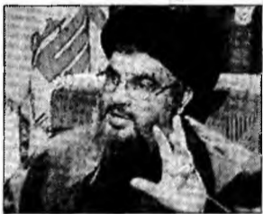
Hassan Nasrallah

Beirut (MF) - Liderul Hezbollah, Hassan Nasrallah, a afirmat marți că au fost demarate discuții indirecte între gruparea sa și Israel, prin intermediul unui mediator numit de ONU, privind un schimb de prizonieri. „Vreau să fi sigur pe toți cei interesați de acest caz că există negocieri serioase care continuă”, a declarat Nasrallah, într-un interviu acordat postului tv al Hezbollah. „Delegatul numit de secretarul general al ONU efectuează această misiune și se întâlnește cu o delegație a Hezbollah și cu partea israeliană interesată de acest dosar”, a adăugat el. Acesta a fost primul anunț potrivit căruia se desfășoară discuții indirecte pentru a asigura eliberarea prizonierilor. Israelul nu a comentat afirmațiile lui Nasrallah.