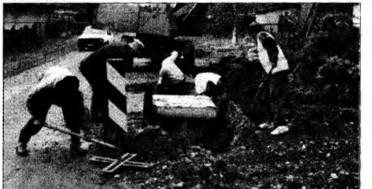
În Deva și Hunedoara vor începe în 2007, lucrările de reabilitare a rețelilor de apă.