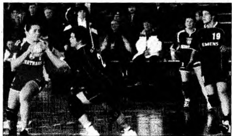
Cartaș n-a dezamăgit la națională

După două etape la Trofeul Carpați, România A ocupă locul 2 în clasamentul com-