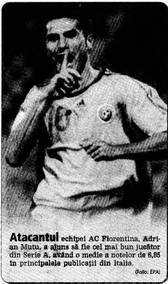
Atacantul echipei AC Fiorentina, Adrian Mutu, a ajuns să fie cel mai bun jucător din Serie A, având o medie a notelor de 6,85 în principalele publicații din Italia.