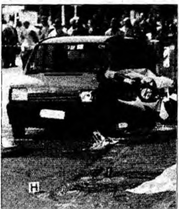
Marți, trei crime

Trei noi crime au fost comise marți, după ce patru omoruri violente fuseseră înregistrate începând de vineri seară.