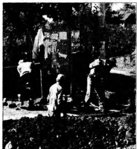
Conductele pentru distribuția apei au fost montate pe o lungime de 12 km

Ghelari (M.S.) - Locuitorii din comuna Ghelari vor avea apă curentă fără întreruperi din această lună, în urma finalizării lucrărilor de aducțiune din sursa de captare Bunila-Peștișele, a anunțat primarul localității, Ioan Bulbucan. Investiția se află pe ultima sută de metri pentru că a rețeaua de conducte a fost montată pe o lungime de 12 kilometri, a fost încheiat sistemul de distribuție locală, iar instalația de potabilizare a apei este în probe tehnologice. În acest moment se lucrează la alimentarea cu energie electrică a echipamentelor de producție, după care rețeaua va fi pusă în funcțiune. „Valoarea totală a investiției se ridică la 27 miliarde lei vechi, din fonduri de la bugetul de stat. Pentru rețeaua de distribuție locală au mai fost alocate fonduri din programul de închidere a minelor”, a afirmat primarul comunei, care a menționat că de furnizarea apei reci vor beneficia peste o mie de familii. Locuitorii din Ghelari se confruntă cu probleme în alimentarea cu apă rece de 16 ani, după ce pânza freatică a fost afectată de galeriile de mină care se găsesc în subsolul așezării.