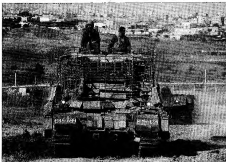
Trupe israeliene în nordul Fâșiei Gaza

Postul tv qatarot al-Jazeera a anunțat că un militar israelian a fost ucis în cursul operațiunii în nordul Fâșiei