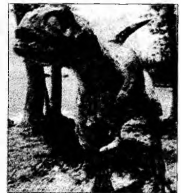
La Hațeg s-au descoperit fosile de dinozauri pitici

ai Consiliului Județean Hunedoara, ai Primăriei Hațeg, ai universităților din București și Petroșani și ai SC Hidroconstrucția Râul Mare. Conceptul de geoparc, ca abordare nouă în conservarea patrimoniului natural al unei regiuni, a fost lansat de UNESCO, în 1999, devenind în doar câțiva ani o direcție de dezvoltare durabilă a regiunilor, aplicată în prezent în 14 țări europene care au creat geoparcuri, reunite în cadrul Rețelei Europene a Geoparcurilor. Geoparcul Dinozaurilor din Țara Hațegului se întinde între Barcu Mare și Sarmizegetusa. El a devenit prin H.G. 2151/noiem-