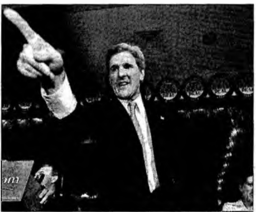
Fostul candidat la președinția SUA, John Kerry

Partidul Republican a difuzat imediat declarația lui Kerry.