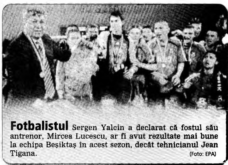
Fotbalistul Sergen Yalcin a declarat că fostul său antrenor, Mircea Lucescu, ar fi avut rezultate mai bune la echipa Beşiktaş în acest sezon, decât tehnicianul Jean Tigana.

muth Duckadam, Gheorghe Hagi, fost jucător la Real Madrid, Gheorghe Craioveanu și Cosmin Contra, fundașul echipei Getafe. În momentul în care Duckadam a fost prezentat ca fiind portarul care a apărut patru penaltiuri în finala Cupei Campionilor Europeni pe care Steaua a câștigat-o, în 1986, în fața formației FC Barcelona, acesta a fost aplaudat de oficialii madrileni, în ciuda rivalității dintre cele două cluburi.