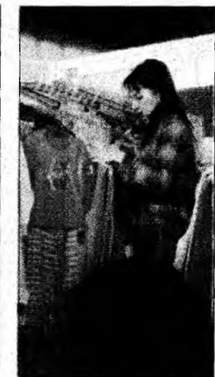
Se așază exponatele