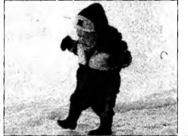
Ținute de iarnă pentru bebeluși, cu hanorace, căciulițe, pantalonăși groși și comozi și cizmulițe. Nu uitați mănușile!