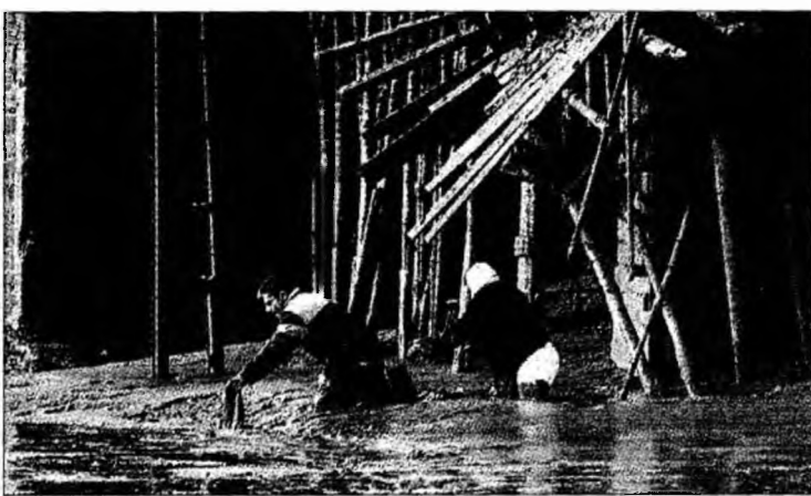
Inundații în cartierul Bismil din Diyarbakir

■ Inundațiile grave din sud-estul Turciei au provocat decesul a 21 de persoane.