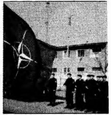
UE impune noi reguli

Jandarmii angajați pe bază de contract beneficiază de indemnizație de șomaj, care se acordă la cerere, de la data desfacerii sau expirării contractului de muncă. „Această indemnizație se acordă pe perioade stabilite în funcție de stagiul de cotizare și acestea pot fi pentru șase luni, nouă luni, respectiv 12 luni, pentru cei cu stagiul de cotizare mai mare de zece ani. De asemenea au fost luate măsurile de protecție socială,