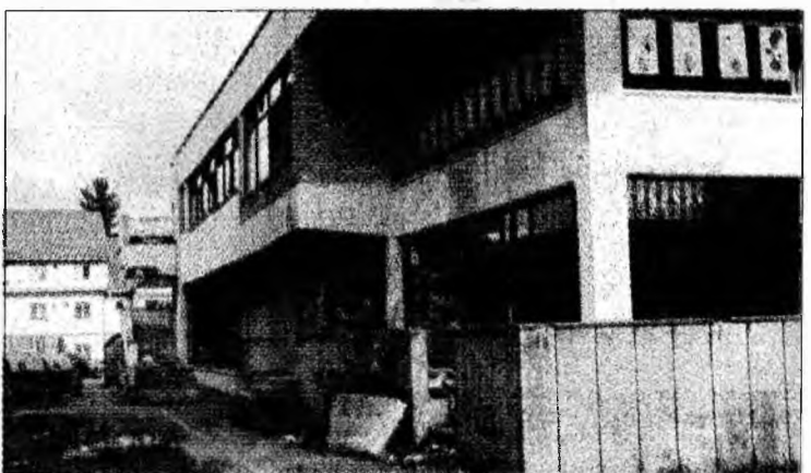
Atât a mai rămas din restaurantul „Astoria”