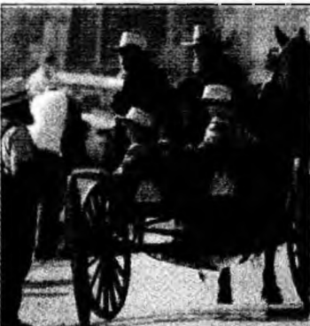
Comunitatea amish, îngrijorată