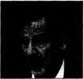
Saddam Hussein

Washington (MF) - Senatorul democrat american John Kerry a prezentat scuze, miercuri, pentru o declarație pe care a făcut-o în fața unui grup de studenți și care a atras reacția vehementă a Casei Albe. În cadrul unei reuniuni desfășurate la Los Angeles, senatorul democrat le-a spus studenților că „trebuie să profite la maxim de studii, să învețe bine, să își facă temele, să depună eforturi pentru a fi inteligenți și pentru a se descurca”. „În caz contrar, nu veți face față situației din Irak”, le-a spus Kerry studenților. Politicianul democrat a explicat că remarcile sale erau îndreptate împotriva președintelui George W. Bush, și nu a armatei.