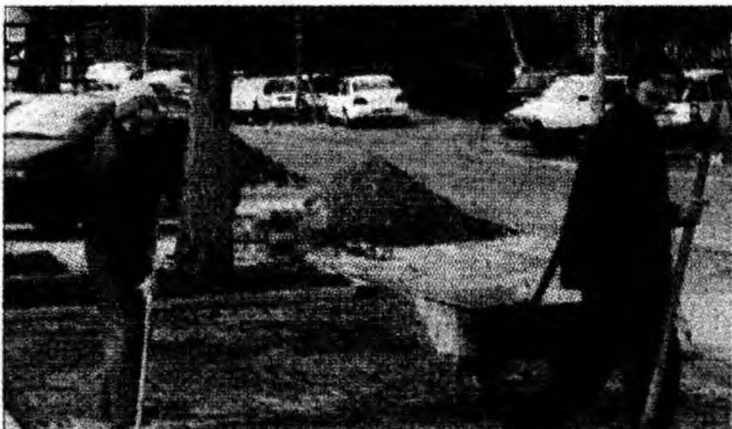
Se construiesc locuri de parcare