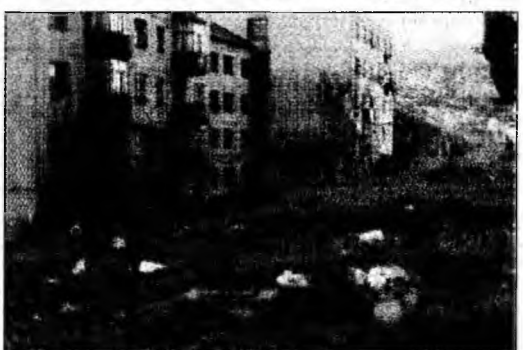
Gunoaiele sunt la fiecare pas