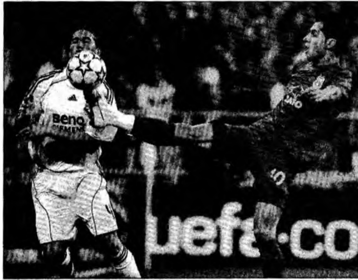
Dică nu a reușit să îl surprindă pe apărătorii adversi și să fie periculos la poarta Real-ului

Madrid (MF) - Antrenorul Cosmin Olăroiu a declarat, miercuri, că este păcat că Steaua a pierdut într-o astfel de manieră meciul cu Real Madrid, din grupa E a Ligii Campionilor, dar s-a arătat mulțumit de faptul că echipa sa a oferit o altă imagine decât cea din meciul de la București. „Cred că am oferit o altă imagine față de meciul de la București. Am fost mult mai ofensivi, am stăpânit jocul în prima repriză, în care am avut multe ocazii, dar am pierdut din cauza unei greșeli. Jucătorii mei au făcut un meci bun și merită numai felicitări. Nu are importanță cine este vinovat la faza golului. Acum, trebuie să ne concentrăm asupra calificării în Cupa UEFA”, a spus Olăroiu. Tehnicianul Stelei a menționat că Bănel