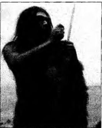
Fosilele din Peștera Muierii sunt de acum 30.150 de ani