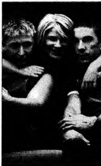
DJ Project

DJ Project au fost nominalizați și anul trecut la categoria Romanian Best Act din cadrul MTV Music Awards, Voltaj fiind însă trupa aleasă câștigătoare. Pentru titlul de Best Romanian Act, anul acesta au mai concurat Morandi, Paraziții, Blondy și Simplu. Ceremonia de decernare a MTV European Music Awards a avut loc ieri