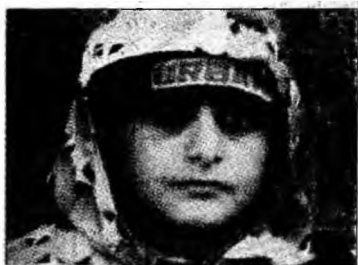
De trei ori mai mulți infractori

în cadrul unei întâlniri organizate cu Subgrupul Consultativ în domeniul Poliției și Justiției. Pentru a veni în sprijinul lor, instituțiile abilitate vor încerca elaborarea unor proiecte de lege prin care să se elimine cauzele care duc la fenomenul infracțional în rândul minorilor. „Cauzele primare care generează fenomenul nu se rezolvă în țara noastră, aici se lucrează doar la efecte. Copilul este doar monitorizat și instituționalizat. Mulți dintre copii sunt stimulați în familie să facă fapte antiso-