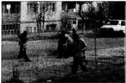
Se face curat pe străzile cartierului