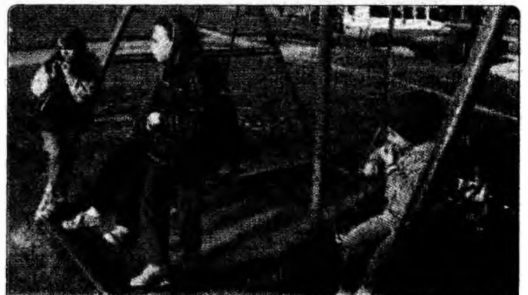
În cartierul devean Micro 15 oamenii se acuză între ei pentru curățenia care lasă mult de dorit. /p.6

activități diverse, recitaluri ale unor trupe locale și al Cristinei Rus. Ambele manifestări vor începe la ora 19.00. La Deva, evenimentul va avea loc în piața de la Cetate și va fi precedat de prezentarea piesei de teatru „Revelion la Terzo Mondo”, la sala Studio a teatrului devean (ora 18.00), cu intrare liberă. La Petroșani acțiunea va avea loc în fața Casei de Cultură și include și o demonstrație de cățărare în nocturnă a echipei Salvamont din localitate.