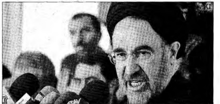
Fostul președinte iranian, Mohammad Khatami

„Situația s-a îmbunătățit. Nivelul violențelor s-a redus considerabil în ultimele săptămâni, deși există și eșecuri tactice. În ultimele zile, am ucis, rănit sau capturat 150 de insurgenți, cei mai mulți în provinciile Oruzgan și Zabul”, a încheiat el.