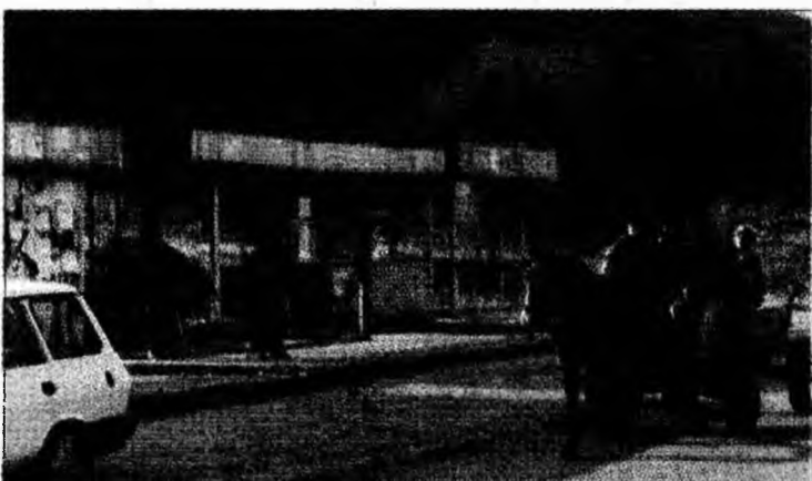
Așa arată o stație de autobuz în Micro 15