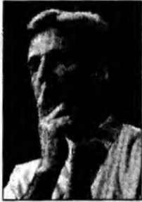
John Kerry