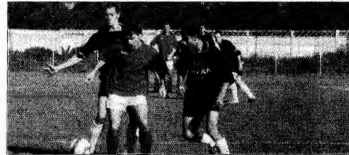
Fotbaliștii de la Dacia Orăștie trebuie să marcheze