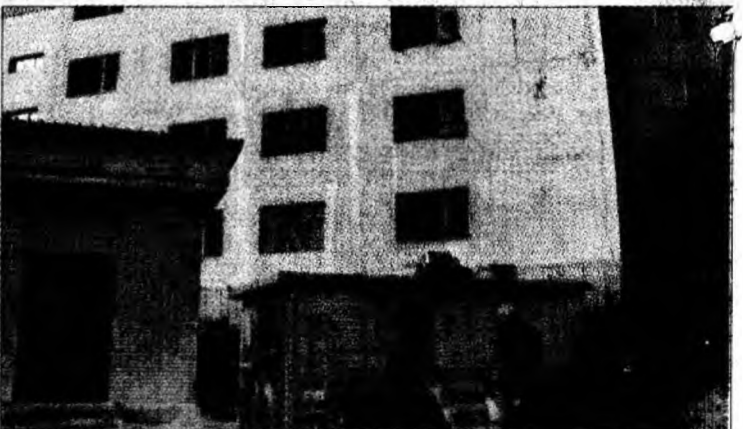
Imagine din spatele unui bloc abandonat