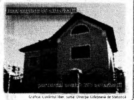
Grafică: Cuvântul Liber, sursa: Direcția Județeană de Statistică

În luna august 2006 s-au eliberat 46 autorizații de construire pentru clădiri rezidențiale în județ, iar de la începutul anului 263.