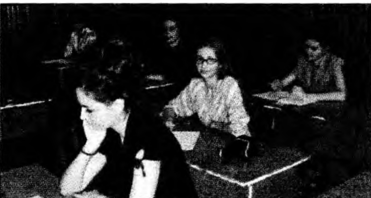
Cei cu opt clase vor beneficia de programe speciale

promoveze participarea angajaților, indiferent de nivelul de pregătire, la programe de formare profesională. Programele cursurilor vor fi adaptate mai bine cerințelor locului de muncă. De asemenea, vor fi furnizate cursuri de consiliere în carieră. Se va pune mai mare accent pe promovarea și susținerea tinerilor la angajare, prin acordarea de facilități firmelor. Toate acestea sunt prevăzute în Programul de Dezvoltare a Resurselor Umane în perioada 2007-2013, elaborat conform aquis-ului comunitar.