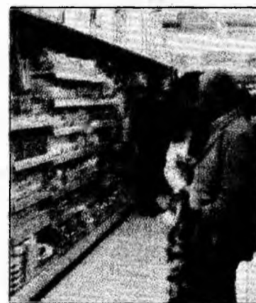
Descumpănire în fața rafturilor

treilea șoc va apărea în luna decembrie la produsele din carne – mezeluri și specialități, unde se așteaptă o creștere de până la trei procente pentru cumpărătorul direct. De scumpiri nu vor scăpa nici produsele lactate, în special brânzeturile și untul - unde majorarea ajunge până la 2%. Tot pentru luna decembrie se așteaptă majorări la combustibil și îmbrăcăminte.