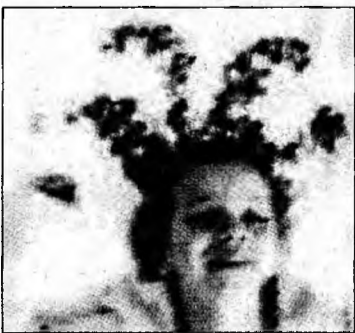
Așteptăm poveștile voastre!

Deva (S.B.) - „CL și Moș Nicolae îți ascultă povestea”, concursul lansat de Cuvântul liber, a ajuns aproape pe ultima sută de metri. Venim cu precizarea că pentru a vota una dintre poveștile participante la concurs trebuie să intrăți pe www.huon.ro . Apoi faceți clic pe imaginea de promovare a concursului unde va apărea și propoziția: „Votează cea mai frumoasă poveste aici! „Așteptăm voturile până în data de 5 decembrie, ora 24.00. Clasa care va fi premiată va fi anunțată telefonic în dimineața zilei de 6 decembrie. Atunci va primi și invitația la redacția publicației noastre, pentru premiere.