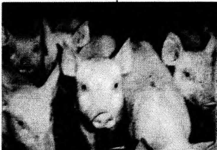
În județ, săptămâna viitoare începe vaccinarea anti-pestă porcină

Vor plăti amendă de la 1.000 la 2.000 de lei noi cei care comercializează porcine