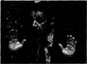
Nicolas Sarkozy