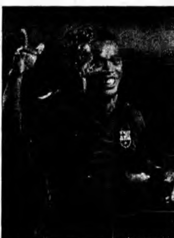
Ronaldinho în acțiune