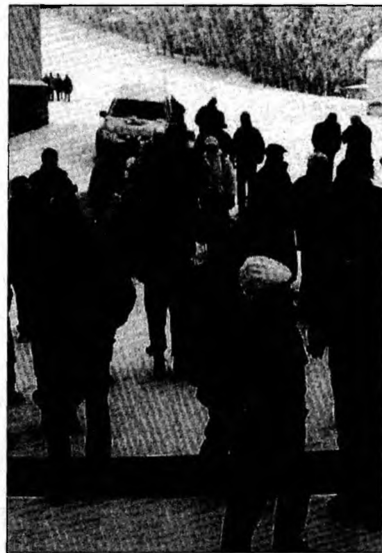
Întâlnirea anuală a salvamontiştilor