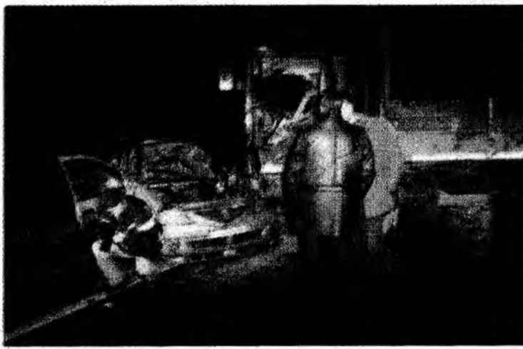
Autoturismul a fost distrus în proporție de 80%