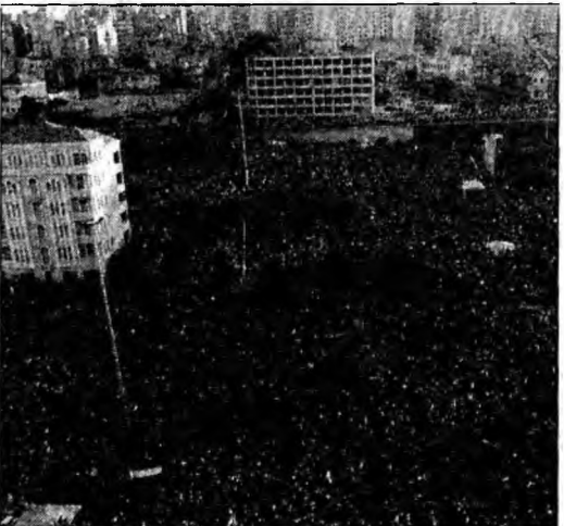
Zeci de mii de protestatari în centrul Beirutului

Politicienii antisirieni care controlează Guvernul consideră că gruparea musulmană și aliații săi intenționează să organizeze o lovitură de stat. Siniora a afirmat joi că Guvernul său nu va demisiona.