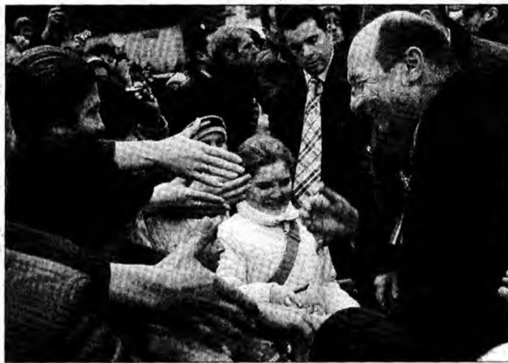
Președintele Traian Băsescu a făcut o baie de mulțime

A urmat blocul de paradă al Forțelor Terestre.