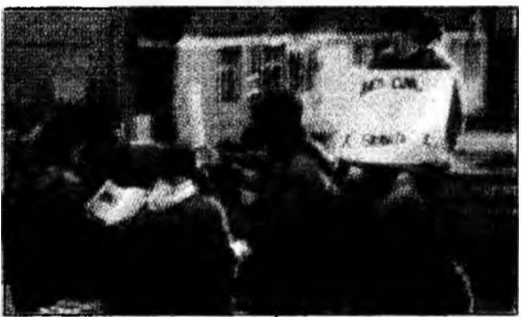
Marș dedicat victimelor HIV