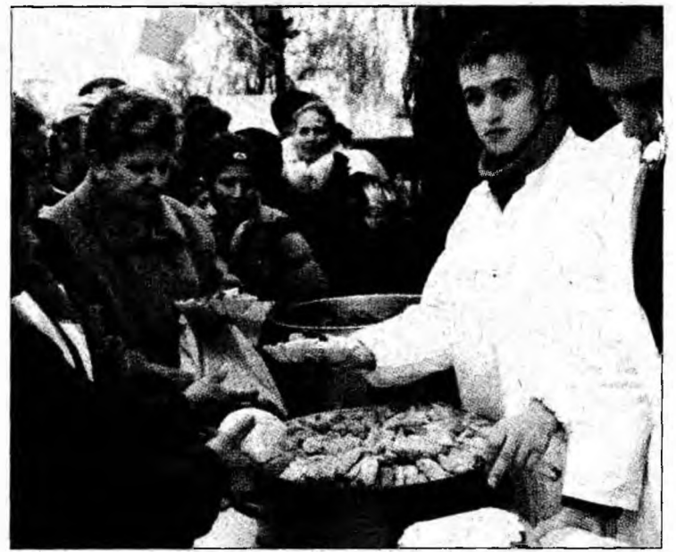
Sarmalele au fost la mare căutare