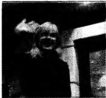
Kidman la Geneva

■ Nicole Kidman și-a manifestat sprijinul față de femeile victime ale violențelor domestice.