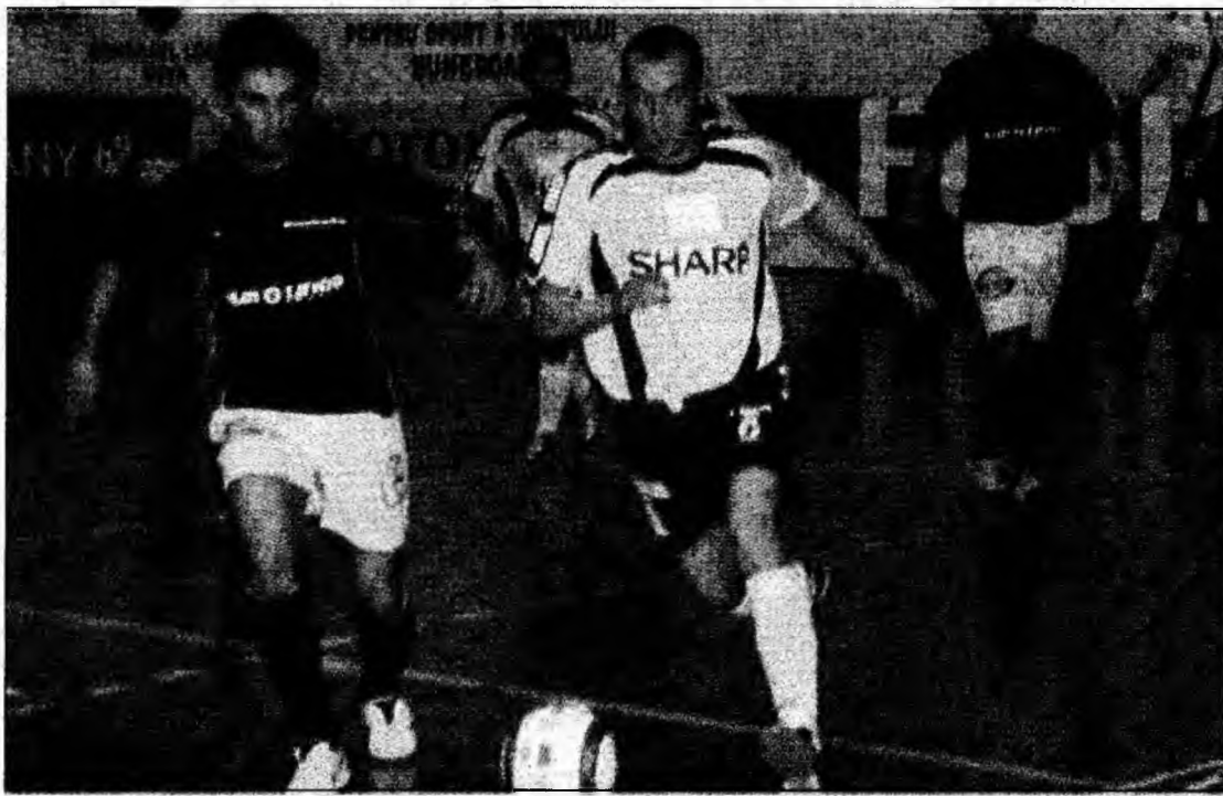
Molomfălean a fost și acum un om de bază

În condițiile în care s-au văzut clar intențiile antrenorului Gașpary Karoly de a menaja jucătorii de bază ai echipei, oaspeții, una dintre cele mai motivate echipe care a evoluat la Deva, au reușit să conducă aproape pe tot parcursul meciului. În minutul 13 era 3-0 pentru Poli, Timișoara iar trei minute mai târziu era 4-1.