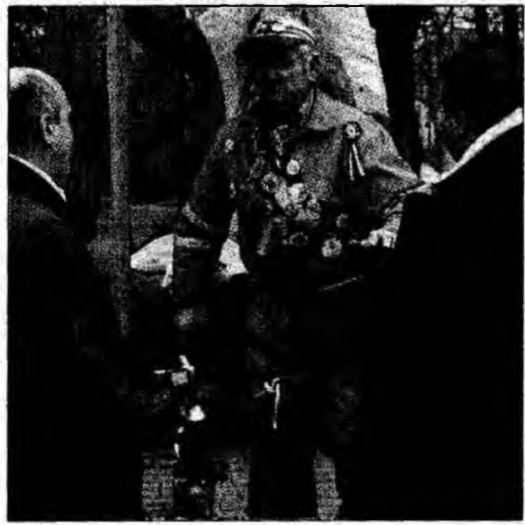
Bătrânul vine în fiecare an la Alba Iulia Cu bicicleta la Alba

● Anti-SIDA. Cinci mii de prezervative au fost distribuite gratuit tinerilor care au luat parte la spectacolele desfășurate în zona centrală a municipiului Alba Iulia, în cadrul unei acțiuni desfășurate de filiala de Cruce Roșie pentru conștientizarea populației asupra pericolului pe care îl reprezintă virusul HIV. (M.S.)