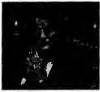
Romano Prodi

Paris (MF) - Nicolas Sarkozy, potențial candidat al dreptei franceze la alegerile prezidențiale, a cerut suspendarea completă a negocierilor de aderare dintre Ankara și UE, afirmând că Turcia nu are loc în Uniunea Europeană. În cursul unei dezbateri televizate difuzate joi, ministrul francez de Interne a declarat că poziția Turciei față de Cipru este inacceptabilă și a reluat propunerea privind instituirea unei relații privilegiate cu Turcia în locul negocierilor pentru integrarea acesteia în UE. Guvernul cipriot grec, recunoscut pe plan internațional, nu este recunoscut de Turcia, care refuză să permită accesul navelor cipriote în porturile sale și menține circa 35.000 de militari în nordul Ciprului.