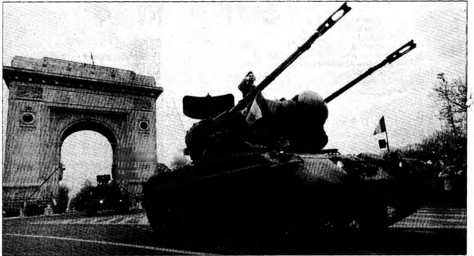
Arsenalul scos pe străzile Bucureștilor cu ocazia paradei militare a fost mai bogat decât în anii precedenți