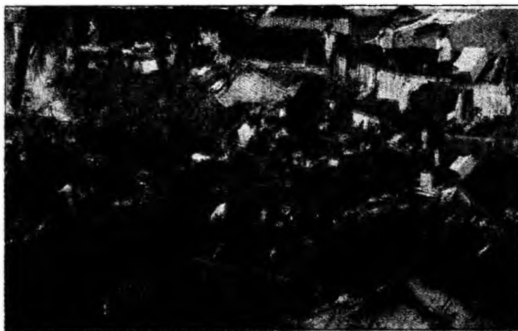
Alunecarea de teren a pus casele la pământ

„Nu deținem cifre exacte, dar apreciem că există aproximativ de 400 de morți (...) în special în jurul vulcanului Mayon” care se află la 350 de kilometri de capitala țării, Manila, a declarat Glenn