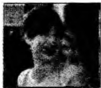
Sandra Bullock

Londra (MF) - Marea Britanie vrea să se alăture Agenției spațiale americane, NASA, în vederea pregătirii viitoarelor misiuni pe Lună, programate până în 2020, a declarat ministrul britanic al Științei Malcolm Wicks. Ministrul britanic și administratorul NASA Michael Griffin au avut o întrevedere în cursul căreia au discutat despre viitoarele misiuni pe Lună. Acesta ar putea fi cel mai mare program științific din lume, iar oamezii de afaceri și cercetătorii britanici trebuie să beneficieze de el, a spus Wicks. Marea Britanie a fost lider de piață în domeniul „sateliților mici și ieftini”. Cele două sonde gemene din cadrul misiunii Stereo, lansate de NASA în octombrie, au fost echipate cu instrumente concepute britanici.