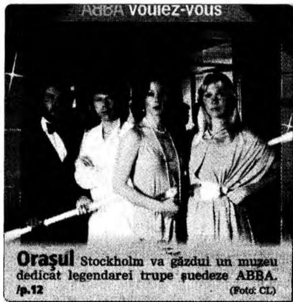
Orășul Stockholm va găzdui un muzeu dedicat legendarei trupe suedeze ABBA. /p.12