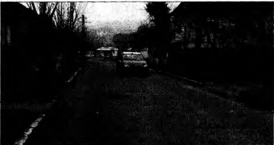
Mașinile sunt nevoite să ocolească gurile de canal cu capace instalate deficitar

aspect, este că toate străzile din zonă sunt incluse în planul de lucrări asfaltice al primăriei”, a menționat Mircea Diaconu.