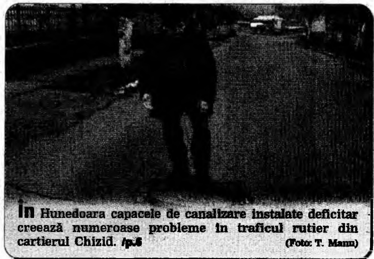
În Hunedoara capacele de canalizare instalate deficitar creează numeroase probleme în traficul rutier din cartierul Chizid. /p.6

niul Gazelor Naturale estimează că acest calendar va determina o creștere a prețurilor finale la consumatori cuprinsă între 8% și 12% pentru 2007, majorarea fiind influențată de evoluția prețului gazelor naturale din import. Calendarul de creștere a prețurilor propus de ARDGN are în vedere estimările actuale privind nivelul cererii interne și al producției de gaze naturale, evoluția ratei de schimb, a prețurilor la importul de gaze naturale și a tarifelor reglementate.