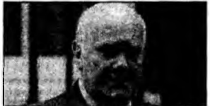
John Reid

Londra (MF) - Ministerul britanic de Interne, John Reid, a declarat că ancheta privind decesul fostului spion rus Aleksandr Litvinenko, iradiat cu poloniu 210, ar fi de natură paneuropeană, dând asigurări că anchetatorii urmăresc toate pistele posibile. „Vom merge acolo unde firul evenimentelor va conduce ancheta. În următoarele zile, cred că acest lucru se va extinde dincolo de teritoriul Marii Britanii”, a declarat el. Azi, la Bruxelles, la reuniunea miniștrilor de Interne europeni, Reid va avea un schimb de informații cu aceștia. „Autoritățile sanitare au început să intre în legătură cu colegii lor europeni și poliția le va conduce pașii în direcția descoperirilor anchetei - în interiorul sau în afara Marii Britanii”, a asigurat el.