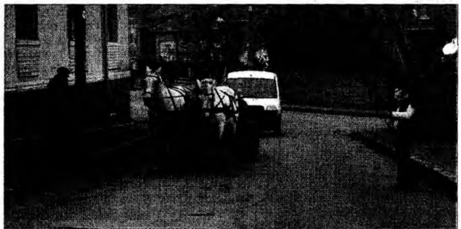
Mijloacele de transport sunt extrem de variate