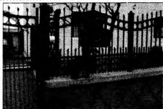
Unii locatari țin curățenie în fața casei

● Lucrări la gaz. În cartierul Chizid au loc lucrări de deviere a țevilor prin care circulă gazul metan. Din acest motiv în fața porților locatarilor sunt săpate gropi adânci, periculoase pentru cei neatenți. (C.B.)