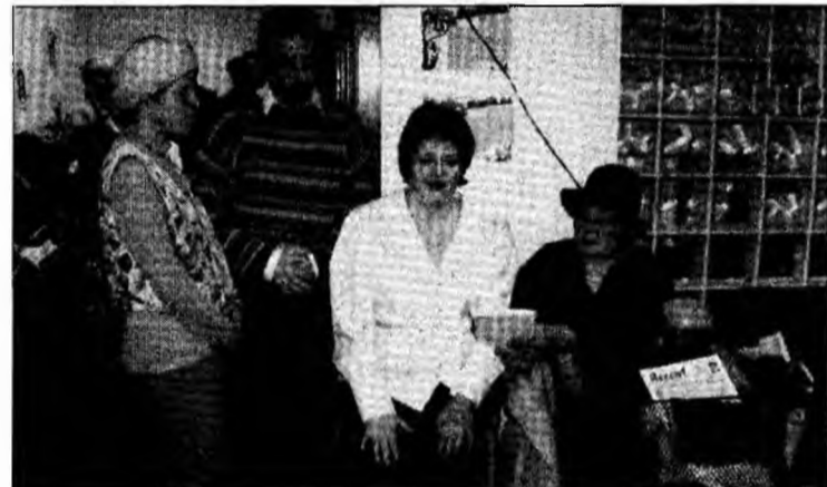
Anual, pe 3 decembrie este Ziua Internațională de Solidaritate cu Persoanele cu Handicap