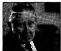
Augusto Pinochet