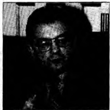
Emil Boc

El a arătat că formațiunea social-democrată va purta, totuși, discuții, în condițiile în care există partide politice care vor fi capabile să participe la susținerea platformei guvernamentale pe care PSD o va elabora la Congresul din 10 decembrie.