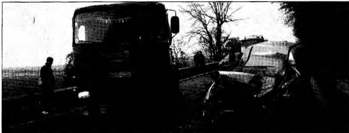
Două mașini s-au ciocnit violent la intrarea în localitatea Săcămaș

■ Două persoane au fost grav rănite în urma unui accident la intrarea în Săcămaș.