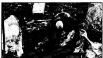
Lucrările vor fi gata în curând