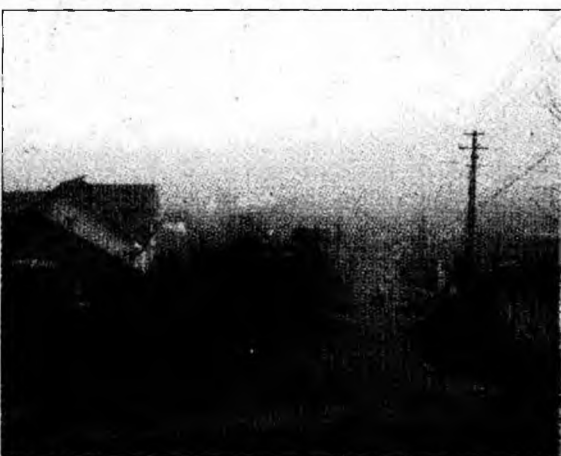
Cetățenii urcă pe strada N. Bălcescu ca la munte