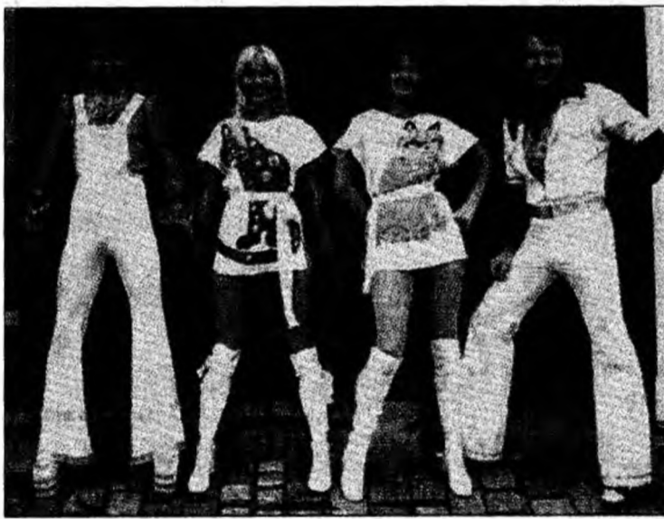
Legendara trupă suedeză

Stockholm (MF) - Acest muzeu interactiv va prezenta fanilor mai vechi și mai noi costumele originale purtate de cei patru membri ai formației, instrumentele, paginile cu versuri, o colecție de premii și multe alte obiecte, multe dintre ele surprinzătoare, pentru a oferi o istorie cât mai completă a grupului. Mai mult, vizitatorii vor avea la dispoziție un studio în toată regula, unde să poată înregistra propriile versiuni ale cântecelor ABBA, precum și o sală interactivă care oferă șansa de a retrăi sen-