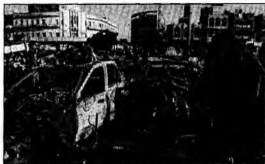
Peste 50 de morți și 90 de răniți într-un triplu atentat la Bagdad

● Continuă protestele. Miile de manifestanți care au participat la mitingul de la Beirut și care au petrecut noaptea la adăpostul corturilor albe amplasate în centrul capitalei, sunt hotărâți să nu părăsească zona până când Guvernul nu va demisiona.