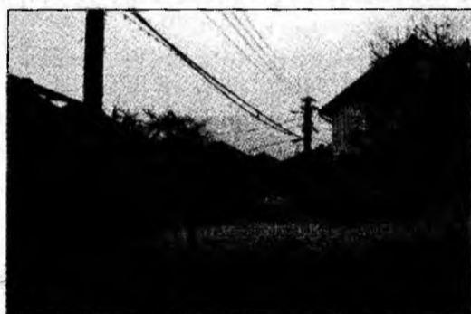
Strada Stejarului, fără covor asfaltic