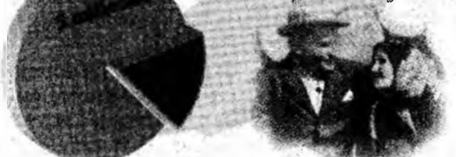
Grafica: Cuvântul liber, sursa: TVR

Din cei 5 milioane de pensionari care vor beneficia de majorarea pensiilor complet, 980.000 sunt pensionarii agricultori.