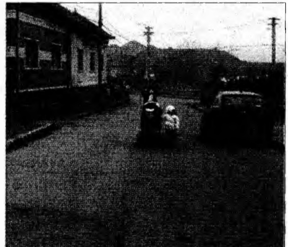
Scurtă plimbare prin cartier