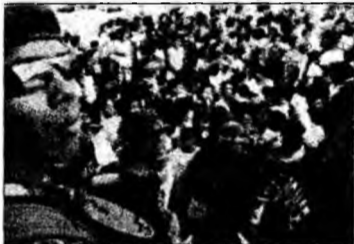
În așteptarea alimentelor

Manilla (MF) - Alunecările de teren produse, joi, de tai-funul Dorian în Filipine s-au soldat cu 1.266 de morți sau dispăruți, potrivit unui nou bilanț anunțat, ieri, de protecția civilă. Până în prezent, autoritățile au confirmat moartea a 526 de persoane și dispariția a altor 740.