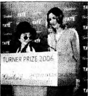
Yoko Ono și Tomma Abts

Abts a primit premiul de la Yoko Ono, văduva lui John Lennon, în cadrul unei ceremonii care a avut loc la galeriile Tate Britain din Londra. Premiul Turner poate fi atribuit oricărui artist cu vârsta sub 50 de ani, care locuiește în Marea Britanie.