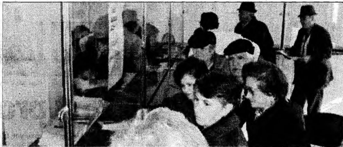
Penalizările la plată vor descuraja românii să intre în pensie anticipată

Noul act normativ va fi gata la începutul anului 2007. Criteriile de acordare a pensiei anticipate și de invaliditate vor fi modificate în mare