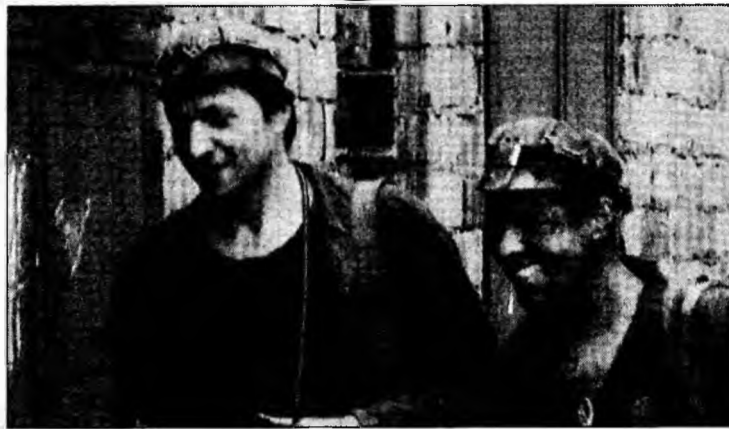
Americanii sunt interesați de forța de muncă din Valea Jiului

■ O firmă din Cluj oferă locuri de muncă pentru minierii din Valea Jiului.