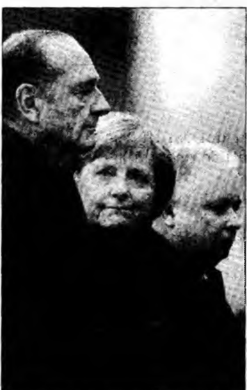
Jacques Chirac, Angela Merkel și Lech Kaczyński