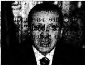
Recep Erdogan

Bruxelles (MF) - Subsecretarul de Stat american pentru afaceri politice, Nicholas Burns, a declarat că Statele Unite sunt de acord cu oferta României de a găzdui viitorul summit NATO la București și speră că Alianța va avea „înțelepciunea” de a accepta propunerea. El a salutat implicarea militară a României în Irak și în Afganistan și a apreciat că relația dintre Washington și București este „mai mult decât bună, este excelentă”. Burns s-a referit și la programul de vize pentru țările central și est-europene.