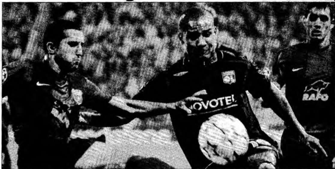
În partida tur, Lyon s-a impus la București cu scorul de 3-0

Le Dauphine se întreabă cu ce stare de spirit va aborda Steaua meciul cu Lyon. „Ro-