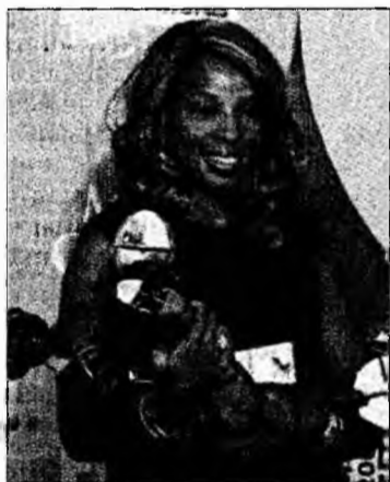
Mary J Blige

Starul, în vârstă de 35 de ani, a dominat în ultima perioadă topurile muzicale americane cu cel mai recent album „The Breakthrough”. Blige nu a reușit să câștige și premiul la categoria „cea mai bună cântăreață a anului”, atribuit cântăreței Rihanna,