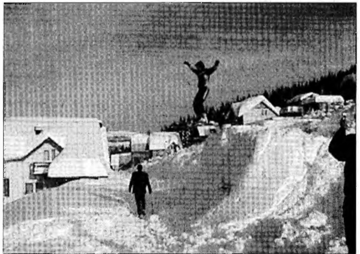
Masivul Parâng va fi „full” de sărbători

țurile sunt mai accesibile, iar condițiile de schi și cazare nu sunt nici ele mai prețioase ca în stațiunile renumite. Cel puțin pentru Hotelul Rusu, cele mai multe locuri au fost deja solicitate prin Internet. Reprezentanții firmelor de turism spun că au pregătit pentru turiști camere cu conexiuni la internet, săli de conexiuni la internet, săli de masă, săli de conferințe. „În Parâng toate locurile au fost vândute de revelion încă de la sfârșitul lunii noiembrie, în condițiile în care în 2005, în aceeași perioadă solicitările de locuri pentru Revelion se puteau număra pe degete. Aceeași situație se înregistrează și în stațiunea Straja. Probabil pentru că accesul în Parâng e mai ușor, acolo s-au o-