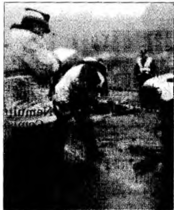
Se fac măsurători