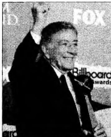
Tony Bennett

originară din insulele Barbados. Veteranul Tony Bennett a fost recompensat cu un premiu pentru întreaga carieră. Cea mai recentă colecție de