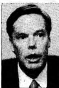
Nicholas Burns

Ankara (MF) - Vizita premierului turec Recep Tayyip Erdogan în România, planificată să înceapă azi, a fost amânată din cauza stării de înșelăciune politică de la București. Erdogan urma să discute cu oficialitățile de la București despre recentele dificultăți intervenite în demersurile țării sale de aderare la Uniunea Europeană. Biroul de Presă al Guvernului a precizat că pe căi diplomatice s-a convenit de comun acord ca vizita în România a primului-ministru Turciei, Recep Tayyip Erdogan, să fie reprogramată pentru începutul anului viitor. Partidul Conservator s-a retras de la guvernare, Executivul nemaifiind sprijinit în aceste condiții, de o majoritate parlamentară.