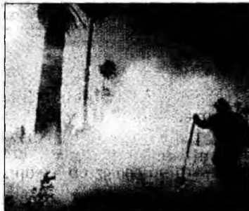
Moorepark, California

Los Angeles (MF) - Guvernatorul statului California, Arnold Schwarzenegger, a anunțat, luni, că a decretat starea de urgență în comitatul Ventura, situat la nord-vest de Los Angeles, din cauza izbucnirii, duminică, a unor violente incendii, care au distrus până în prezent cinci locuințe. Nici o persoană nu a fost însă rănită. Incendiul a crescut în intensitate din cauza rafalelor de vânt de până la 100 de kilometri pe oră și a distrus, luni, circa 4.000 de hectare, potrivit pompierilor, mobilizați în număr de 1.500 la fața locului. În ordinul său, guvernatorul a menționat „împrejurări