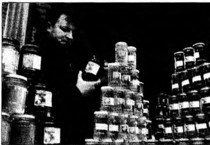
Câteva mii de școlari vor primi miere gratuit