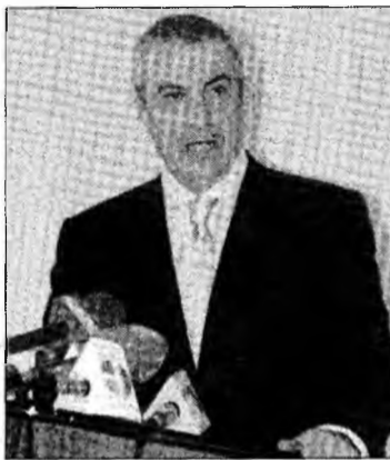
Călin Popescu Tăriceanu

Concurență mai mare este și pentru posturile de vicepreședinți pe regiuni de dezvoltare.