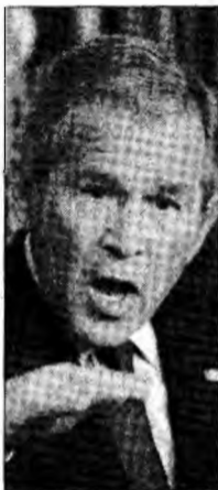
George W. Bush