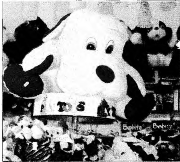
Jucăriile dragălașe au rămas la modă

„Poni este jucăria mea preferată. Este un ponei. De fapt este fetiță și de asta o cheamă Poni. Îmi plac și „Fetețele Wich”, le am pe toate. Una mi-a cumpărat-o de ziua mea, una mi-a adus-o