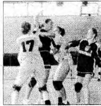
Handbalistele de la Cetate vor victoria la Galați