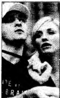
Justin și Cameron

Los Angeles (MF) - Deși a murit de Crăciun, James Brown, „Nașul muzicii soul”, nu a fost încă înmormântat pentru că avocații și moștenitorii starului plănuiesc să transforme mormântul acestuia într-un loc de pelerinaj. La 11 zile de la ultimul dintre serviciile comemorative, corpul neînsuflețit al lui James Brown a fost transferat din orașul natal al starului, Augusta, Georgia, la reședința sa din Beech Island, Carolina de Nord, unde va fi înmormântat.