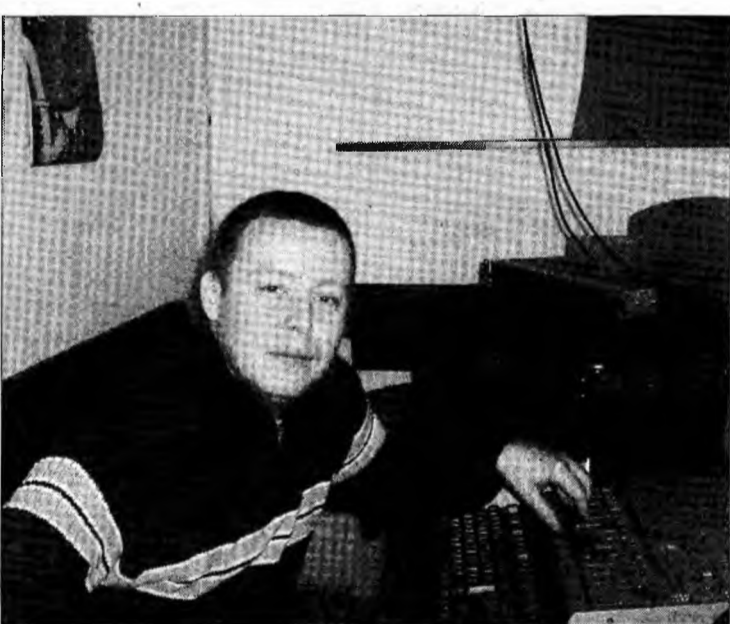
De la DJ... la administrație și poate... la turism.

Deși îi place să lucreze în mass-media, și-a pregătit o alternativă: a absolvit o facultate specializată în turism. Așa că „dacă aş primi o ofertă bună în acest domeniu, m-aș