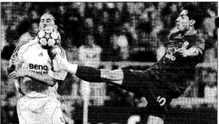
Deși este curtat de mai multe echipe, Dică (dreapta) nu are o propunere concretă

„Nu este un secret că Lens este foarte interesată de Dică. Jucătorul român este pregătit pentru un transfer și, de ce