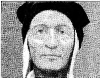
Chipul, reconstruit

■ Adevăratul chip al lui Dante Alighieri a fost redesenat de cercetătorii italieni.