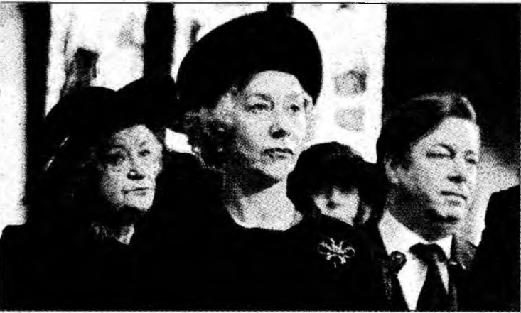
Helen Mirren în drama „The Queen”

Drama „The Queen” a fost nominalizată la categoria „cel mai bun film”, alături de „Babel”, în regia lui Alejandro Gonzalez Inarritu, „Cărțița”, în regia lui Martin Scorsese, „Ultimul rege al Scoției”, în regia lui Kevin Macdonald, și „Fiecare se crede normal”, în