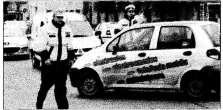
Șoferii care nu au extingtor în dotare primesc 5 puncte penalizare