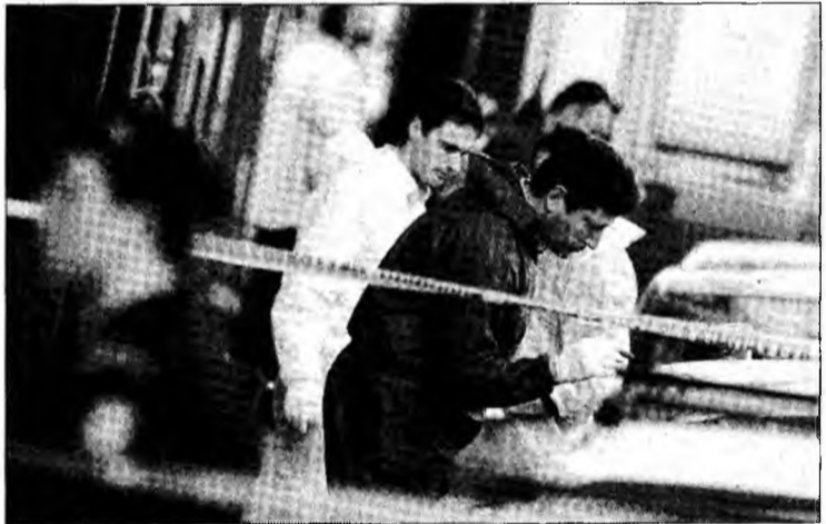
Ofițerii brigăzii antiterorism fac cercetări la fața locului

„Lupta revoluționară” a revendicat până în prezent șase atentate împotriva unui comisar din Atena, după 100 de zile de la încheierea Jocurilor Olimpice de la Atena.