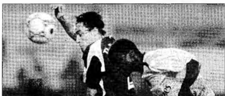
Anul trecut a fost unul foarte bun pentru rapidiști

București (MF) - Echipa Rapid București a încheiat anul 2006 pe locul 10, cu 232 de puncte, conform clasamentului Federației Internaționale de Istorie și Statistică a Fotbalului (IFFHS), dat publicității vineri. Rapid a coborât patru locuri față de luna noiembrie. Site-ul IFFHS notează că Rapid București este prima echipă din al doilea nivel de performanță care intră în primele zece la finalul unui an. Steaua București ocupă locul 27, cu 189 de puncte, coborând un loc față de luna noiembrie. Adversara Stelei din 16-imile Cupei UEFA,