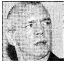
Graciano Rocchigiani Plictiseală

București (MF) - Fostul fotbalist al echipei FC Porto, Cesar Peixoto, în prezent legitimat la Espanol Barcelona, a declarat că Mourinho își caută o casă la Milano, informează cotidianul The Sun. Potrivit The Sun, Mourinho i-a spus unui prieten că va pleca de la Chelsea, dar încă nu știe unde. „Mourinho nu va avea probleme în ceea ce privește găsirea unei echipe, Internazionale Milano fiind favorită, iar Real Madrid pe locul doi, la distanță foarte mică”, menționează jurnalul englez. Oficialii de la Chelsea se gândesc la găsirea unui înlocuitor. „Seleționerul Rusiei, Guus Hiddink, este considerat favorit, dar el s-ar putea gândi că provocarea este prea mare pentru vârsta de 60 de ani. Mai sunt agreați Didier Deschamps și Juande Ramos”, menționează The Sun.