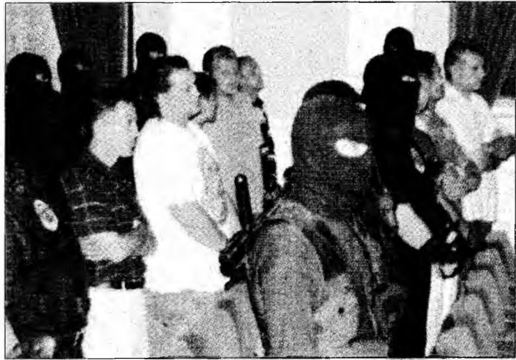
Aurarii în sala de judecată