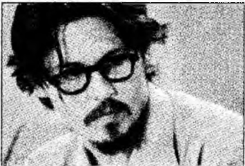
Johnny Depp

Casa de producție Infinitum Nihil, deținută de actorul Johnny Depp, va produce acest film și este posibil ca actorul să facă parte și din distribuția producției. La Londra, ancheta în cazul morții lui Litvinenko, agentul secret care a fost otrăvit cu poloniu-210 în noiembrie 2006, continuă.