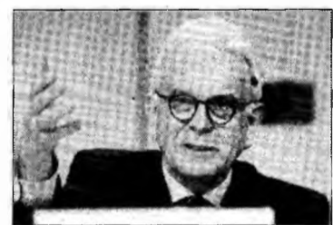
Hans-Gert Poettering e cel mai probabil viitorul președinte

O altă gafă recentă a lui Borrell a vizat-o pe regina Olandei care, după încheierea unui discurs, a rămas pe podium pentru o perioadă de timp fără ca nimeni să o escorteze înapoi la locul său,