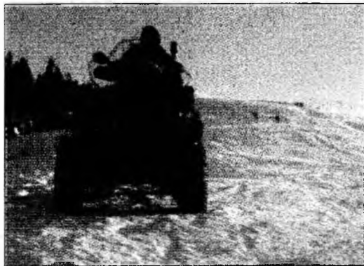
Rănitul a fost salvat de jandarmi