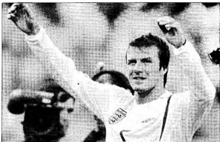
În SUA, atacantul englez va câștiga un milion de dolari pe săptămână

„Nu am vrut să merg în SUA la 34 de ani, pentru ca lumea să spună că am făcut-o doar pentru bani. Nu pentru asta merg acolo. Dacă am regrete? Nu. Nu am avut niciodată vreun regret în viața mea”, a mai spus jucătorul englez. Sursa citată notează că valoarea contractului lui Beckham pare să fie una dintre cele mai mari din sport, Beckham urmând să câștige