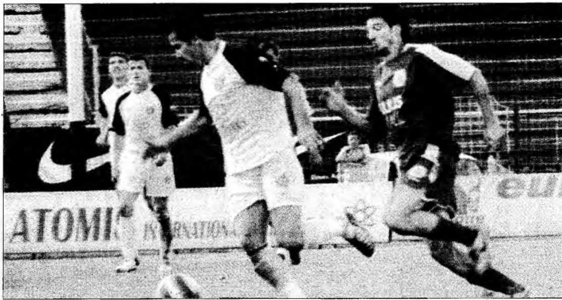
„Minerii” vor avea un meci foarte dificil astăzi