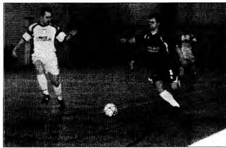
Olimpic Simeria s-a calificat mai departe