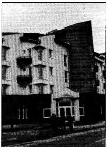
Căminul Facultății de Inginerie

„Scopul urmărit al proiectului a fost promovarea pregătirii resurselor umane din sectorul IMM al Regiunii V Vest pentru a fi mai adaptabile la schimbările structurale de pe piața muncii și capabile să răspundă cerințelor de competitivitate care stau în fața firmelor în perspectiva integrării europene și acționării acestora pe o piață unică, în societatea bazată pe cunoaștere. Acțiunile principale au fost îndreptate spre desfășurarea unui amplu program de training derulat în toate județele Regiunii Vest și editarea a două publicații, adresate sectorului IMM, ca instrumente de lucru: „Managementul afa-