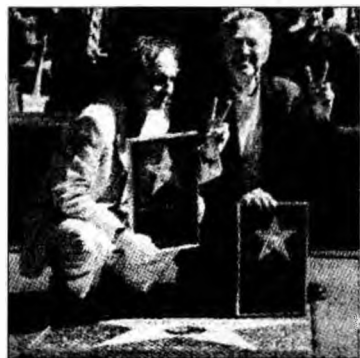
Robbie Krieger și Ray Manzarek

Los Angeles (MF) - La 40 de ani de la fondarea uneia dintre trupele care au marcat istoria muzicii rock, doi dintre cei trei membri supraviețuitori ai grupului condus de celebrul Jim Morrison, clăparul Ray