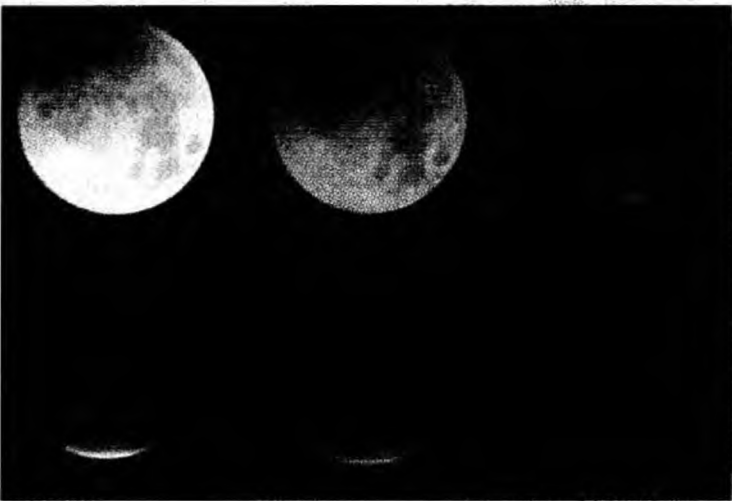
Fazele Lunii în timpul unei eclipsei totale

Eclipsa din 3 martie este una lungă: durata fazei totale va fi de 1 ora și 13 minute. Interesant este faptul că va fi vizibilă parțial de pe șapte con-