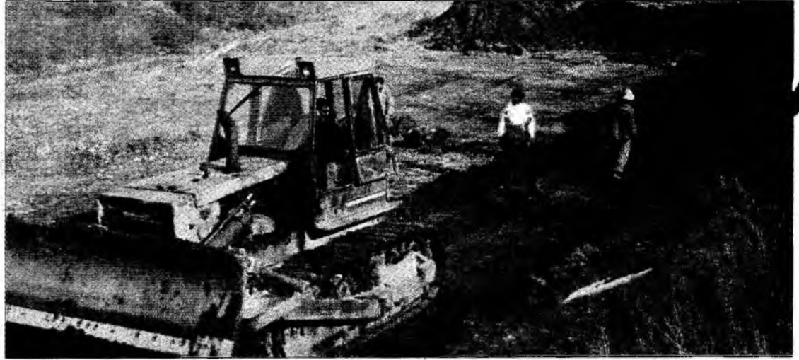
Drumul express va fi terminat într-un an de zile

Hunedoara (M.S.) - Lucrările de reabilitare și modernizare ale drumului județean care face legătura între municipiul Hunedoara și localitatea Sântuhalm vor începe imediat după jumătatea lunii în curs și sunt programate să se încheie în luna martie-aprilie a anului 2008. Volumul de muncă este impresionant, dacă se ține seama că actualul drum, în lungime de 7,5 kilometri, se va extinde la câte două benzi de circulație pe sens. „Vom avea tronsoane în care lățimea fiecărei benzi de circulație va fi de 3,5 metri. Este vorba de porțiunea de la intersecția de la Sântuhalm