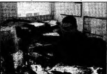
Se dau bani firmelor

strucția, reconstrucția, extinderea sau modernizarea de active corporale direct legate de realizarea proiectului de investiții. Pentru selectarea instituției financiare prin care se va derula linia de creditare, ANIMMC va încheia protocoale de colaborare cu instituții bancare, care vor stabili mecanismele de finanțare a investițiilor.