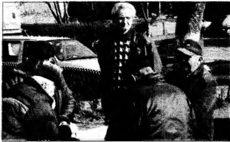
Autoritățile intenționează să modifice legea ce-i vizează pe pensionari

înregistrate drepturile salariale, pentru o anumită perioadă, asiguratul putea prezenta acte doveditoare de certificare. În caz contrar, drepturile salariale luate în calcul se considerau egale cu salariul minim brut pe economie, în vigoare în perioada respectivă. Proiectul propune ca pentru aceste persoane, la determinarea punctajului mediu anual să se utilizeze salariul minim pe țară, în vigoare în perioada respectivă. În această categorie nu intră însă și persoanele care au lucrat în perioadele anterioare datei de 1 ianuarie 1963 pentru care, la determinarea punctajului mediu anual, se utilizează un punct pentru fiecare lună de stagiu de cotizare. O altă modificare se referă la faptul că plata pen-