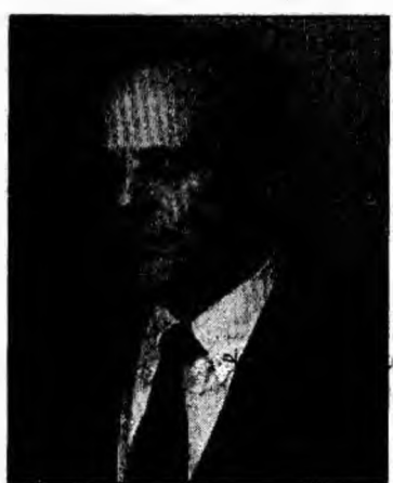
Președintele interimar, Theodor Stoilojan

Procurorul de ședință a solicitat magistraților să respingă contestația PNL ca nefondată.