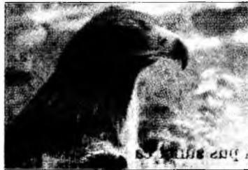
Kerekes Istvan AFIAP: Acvila regală

având în vedere că păsările răpitoare au un loc extrem de important în ecosistem. Pe parcursul zilei de astăzi este organizată o deplasare pe Valea Râul Mare, un teritoriu al unei perechi de acvilă de munte.