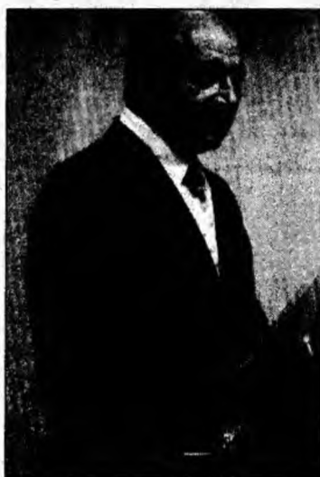
Președintele Traian Băsescu

Traian Băsescu a invitat partidele parlamentare la consultări pentru analizarea variantelor de scrutin uninominal, în vederea schimbării modului de alegere a Camerei Deputaților și Senatului, discuții care vor avea loc în 6