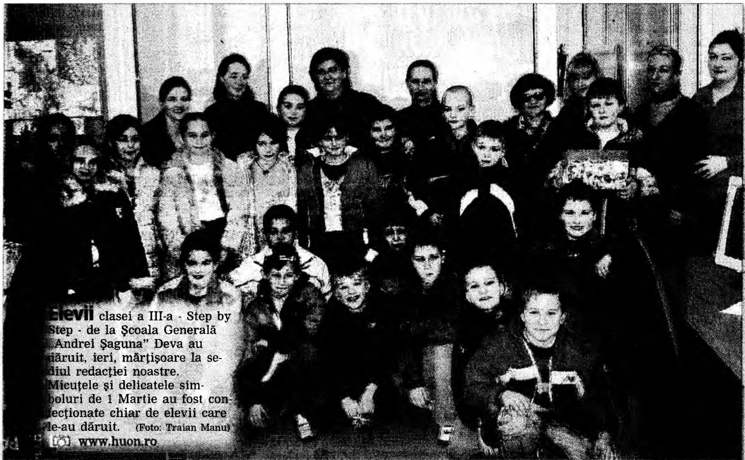
Elevii clasei a III-a - Step by Step - de la Școala Generală „Andrei Șaguna” Deva au sărbătorit, ieri, mărțișoara la sediul redacției noastre. Micuțele și delicatele simboluri de 1 Martie au fost confecționate chiar de elevii care le-au dăruit. www.huon.ro