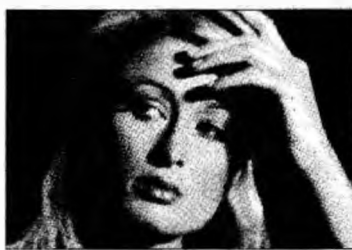
Paris Hilton