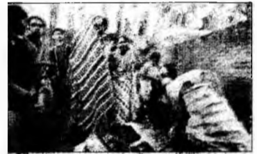
Locuință distrusă de flăcări

Dhaka (MF) - Cel puțin 21 de persoane au murit într-un incendiu izbucnit într-un district al orașului-port Chittagong, din Bangladesh, ieri dimineața, au declarat polițiștii. Între morți se numără zece copii și opt femei, iar alte