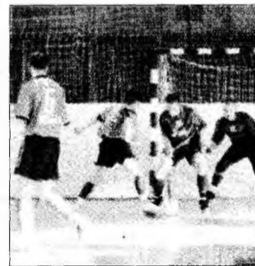
Returul Campionatului se va relua la 15 aprilie

reieșit faptul că, în general, returul s-a desfășurat fără probleme deosebite, în cele mai multe cazuri existând sprijinul financiar și organizatoric al primăriilor. În principal, dezbaterile s-au axat asupra necesității întăririi ordinii și disciplinei, atât pe teren, cât și în tribune. S-a insistat asupra nevoii unor măsuri organizatorice urgente care să ducă la amenajarea de vestiare la terenurile de fotbal de la Boșorod, Păcliaș, Ghelari, Ribița și General Berthelot. Aici sunt necesare, de asemenea, asigurarea apei potabile și împrejmuirea ba-