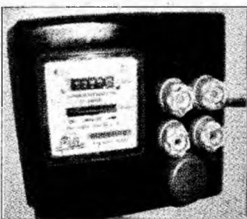
Se scumpesc utilitățile