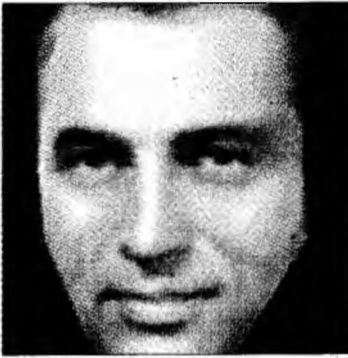
Portretul robot

■ Psihologii britanici au realizat pe computer portretul robot al unui James Bond perfect.