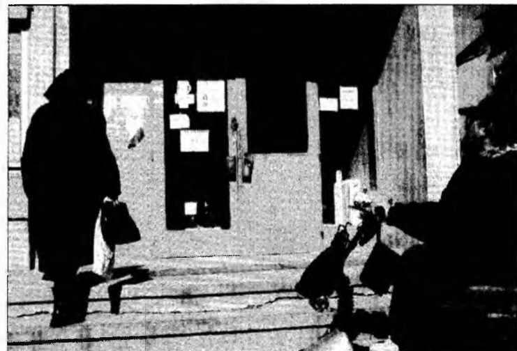
Lipsa rampei ține persoanele cu handicap la ușile instituțiilor

„Mi se pare umilitor ceea ce se întâmplă. E adevărat, unele instituții s-au conformat legii, dar lucrarea este făcută de mântuială. Nu este un secret că de foarte multe ori s-a întâmplat ca persoanele cu handicap să cadă de pe cărucioare tocmai pentru că panta rampei a fost prea înclinată. La spital, spre exemplu, există rampă, dar ușa de acces în clădire este încuiată permanent. Nu mai spun de transportul în comun! Primăria, cea care dă avizul de transport, n-a mișcat un deget