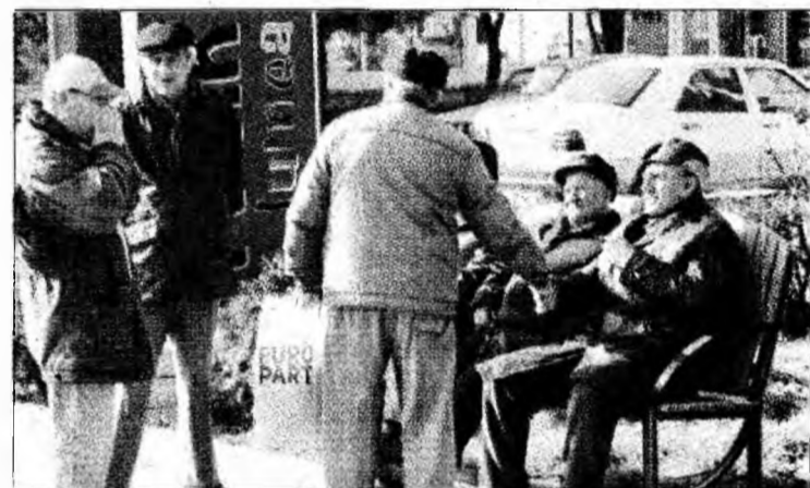
Pensionarii sunt consultați în modificarea Legii pensiilor

Deoarece pentru perioadele anterioare datei de 1 septembrie 1947 nu se cunosc salariile minime și medii din fiecare an și nici nu pot fi determinate, din cauza lipsei informațiilor despre reformele monetare, se propune ca la determinarea punctajului mediu anual să se utilizeze salariul mediu, chiar și în situațiile în care există înregistrări în carnetele de muncă sau salariile sunt dovedite prin adeverințe. Se propune totodată înlocuirea salariului minim cu salariul mediu și pentru perioadele cuprinse între 1 septembrie 1947 și 1