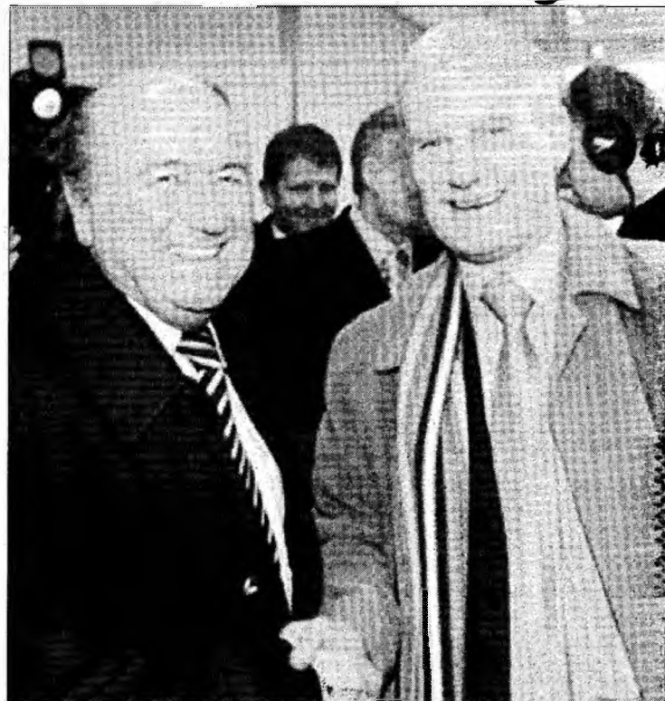
Până la urmă, ministrul Lipiec (în dreapta) a cedat și a dat mâna cu șeful FIFA, Joseph Blatter

Polonia candidează împreună cu Ucraina pentru organizarea Campionatului European din 2012, alte țări înscrise în cursă fiind Italia, Croa-