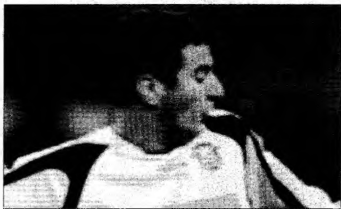
Zicu mai așteaptă o lună, pentru a-și cunoaște soarta

Artest, una dintre vedetele ligii profesionale nord-americane de baschet (NBA), a fost plasat în detenție și i-a fost stabilită o eliberare pe cauciune de