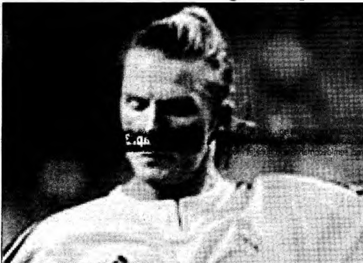
David Beckham ar putea sta pe margine până pleacă de la Real

Cei doi fotbaliști s-au accidentat în partida pe care Real Madrid a terminat-o la egalitate, duminică, pe teren propriu, scor 1-1, cu formația Getafe, în etapa a XXV-a a campionatului Spaniei. Reyes s-a ciocnit cu portarul lui Getafe,