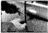
Hoții au fost prinși

Puteți vota prin SMS până vineri, ora 15.