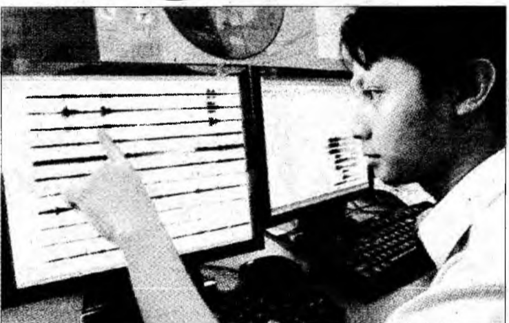
Agencia meteorologica de la Singapore a anunțat 6,6 grade pe scara Richter.

Purtătorul de cuvânt al președintelui indonezian anunțase anterior că cel puțin 70 de persoane și-au pierdut viața în urma seismului. „Există