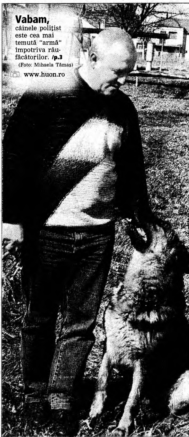
Vabam, câinele polițist este cea mai temută „armă” împotriva răufăcătorilor. /p.3 www.huon.ro