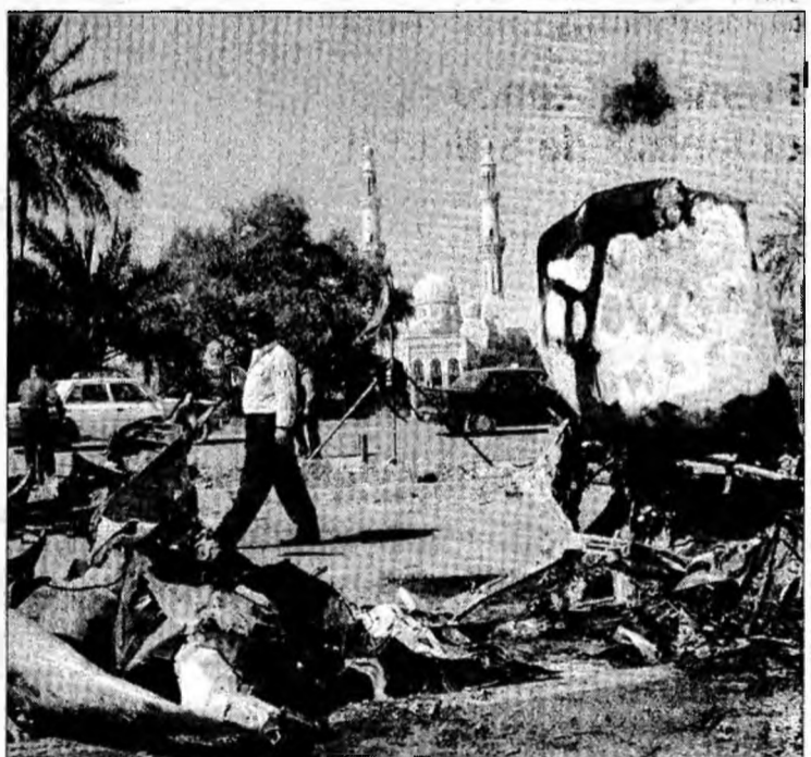
Noile victime ridică la 3.176 numărul militarilor americani uciși în Irak

El a subliniat că, indiferent de campaniile mediatiche la care procurorii ar fi supuși, nu există lucru mai important pentru români decât o justiție corectă.