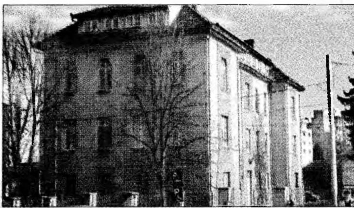
Clădirea Secției de Pediatrie a Spitalului Județean Deva