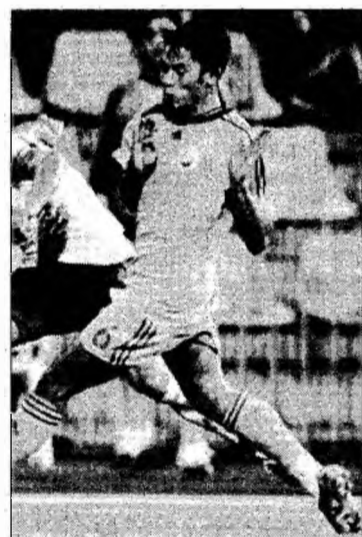
Codrea nu se va mai lupta și cu luxemburghezii

România va întâlni, miercuri, la ora 18.30, la Piatra Neamț, reprezentativa statului Luxemburg, în grupa G a preliminariilor Euro-2008. După patru meciuri disputate, România ocupă locul trei în grupa G, cu 8 puncte,