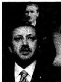
Recep Tayyip Erdogan

Berlin (MF) - Cancelarul german Angela Merkel va continua să-și aplice strategia de revigorare a Constituției europene, prin organizarea de discuții confidentiale cu oficialii naționali, în pofida criticilor conform cărora planul său ar afecta o dezvoltare democratică. Ea vrea să continue această metodă și să pună bazele unui nou tratat european.