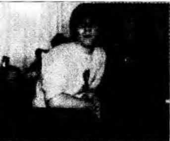
Hunedoreni își așteaptă rândul la proteze medicale

Deva - Accidentele de mașină, cele din timpul serviciului, defecte din naștere sau pur și simplu întâmplări nefericite fac ca numărul cererilor pentru proteze de orice tip să crească în fiecare zi. Dintre acestea doar o parte pot fi decontate, dat fiind sumele uriașe cerute de producători. „Avem solicitări și de anul trecut, din martie 2006, care încă nu au putut fi rezolvate, cele mai multe din sfera protezelor auditive. Decontarea protezelor se face în funcție de prioritate. Este