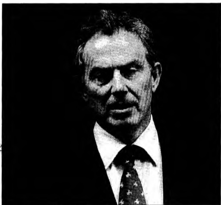
Premierul Tony Blair avertizează Iranul să-i elibereze pe cei 15 militari britanici

„Sper că îi vom convinge să îi pună în libertate. Însă, în caz contrar, se va intra într-o nouă etapă”, a avertizat liderul de la Downing Street fără a oferi alte detalii.