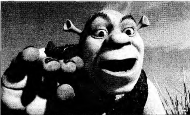
Shrek, unul dintre cele mai simpatice personaje de animație