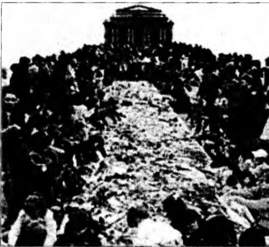
Crucea de flori

Hunedoara (S.B.) - Cetățenii municipiului Hunedoara vor construi în Ziua de Florii, 1 aprilie 2007, la ora 13.00, pe platoul din fața Casei de Cultură, Marea Cruce de Flori, simbol al bucuriei în gând și în suflet. La eveniment vor participa copii și elevi de la grădinițele și școlile generale din municipiul Hunedoara, care vor participa și prin prezentarea unor acțiuni specifice, care să redea bucuria sosirii primăverii, cum sunt concursuri diverse și desene pe asfalt. Mesajul desenelor trebuie să vorbească despre credință, toleranță, speranță, frumusețe și pace.