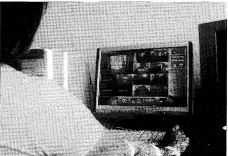
Toate mișcările din școală sunt atent monitorizate