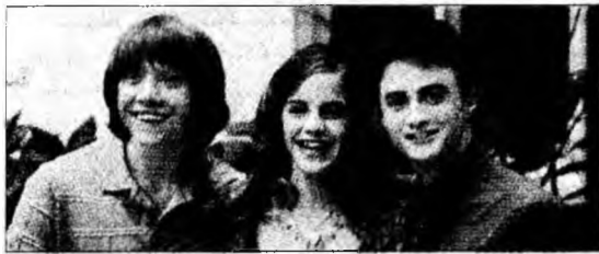
Grint, Watson și Radcliffe

● Duet. Cântărețul Justin Timberlake vrea să înregistreze un duet împreună cu Britney Spears, pentru a o ajuta pe cântăreață să-și reia cariera muzicală internațională întreruptă în urmă cu aproape doi ani.