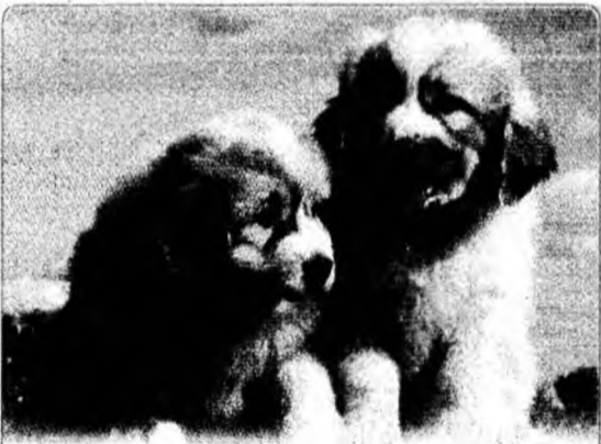
Bella și Asher , doi pui din rasa câinilor de pază de Pirinei, s-au bucurat de prima lor ieșire în parc.

Las Vegas (MF) - O statuie a lui Michael Jackson, cu o înălțime de aproximativ 15 metri, va fi ridicată în apropierea orașului Las Vegas, în vederea unui spectacol pe care auto-proclamatul rege al muzicii pop îl va susține acolo. Statuia s-a numărat printre propunerile starului, potrivit oamenilor de afaceri locali, și din ea vor ieși raze laser.