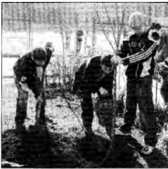
Plantarea primului copac