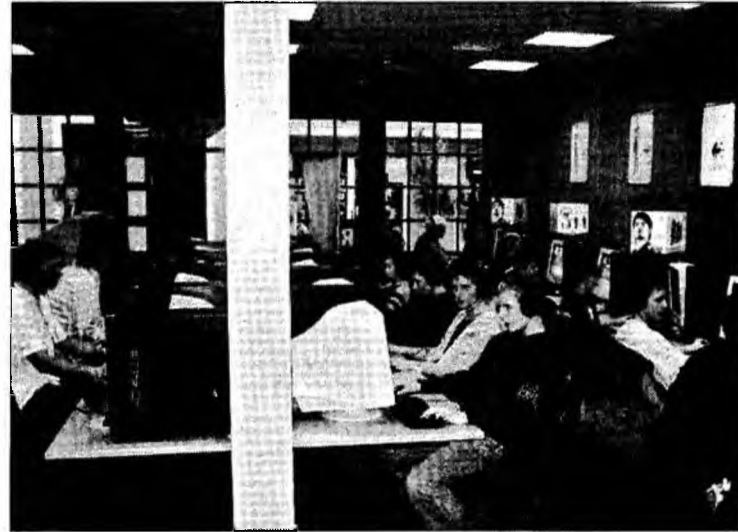
Internetul are o atracție magnetică asupra tinerilor

Pasiunea pentru chat nu poate fi catalogată nici bună, dar nici rea, crede psihologul Dan Oltean. „Unii citesc 2-3 ore pe zi, alții merg cu bicicleta, e o problemă legată de hobby. A discuta pe Net nu este un pericol în sine, e o moda-