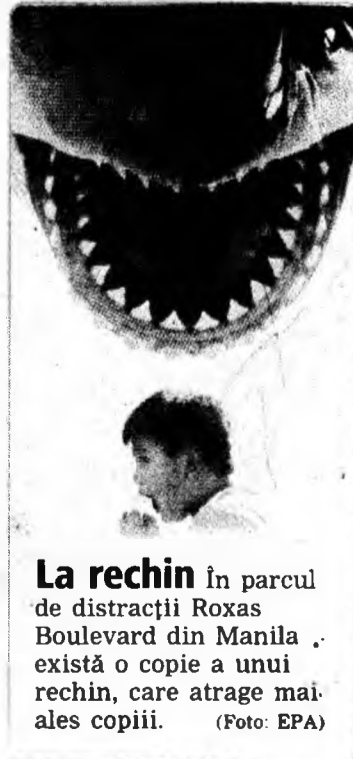
La rechin în parcul de distracții Roxas Boulevard din Manilla există o copie a unui rechin, care atrage mai ales copiii.