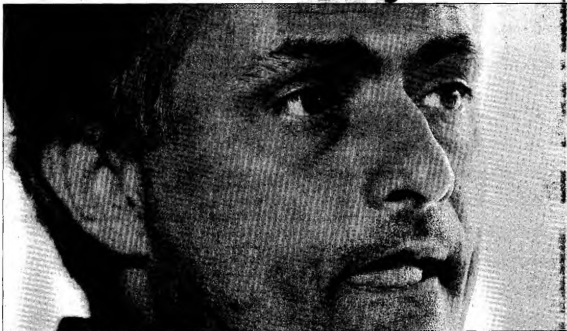
Tehnicianul echipei Chelsea și-a apărat patrupedul și ar putea fi pedepsit de lege

Mourinho și soția sa l-au cumpărat pe Gullit (n.r. - câine numit după fostul internațional olandez Ruud Gullit) în luna martie, de la un cunoscut crescător de câini Yorkshire Terrier, pentru a-l dăruia celor doi copii ai lor. Se pare că cei doi copii l-au înscris pe câine într-un club din Portugalia pentru câini de această rasă, după ce au găsit site-ul clubului respectiv pe internet. Cei doi au primit un permis de membru al clubului, dar Mourinho neagă că l-ar fi scos vreodată pe câine din Anglia. Potrivit unor surse, Gullit a ajuns însă în Portugalia, iar