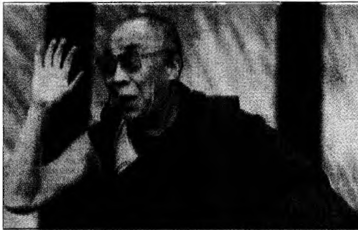
Dalai Lama își dorește o mai mare autonomie

Dalai Lama locuiește în exil la Dharamsala, India, din 1959, după ce revolta inițiată de tibetani împotriva regimului