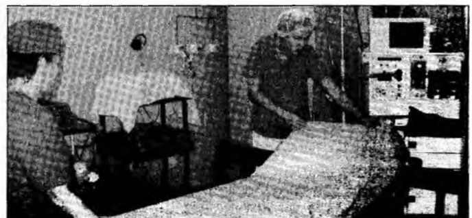
Noul spital va avea peste 400 de paturi