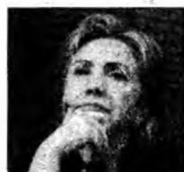
Hillary Clinton