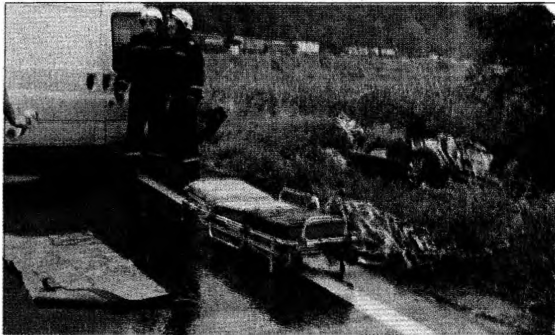
Victima a decedat instantaneu în urma impactului

Paramedicii au încercat în zadar să-l resusciteze pe șoferul german. Conducătorul autoturismului Toyota a dece-