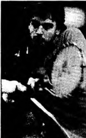
Mario Ancic

Paris (MF) - Tenismenul croat Mario Ancic a anunțat că nu va participa la Roland Garros, deoarece nu este refăcut complet. Ancic, numărul 16 mondial, s-a accidentat la încheietura mâinii drepte.