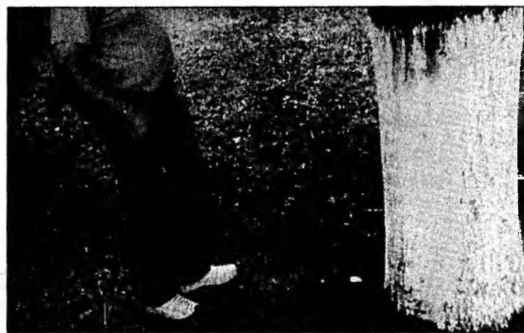
Detectorul a adus numai necazuri

Contactat de „Cuvântul Liber”, purtătorul de cuvânt al IJJ Hunedoara, sublocotenent Nicolae Răducu, a făcut o serie de precizări privind modul în care polițiștii hune-