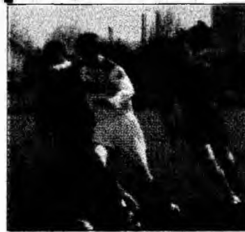
CFR a dominat jocul