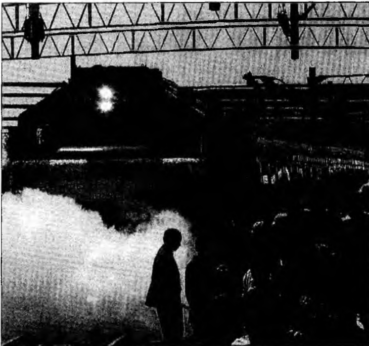
După 56 de ani, două trenuri din cele două Corei au traversat ultima graniță a Războiului Rece

Componența noului Guvern urmează să fie anunțată astăzi.