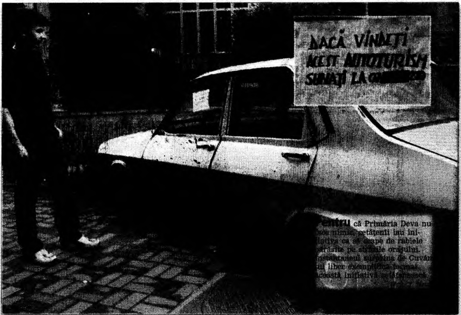
Centru că Primăria Deva nu avea nimic petătenii își ini- lativa ca să scape de rabele arabite pe străzile orașului. Instanțanul susținut de Cuvân- tul liber exemplifică în mai această inițiativă petătenia...