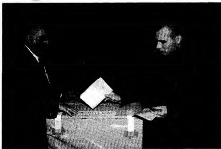
Vom vota la 19 mai

Deva - La acest referendum național au dreptul să participe toți cetățenii români care au împlinit vârsta de 18 ani, până în ziua referendumului, inclusiv, cu excepțiile prevăzute de lege. Cetățenii cu drept de vot se pot prezenta la urne în data de 19 mai, între orele 8 și 20. Ei trebuie să aibă asupra lor, obligatoriu, actul de identitate, acesta fiind singurul care le conferă posibilitatea de a vota. Vor primi un buletin de vot pe care își vor exprima opțiunea la acest referendum, în mod individual, aplicând ștampila cu mențiunea VOTAT în unul din cele două pătrate ale buletinului de vot. Votul aplicat pe „DA” semnifică demiterea președintelui. Votul aplicat pe „NU” semnifică repunerea președintelui în drepturi. Per-