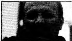
Manouchehr Mottaki

Islamabad (MF) - O serie de oficiali iranieni și americani se vor întâlni în Irak, la 28 mai, pentru a discuta despre securitatea Irakului, afectat de violențe interconfesionale, a declarat, ieri, ministrul iranian de Externe Manouchehr Mottaki.