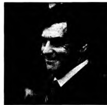
Fillon este descris ca fiind discret și eficient

Fillon este consilierul politic al lui Sarkozy începând din 2004 și a ocupat funcția de ministru în repetate rânduri. Discret și eficient, el a dat numele său unei ample reforme a sistemului de pensii aplicată în 2003.