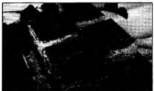
Poftă bună!

Ingrediente: 1 pachet pișcoturi, 1 cutie mascarpone, 1 cutie frișcă Hulala, 3 ouă, 150 g zahăr, esență de rom, cacao, 1 cană cafea. Mod de preparare: Se freacă zahărul cu gălbenușurile. După ce amestecul devine spumos, se adaugă cutia de mascarpone și se amestecă bine. Separat se bate frișca și se pune peste compoziția de mai sus. Se adaugă esența de rom. Într-un vas, se pune un strat subțire din crema obținută, apoi se pun pișcoturile trecute prin cafea, unul lângă altul. Peste ele se pune un strat de cremă, apoi alt strat de pișcoturi, terminându-se cu cremă, peste care se pudrează cacao.