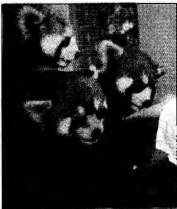
Plictisiți, înghesuți

„Se numește nebunie zoologică. Animalele sunt pur și simplu scoase din minți din cauza plictiselii”, a afirmat doctorul John Wederburn. Spectacolele în care urșii sunt dresați să răsucescă bețe aprinse și să meargă pe motocicletă sunt adesea criticate. Un urs de trei ani a fost îmbrăcat în ochelari și înhămat la o mașină, pe care trebuia să o tragă de două ori pe zi în