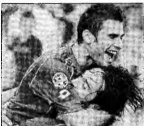
Adi Mutu