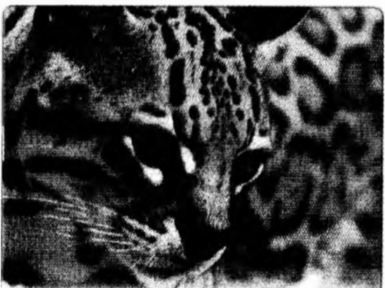
Margay , sau pisica-tigru, este una dintre sutele de specii care sunt pe cale de dispariție din cauza defrișărilor excesive și a vânătorii ilegal din Honduras.

Budapesta (MF) - Budapesta a înregistrat marți temperaturi record pentru acest anotimp, cu 34,5 grade Celsius, a anunțat ieri serviciul meteorologic național (OMSZ), citat de AFP. Fostul record de 33,6 grade Celsius, a fost înregistrat în 1983.