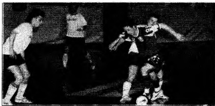
FC CIP poate reedita performanța din sezonul trecut

Prima luptă din cadrul duelului CIP - Odorheiu are loc azi la Odorheiu și contează ca meci tur al semifinalelor Cupei României. „Obiectivul nostru în acest joc e să obținem un scor cât mai strâns, să studiem jocul și potențialul adversarilor. ACS Odorheiu a făcut niște achiziții de marcă la finalul sezonului regulat, transferând trei jucători din naționala Ungariei care au ridicat valoarea și forța echipei. Și acest joc și toate celelalte în care vom juca la finalul acestui sezon cu ACS Odorheiu vor fi