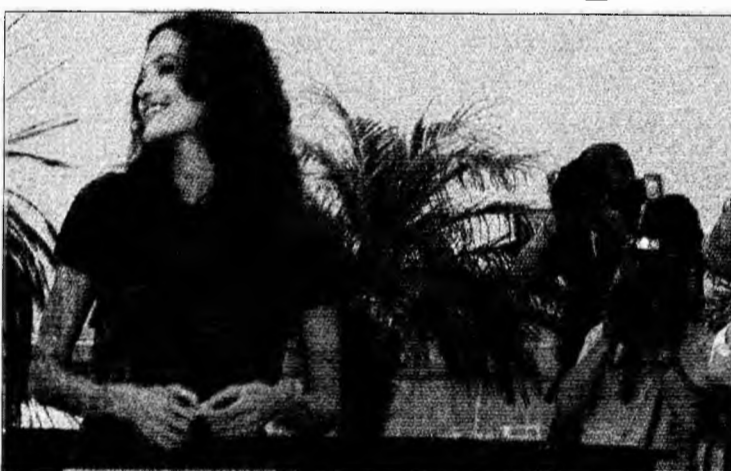
Angelina Jolie la Cannes