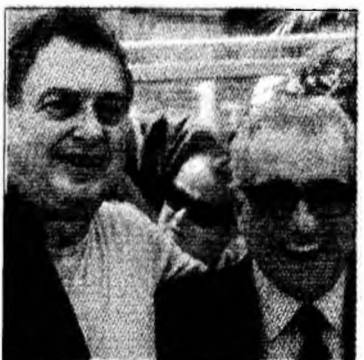
Stephen Frears, președintele juriului, și Martin Scorsese

celebrului regizor american Martin Scorsese care își propune să sprijine financiar conservarea, restaurarea și difuzarea de filme din întreaga lume. World Cinema Foundation a fost lansată în mod oficial marți seară. În sala conferinței de presă în care era așteptat Scorsese s-a aflat și Victor Rebengiuc, invitat la Cannes în calitate de protagonist al filmului.