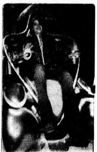
Doar șoferul Vehiculul Toyota i-Unit a fost prezentat marți, la Muzeul Științei din Londra.