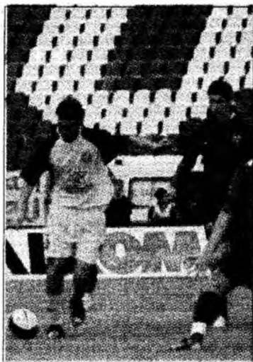
Jiul a susținut ieri ultimul meci în Liga I

Petroșani - Bucuria venirii campioanei României, Steaua, la Petroșani a fost umbrită de faptul că Jiul a susținut, ieri, ultimul meci în Liga I. Meciul cu Steaua nu a avut nici o miză pentru Jiul, retrogradată deja cu multe etape înainte, așa că Steaua a avut o misiune ușoară. Echipa antrenată de Cosmin Olăroiu a învins, fără să forțeze prea mult, cu scorul de 2-0 și și-a asigurat locul secund în clasament, poziție care îi dă dreptul să evolueze la vară în turul doi preliminar al Ligii