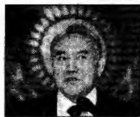
Nursultan Nazarbaiev