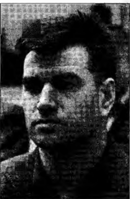
Milorad Lukovici

Zoran Djindjici a fost asasinat la 12 martie 2003, în fața clădirii Guvernului de la Belgrad. Procesul presupușilor săi asasini a început în decembrie 2003.