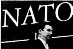
Serghei Ivanov

Moscova (MF) - Rusia nu are nici o intenție de a coopera cu SUA în privința scutului antirachetă care va fi amplasat în Europa, a declarat, ieri, prim-vicepremierul rus Serghei Ivanov, citat de Reuters. „Nu vom coopera în detrimentul nostru”, a declarat acesta. „Nu ne place explicația (dată de SUA în favoarea sistemului antirachetă)”, a adăugat el.