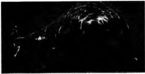
A apărut între femele

● Reface dinții. O pastă de dinți care pune capăt suferințelor persoanelor cu dantură sensibilă prin reconstruirea smalțului dinților a fost lansată în Marea Britanie de o companie. Pasta îmbracă dinții cu un strat de calciu lichid, mineralul din care este construit smalțul, care ajută dinții să se repare singuri. Calciul sigilează cariile și protejează nervii expuși prevenind durerea.