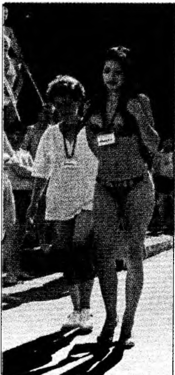
Cine va câștiga în acest an?

Deva (V.N.) - Raliul Frumuseții. Cea de-a XI-a ediție a „Raliului Frumuseții” se va desfășura în perioada 1-3 iunie a.c., pe un traseu deja cunoscut, care cuprinde zona primăriilor Deva, Hunedoara, Geoagiu și Simeria. Organizator este Filiala ACR Hunedoara, sub patronajul Consiliului Județean. Vor fi două probe de îndemănare, una la Deva, de unde se va da și startul, iar alta în centrul municipiului Hunedoara. Competiția se va încheia la Ștrandul Complex Băile Daco-Romane din Geoagiu-Băi și va cuprinde și organizarea concursului „Miss Raliul Frumuseții”. Ca de obicei, premiile se va desfășura în incinta ștrandului din Geoagiu.