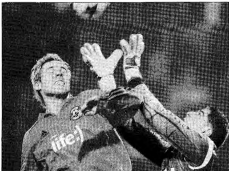
Portarul Rapidului ar putea reveni între buturi în finala „Cupei României”