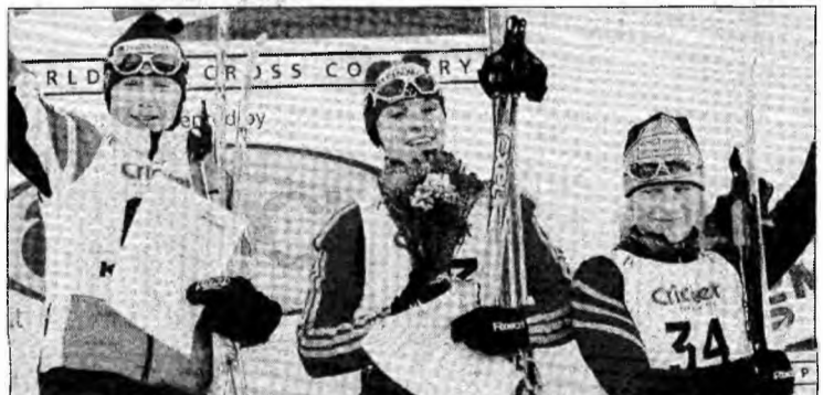
Superb gestul sportivei - prima din dreapta -, pus în slujba celor mici și neajutorați