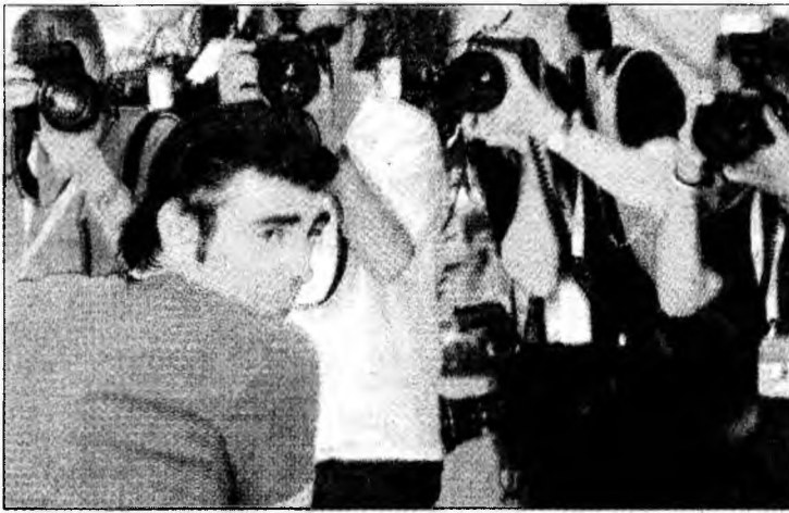
Regizorul Fatih Akin, ținta fotoreporterilor

Actrița Hanna Schygulla, îi coordonează cu măiestrie pe ceilalți actori germani și turci în acest film care constituie a