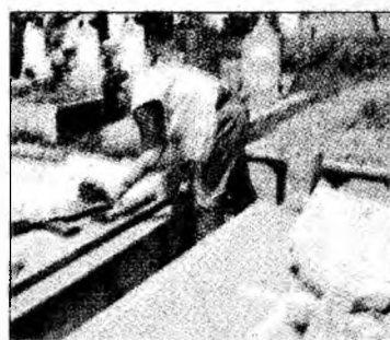
Crucile au fost doborâte

care a demarat o anchetă pentru prinderea și identificarea celor care au distrus crucile de pe cele șase morminte. Se presupune că ar fi vorba de persoane care, în stare de ebrietate fiind, au reușit să intre fără să fie auzite de paznici și să spargă crucile situate nu departe de alea principală a cimitirului. „În cauză s-a întocmit dosar penal, iar echipa operativă continuă cercetările pentru identificarea autorilor”, a declarat purtătorul de cuvânt al Inspec-