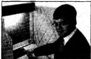
Jan Peter Balkenende

Strasbourg (MF) - Premierul olandez, Jan Peter Balkenende, a pledat pentru înscrierea oficială a criteriilor de aderare la UE în viitorul Tratat european, care urmează să înlocuiască Constituția respinsă la vot de electoratul din Olanda și Franța.