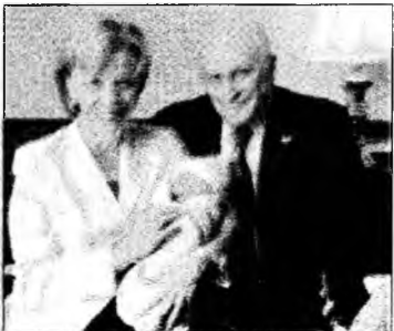
Dick și Lynne Cheney cu nepotul