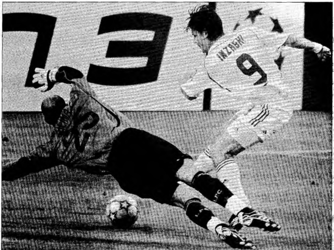
Filippo Inzaghi a fost, din nou, omul providențial pentru milanezi

„Această victorie este cu atât mai frumoasă cu cât am fost nevoiți să surmontăm numeroase dificultăți. Este, probabil, cea mai frumoasă dintre toate. Nu vreau să vorbesc despre revansă după scandalul din fotbalul italian, din care a avut de suferit, mai ales AC Milan. Dar această victorie este prețioasă deoarece va readuce seninătate și credibilitate fotbalului italian. Puțin, suporteri, puțini oameni, probabil nimeni nu se gândea că am putea câștiga în acest an. Valoarea mea pe piață a