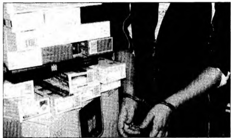
Contrabanda cu țigări este în topul infracțiunilor economice

În acest an, Garda Financiară va avea o suplimentare de 500 de posturi, în timp ce la inspecțiile fiscale personale va crește cu 1500 de angajați. Șeful ANAF a menționat că, și în aceste condiții, ar mai fi nevoie de încă 3000 de persoane care să lucreze în domeniu. Dacă inspectorii fiscali angajați în acest an își