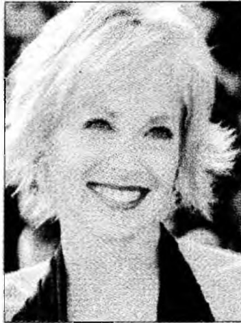
Sharon Stone

■ Kylie Minogue și Sharon Stone au cântat într-un duet sexy la gala amFAR de la Cannes.