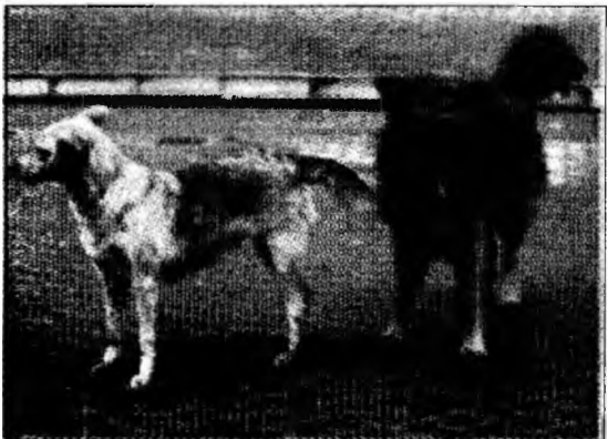
Câinii comunitari continuă să facă victime