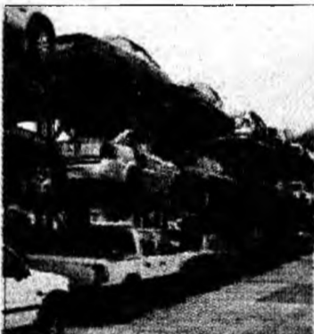
Taxa de primă înmatriculare a scăzut la jumătate

București (T.S.) - Ministrul economiei a făcut publice valorile orientative ale taxei de primă înmatriculare. Cea mai mică taxă va fi pentru mașinile de 1-2 ani, în jur de 150 euro. O mașină de 20 de ani va avea o taxă de aproximativ 1.300 euro. Taxa aferentă înmatriculării unei mașini cu o vechime de 1-2 ani, având un motor de 1,4 litri, va fi de 139 euro, comparativ cu 284 euro, cât era înainte. Pentru un autoturism similar cu un motor de 1,6 litri, taxa va fi redusă de la 324 la 159 euro. În cazul autoturismelor non-euro, taxa pentru o mașină de