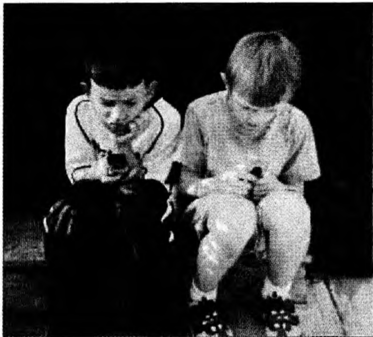
Copiii sunt cei mai expuși furtului de telefoane mobile.