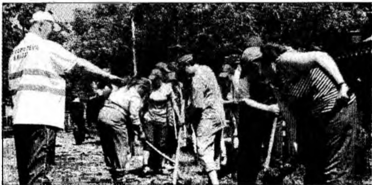
Măine se va deschide ștrandul din Deva

Terenurile de sport amenajate cu gazon artificial vor fi, cu siguranță, un alt punct de atracție al ștrandului din Deva. Pe două terenuri se vor putea juca partide de minifotbal, alte două suprafețe fiind destinate amatorilor de tenis