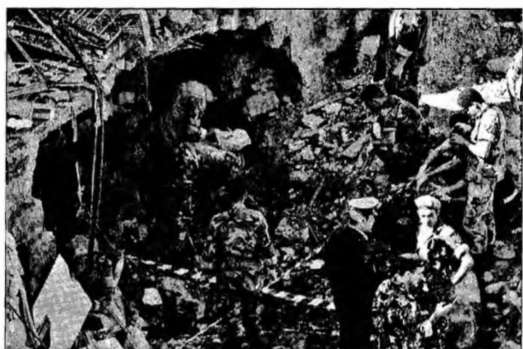
Explozia de lângă autostrada Damasc-Beirut a avariat clădirile și magazinele din zonă

O sesizare cu conținut similar a fost înaintată CSM de către procurorul șef al Direcției Naționale Anticorupție, Daniel Morar, care arată că președintele Camerei Deputaților a solicitat prezența a doi procurori și doi ofițeri de poliție judiciară în fața aceleiași comisii.