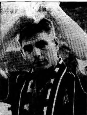
Steven Gerrard

viitor. Am avut controlul meciului în prima repriză, dar în a doua parte nu a fost așa cum ne-am fi dorit. Însă nu trebuie să uităm că am întâlnit o echipă de foarte bun nivel, cu jucători foarte mari. Trebuie să aducem un omagiu echipei AC Milan. A câștigat și probabil a meritat. La încălzire ne-am spus că acest meci a pe detalii și pe puțin noroc. AC Milan a avut noroc”, a spus Gerrard.