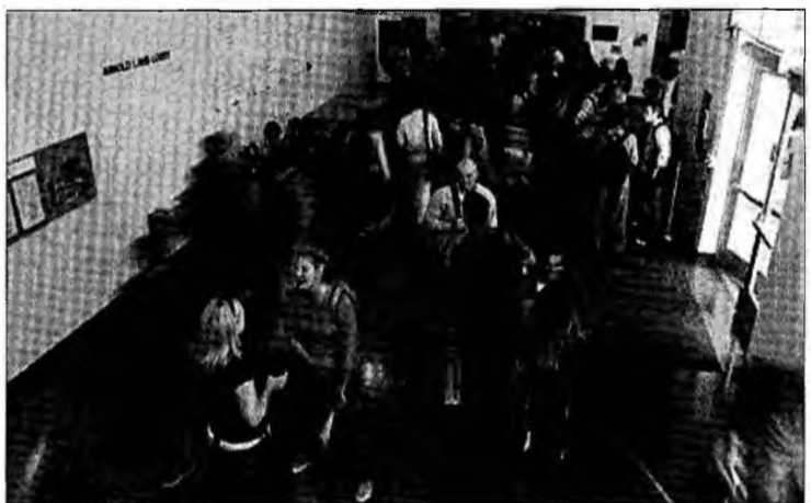
Violența în școli începe să devină un fenomen de amploare

Violența în școli a devenit în ultima perioadă o problemă majoră, iar părerea unanimă a elevilor este că aceasta e un fenomen care riscă să ia amploare. În ceea ce privește nivelul de securitate, doar o mică parte dintre elevi consideră că în insti-