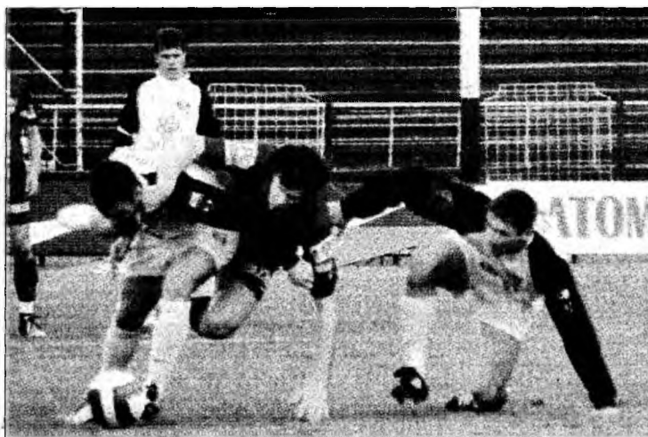
Minerii vor, la anul, din nou în Liga I