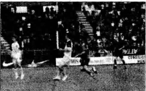
La Petroșani, Steaua și-a asigurat un loc în turul 2 preliminar al Ligii Campionilor