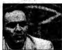
Garry Kasparov