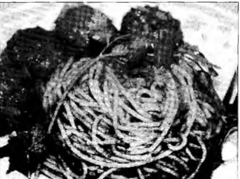
Poftă bună!

Ingrediente: 500 g spaghete, 4 gălbenușuri, 500 g smântână, 300 g bacon, pătrunjel, sare, piper.