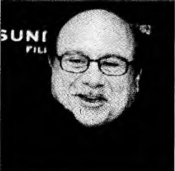
DeVito

DeVito va avea și misiunea de a prezenta un film inclus în competiția internațională a festivalului, „The Good Night”, în regia lui Jake Paltrow, în care actorul joacă alături de Gwyneth Paltrow, Penelope Cruz, Martin Freeman și Simon Pegg.