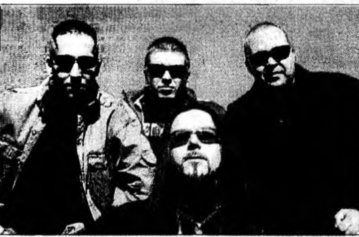
Trupa Altar va concerta pe 13 august

■ Festivalul se va desfășura anul acesta între 8 și 14 august, pe insula Óbuda de pe Dunăre.