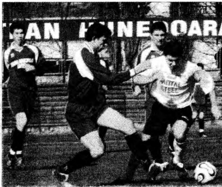
Oare ce se va întâmpla la Hunedoara?