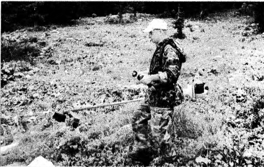
Rangerii cosesc ștevia pe pășunile din Retezat

Deva - Reprezentanții Administrației Parcului Național Retezat (APNR) au demarat o campanie de refacere a zonelor degradate din Retezat. Pentru că în perioada 1990 - 2000, în Retezat au fost distruse zeci de hectare de pășune, s-a făcut un studiu al pajiștilor din masiv care a dus la concluzia că suprafața unor pășuni s-a micșorat drastic din cauza pășunatului. Prin urmare, în această vară s-a trecut la acțiune la fața locului, după ce ani la rând, la sfârșitul fiecărei veri, în urma turmelor rămăneau ogașe, teren erodat și multă ștevie și părul porcului. „Aceste plante nu sunt pe placul oilor! Este foarte ușor să strici, dar foarte greu și costisitor să refaci ceea ce au stricat alții și să refaci natura! Fiindcă APNR nu are venituri proprii, s-a luat decizia