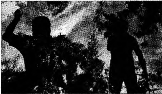
Pompierii, în luptă cu flăcările

● Pe primul loc. Brazilianca Gisele Bündchen s-a situat pe primul loc în topul Forbes al celor mai bine plătite 15 modele din lume, după ce anul trecut a câștigat 33 de milioane de dolari, de aproape trei ori mai mult decât Kate Moss, ocupanta locului al doilea, informează forbes.com.