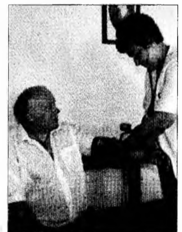
La centrul din Spitalul județean au apelat ieri puțini oameni

spre portocaliu. Dacă un singur om va muri în județ pentru că nu a ajuns suficient de repede într-un loc răcoros și nu a primit un pahar cu apă, chiar dacă lucrurile astea i-ar sta la îndemână după primul colț, poate că autoritățile vor înțelege că aceste zile nu sunt doar un exercițiu de imagine, ci o situație reală de criză cu care ne confruntăm. Și atunci cineva va trebui neapărat să răspundă. Pe principiul „ajută-te singur” oa-