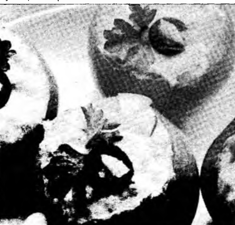
Poftă bună! Foto: arhiva