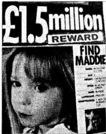
Se oferă recompensă

Tatăl fetei dispărute pe când se afla cu familia în vacanță în Portugalia i-a mul-