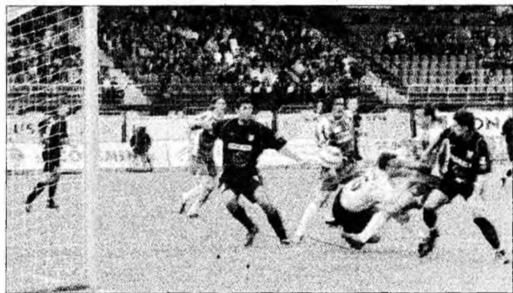
Nu numai oficialii sunt vinovați că Jiul a ajuns în Liga a II-a

sondajul de opinie inițiat arată mai mulți responsabili de retrogradarea echipei. Interesant este însă faptul că în capul listei se află conducerea clubului de fotbal. În opinia suporterilor, aceasta a contribuit decisiv la eșecul din acest sezon. În proporție de 42 la sută, suporterii consideră conducerea clubului vinovată că echipa evoluează din acest sezon în liga secundă. În mare parte ei își argumentează votul prin faptul că șefii au schimbat antrenorii din „etapă în etapă”. În ceea ce privește administrația locală, comentariile sunt și