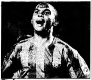
Eto'o

Madrid (MF) - Cotidianul Marca scrie, marți, că AC Milan, câștigătoarea Ligii Campionilor, va face o ofertă către FC Barcelona pentru achiziționarea atacantului Samuel Eto'o.