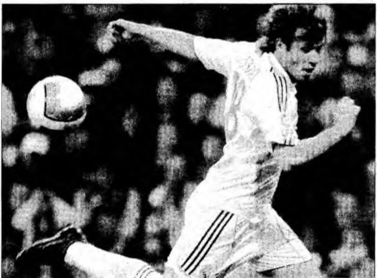
Conducerea milaneză declară sus și tare - nu îl vrea pe italianul Cassano, de la Real Madrid