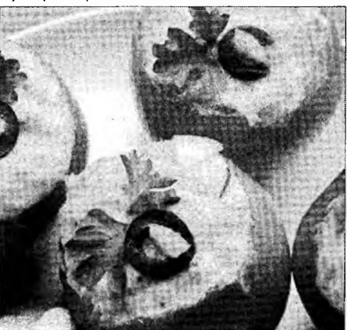
Poftă bună!

Ingrediente: 600 g roșii (10 buc.), 150 g brânză de vacă, 150 g telemea, 100 g unt, 50 g mărar, 100 g salată verde. Mod de preparare: Roșiile se sortează de mărime mijlocie, se curăță, se spală, se taie capacul, se scobesc cu lingura și se scurg. Mărarul se curăță, se spală, se zvântă și se taie mărunt. Salata verde se curăță, se spală și se scurge. Brânzeturile se trec prin mașina de tocat cu sită deasă și se amestecă cu untul frecat spumă și cu mărarul. Se freacă compoziția până se omogenizează. Se umplu roșiile și se așază pe un platou cu frunze de salată verde.