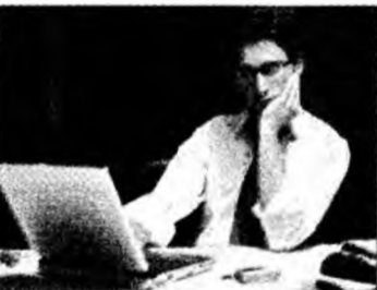
Se acordă granturi pentru afaceri

mediul unor servicii de consultanță. Bugetul destinat Regiunii Vest este de 636.000 euro. Solicitanții eligibili sunt IMM-urile (valoarea grantului va fi cuprinsă între 8.000 și 20.000 euro) și ONG-urile (valoarea grantului va fi cuprinsă între 20.000 și 160.000 euro).