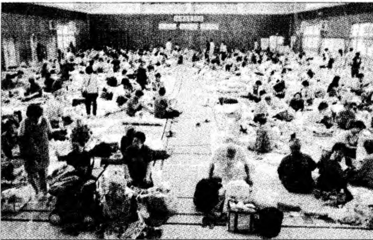
Mii de locuitori s-au adăpostit în incinta școlilor

În cursul nopții de luni spre marți, peste 1.000 de polițiști și pompieri au verificat ruinele a sute de clădiri prăbușite în urma cutremurului care a atins o magnitudine de 6,8 de grade pe scara Richter. „Nu avem timp de pierdut în