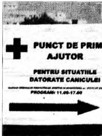
Săgeata indică direcția spre un centru de prim ajutor

În Franța, în 2003, canicula a făcut mii de victime. Soarele i-a luat prin surprindere pe francezi, dar era de presupus că din experiența lor nefericită fiecare țară a învățat câte ceva. Inclusiv România care acum numără 21 de județe în care avertizarea meteo a urcat