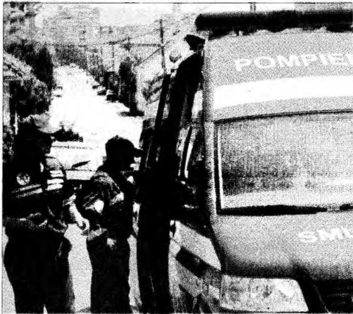
Un nou modul SMURD, la Brad