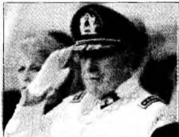
Brandul Pinochet

Santiago (MF) - Douăzeci de costume ale fostului dictator chilian Augusto Pinochet au fost puse în vânzare de către croitorul său din centrul orașului Santiago, potrivit coti-