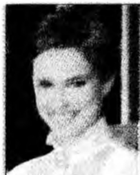
Natalie Portman

Istanbul (MF) - Un vas turc de pasageri și un cargo sub pavilion neprecizat au intrat în coliziune luni în largul Istanbulului, provocând rănierea a cel puțin 30 de persoane, a anunțat presa turcă, citată de AFP. Accidentul s-a produs în Marea Marmara, iar pe cheiul Yenikapi, din partea europeană a metropolei, unde vasul de pasageri a reușit să amareze după coliziune au fost trimise ambulante.