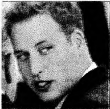
Adio burlăciei

ani, prințul le-ar fi mărturisit bunicilor săi că nu era sigur de sentimentele pentru Kate, afirmă un apropiat al casei regale, citat de publicație. În consecință, regina Elisabeta a II-a și soțul ei s-au săturat de șovăielile nepotului și-i cer lui William să aleagă: ori o ia de soție pe Kate, ori se desparte definitiv de ea.