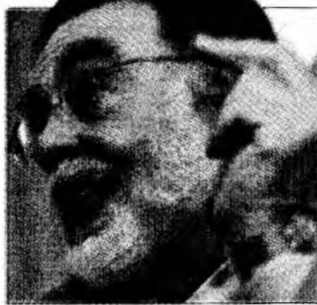
Coppola, prețuit de francezi

■ Francis Ford Coppola a primit una dintre cele mai înalte distincții franceze.