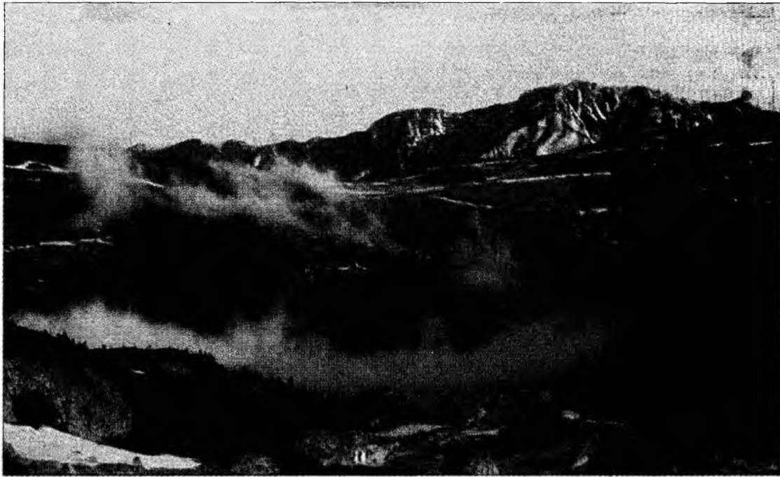
Oricât de greu ar fi traseul, peisajul merită efortul