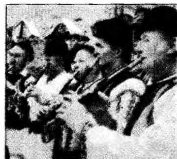
Formația de fluierași de la Orăștioara de Sus