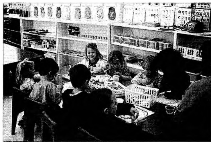
Deficiența de atenție la copii poate semnaliza probleme de comportament în adolescență

În opinia specialiștilor, la nivelul școlilor ar trebui să existe echipe care să poată să se ocupe de sănătatea copi-