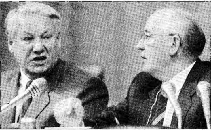
Boris Elțin, preluând de la Gorbaciov prerogativele puterii

Moscova (MF) - În urmă cu 16 ani, lumea întreagă își îndrepta atenția asupra situației de la Moscova, unde comuniștii conservatori încercau să pună mâna pe putere, sperând că vor împiedica dezmembrarea Uniunii Sovietice. Pe 19 august 1991, la primele ore ale dimineții, Radio Moscova anunța că Mihail Gorbaciov este grav bolnav și că nu mai poate conduce statul și partidul. Atribuțiile sale erau preluate de un Comitet de Stat pentru Situații Excep-