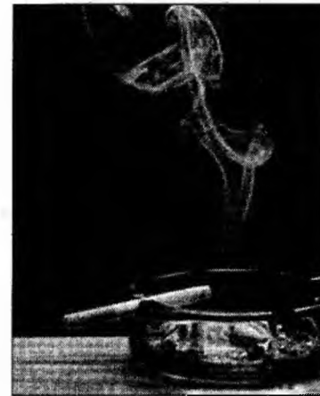
Dependența de tutun e asemănătoare celei de droguri

țigări, iar efectul a durat 2 luni de la încetarea tratamentului. Ovăzul are efect calmant, dă o stare de bună dispoziție și acționează ca un tonic pentru sistemul nervos, are un efect slab și nu creează dependență. Pentru cei care doresc să renunțe la tutun, am găsit o rețetă naturală. Într-o sticlă de 50 ml se amestecă următoarele tincturi: 15 ml ovăz verde; 10 ml voronic (unguraș); 10 ml lumânărică; 5 ml goldenseal (hydrastis canadensis); 10 ml mentă. Puneți câte 6 picături