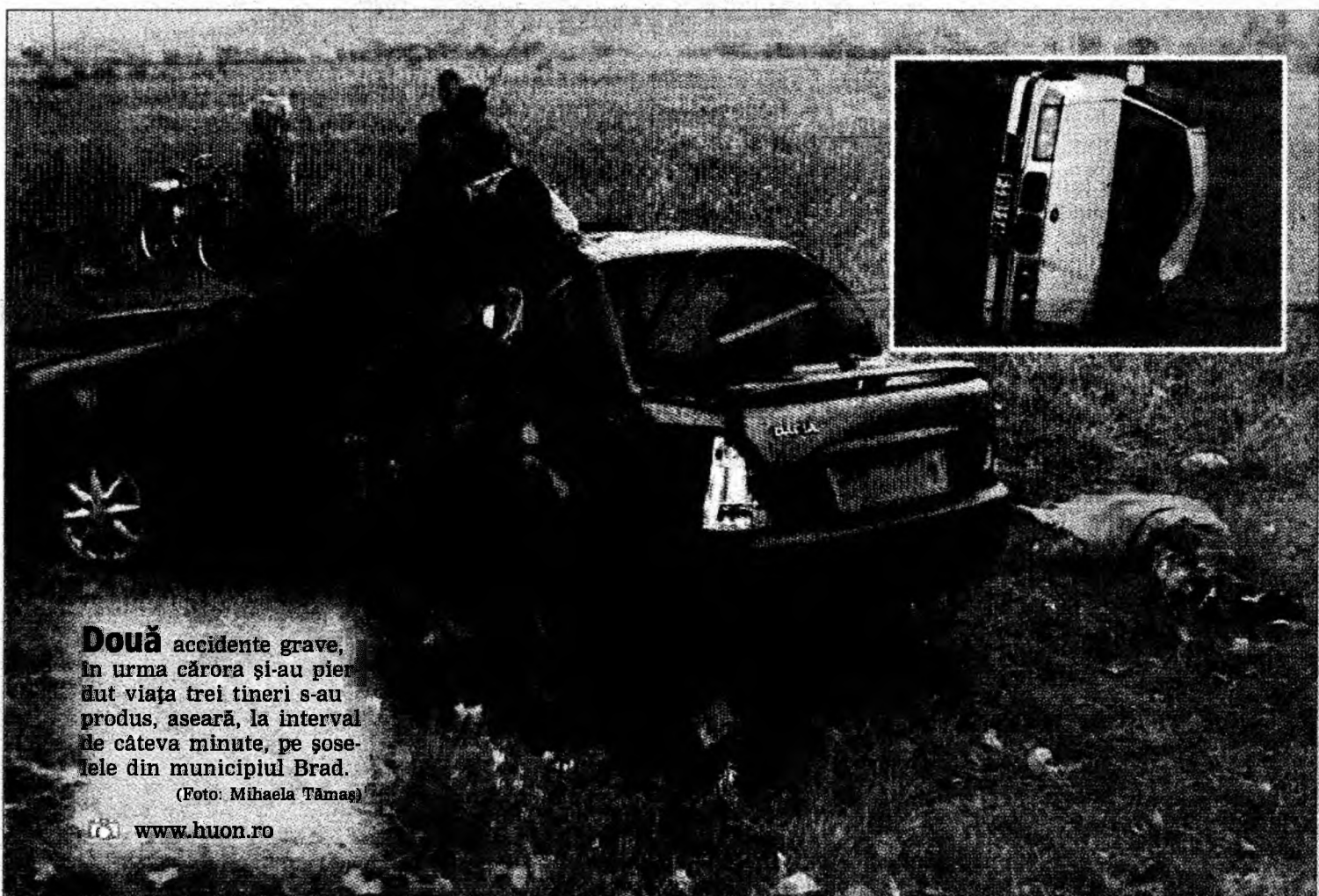
Două accidente grave, în urma cărora și-au pierdut viața trei tineri s-au produs, aseară, la interval de câteva minute, pe șoselele din municipiul Brad.

accidentului, la ieșirea din Brad mor alți doi tineri. Aici, din cauza vitezei, conducătorul unei Dacia Solenza pierde controlul volanului și intră într-un copac de pe marginea șoselei. Un tânăr moare pe loc, unul în drum spre spital, iar al treilea se află în stare gravă la Spitalul din Brad. /p.3