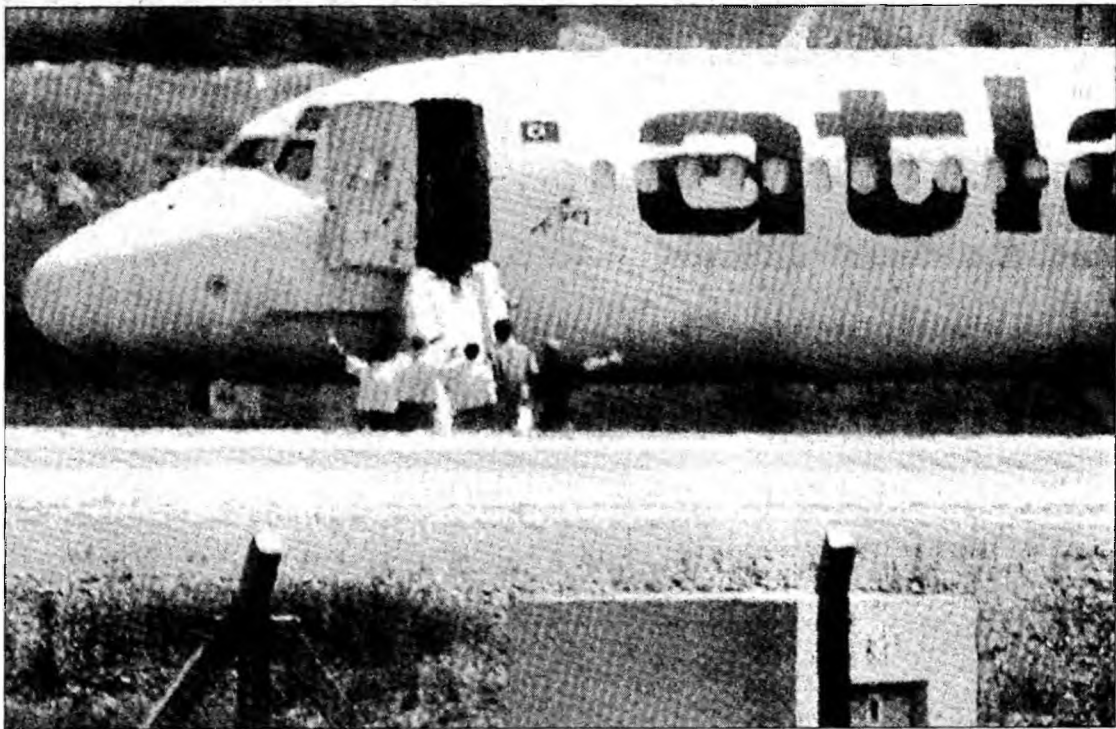
Final fericit în cazul deturnării avionului

■ Pirații aerului s-au predat autorităților, iar pasagerii au scăpat vii și nevătămați.