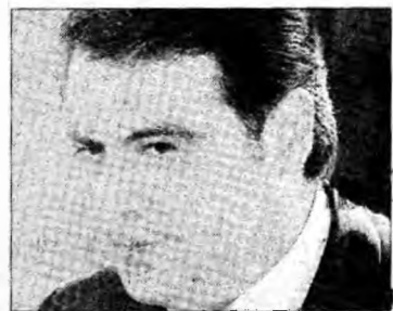
Adrian Cioroianu