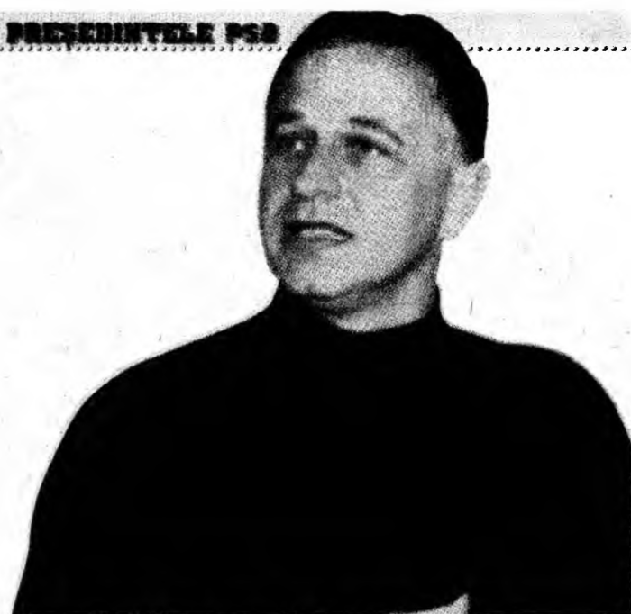
Mircea Geoană, președintele PSD

M.G.: Important nu este cum se va sfârși acest conflict, ci efectele negative pe care le-a provocat și le provoacă pentru România. Nominalizarea eșuată a comisariatului european sau faptul că România nu are încă ambadori în unele dintre cele mai importante capitale ale lumii sunt asemenea efecte. Traian Băsescu e un