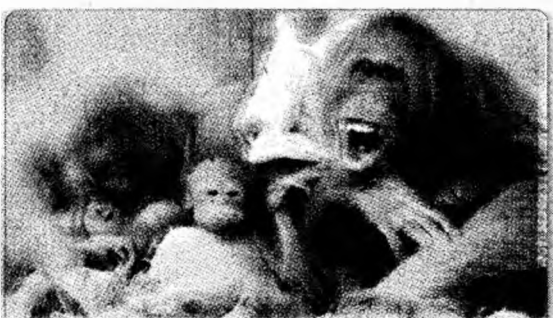
Două femele urugutan în timp ce se joacă cu unul din puii lor, în incinta unei arii protejate din apropiere de Balikpapan East Kalimantan.

Vatican (MF) - Vaticanul a negat că ar fi modificat informații publicate online în cadrul enciclopediei Wikipedia, după ce această ipoteză a fost avansată într-un articol publicat de BBC. Reacția Vaticanului vine după ce, miercuri, BBC a informat că, potrivit unui instrument de scanare care face publică identitatea organizațiilor care editează Wikipedia, computerele Vaticanului au fost utilizate pentru a modifica pagini referitoare la liderul partidului republican irlandez Sinn Fein.