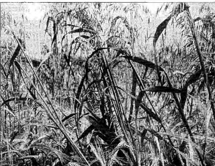
Ovăzul este o plantă cu multiple calități terapeutice

În cazul bebelușilor, pe lângă baia de curățenie propriu-zisă sunt necesare unele băi de plante cu efect terapeutic. Băile cu tărâțe de grâu sau amidon sunt folosite la sugari sau copiii mici cu diverse afecțiuni dermatologice, urticarie, eriteme. Pentru aceștia se fierbe în apa de baie o săculeț în care ați pus o mână de tărâțe sau fierbeți 1-2 linguri de amidon în apa de baie.