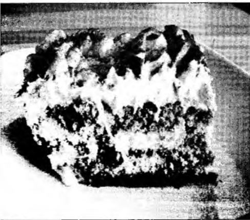
Poftă bună!

Ingrediente: 7 ouă, 50 g cacao, 100 g nuci, 30 g unt, 200 g zahăr tos, 250 g frișcă, zahăr pudră. Mod de preparare: Se pune la fiert 1 pahar cu apă și cu zahărul. Se adaugă cacao și la urmă nucile. Se lasă să fiarbă până se îngroașă și se ține pe lingură, amestecând mereu. Apoi se dă la rece. Când s-a răcit complet, se adaugă gălbenușurile alternativ cu albușurile bătute spumă. Când se pun albușurile, se amestecă ușor și repede ca să nu se lase. Se unge forma bine cu unt și se coace la cuptor la foc iute. Nu se coace prea tare. Când este rece, se pune deasupra frișcă și se pudrează cu zahăr.