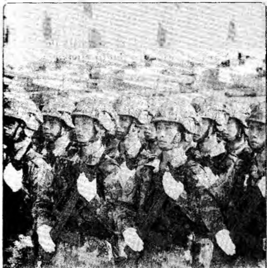
Super-puteri. Recentele manevre ruso-chineze s-au dorit un mesaj fără echivoc, că cele două state doresc să fie considerate super-puteri.

București (MF) - Premierul Călin Popescu Tăriceanu îi invită mâine pe șefii partidelor politice parlamentare la Palatul Victoria pentru a purta discuții despre fixarea datei alegerilor pentru Parlamentul European. Partidele parlamentare au răspuns prompt invitației lansate de premier. PD a anunțat însă că nu se va prezenta, pentru că premierul a amănat nejustificat alegerile europene. PSD, PRM și PC spun însă că vor merge să-și susțină punctul de vedere în fața premierului.