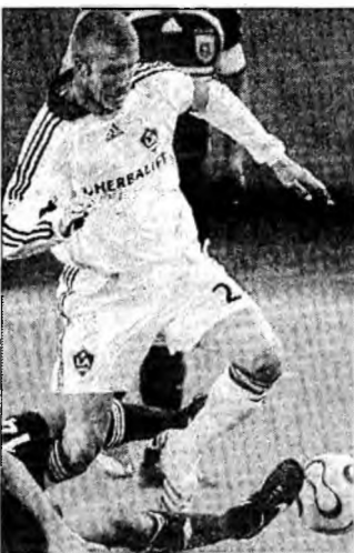
David Beckham

În ciuda a trei pase decisive din faze fixe (două cornere și o lovitură liberă), Beckham, care a jucat tot meciul, a luat parte la a șaptea înfrângere a formației sale, care ocupă penultima poziție în conferința de vest a MLS. Începând de astăzi, Beckham se va transforma în globe-trotter. El se va alătura lotului naționalei Angliei pentru meciul amical cu Germania, care va avea loc mier-