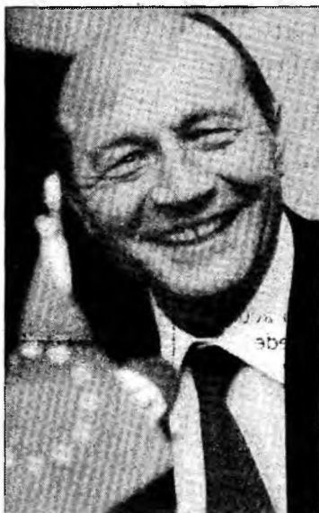
Traian Băsescu, unul dintre cei mai săraci președinți

state sau de guverne, pe primul loc se situează liderul de la Casa Albă, George W. Bush, care câștigă nu mai puțin de 33.000 de dolari pe lună. Locul secund este ocupat de premierul Marii Britanii, Gordon Brown, cu 23.300 de euro, urmat la mică distanță de omologul său nipon, Shinzo Abe, care este remunerat cu 21.000 euro lunar. Pe poziția a patra se află cancelarul german, Angela Merkel, care primește 20.400 de euro pe lună, în vreme de locul 5 este adjudecat de șeful guvernului italian, pe care statul îl plătește cu 18.900 de euro lunar. Prodi este urmat de premierul Canadei, care primește 15.800 de euro lunar, iar pe locurile 7 și 8 sunt președinții Franței și Rusiei. Nicolas Sarkozy