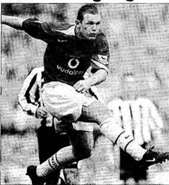
Wayne Rooney și Thierry Henry sunt vizați

Potrivit News of the World, site-ul respectiv, deschis la Glasgow și care este numit după al-Qaida, a prezentat în această săptămână un film cu cei trei fotbaliști, pe care apar mai multe mesaje. Alături de fotografia lui Rooney, se poate citi: „De ce îi iubești pe cei ce fac rău?”. La Beckham este scris: „Ce te-a făcut să ajungi printre ratați?”, iar la Henry apare mesajul: „De ce imiți poporul dorințelor?”. După ce sunt prezentate cele trei fotografii, cu mesajele inserate, în film apar o serie de imagini cu cimitire și