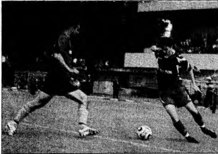
Fotbaliștii hunedoreni mai au de muncit pentru a emite pretenții la performanță

Corvinul 2005 Hunedoara și nou-promovata Mureșul Deva au câștigat la limită, scor 2-1, ultimele teste, dar antrenorii celor două echipe recunosc că echipele lor au încă puncte vulnerabile. Corvinul a învins, în deplasare, cu 2-1, pe Textila Cislădie (liga a III-a), prin golurile semnate de Fotescu (min. 24 și 45), însă hunedoreni s-au arătat vulnerabili la presiunea publicului advers. „Am dominat