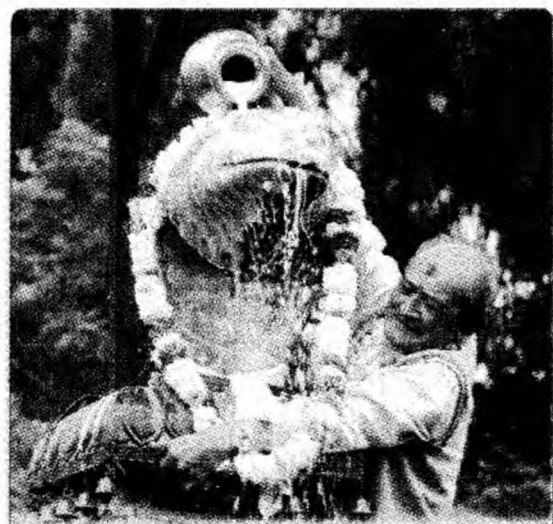
Un nepalez aduce ca ofrandă lapte de vacă, statuii din aur a șarpelui „Nag”, în Nagpokhari.

● Mașinărie. O mașină de spălat rufe fără detergent, concepută de o echipă de cercetători chinezi și care face furori în țara de origine, va fi lansată pe piață în Europa până la sfârșitul anului. (MF)