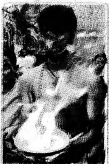
Băștinăș din Sri Lanka în timpul unui festival care are loc în fiecare an în templul Mayurapadi Sri Badhrakali, din Colombo.

vineri, anularea turneului lui Lily Allen pe coasta de vest a Statelor Unite, care urma să înceapă la San Diego (California) la 6 septembrie, din cauza unei probleme de viză. Cântăreața a fost arestată la începutul lui august, pe aeroportul din Los Angeles și interogată în legătură cu presupusa agresiune a unui fotograf, pe care ar fi comis-o la Londra în martie.