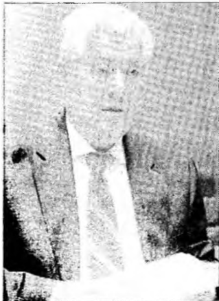
Vladimir Voronin, președintele Moldovei

Moscova (MF) - Moscova și Chișinăul au căzut de acord cu privire la federalizarea Republicii Moldova, văzută ca unică soluție pentru rezolvare diferendului transnistrean. Declarația aparține președintelui Consiliului rus pentru Politică Externă și Securitate, Serghei Karaganov. Acesta a explicat că acordul dintre Moscova și Chișinău prevede ca Transnistria să beneficieze de o