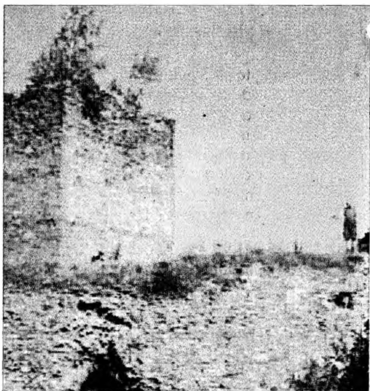
Cetatea de la Mălăiești