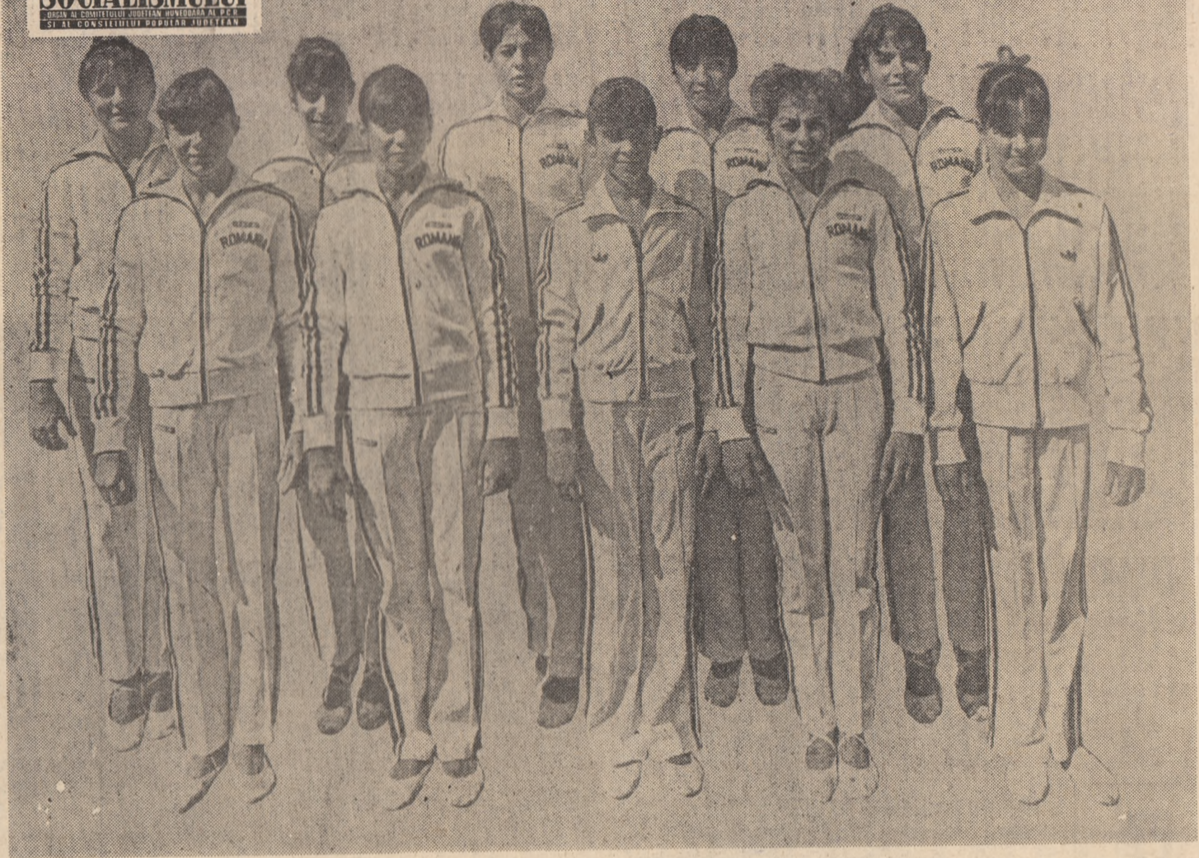
LOTUL NAȚIONAL FEMININ DE GIMNASTICA