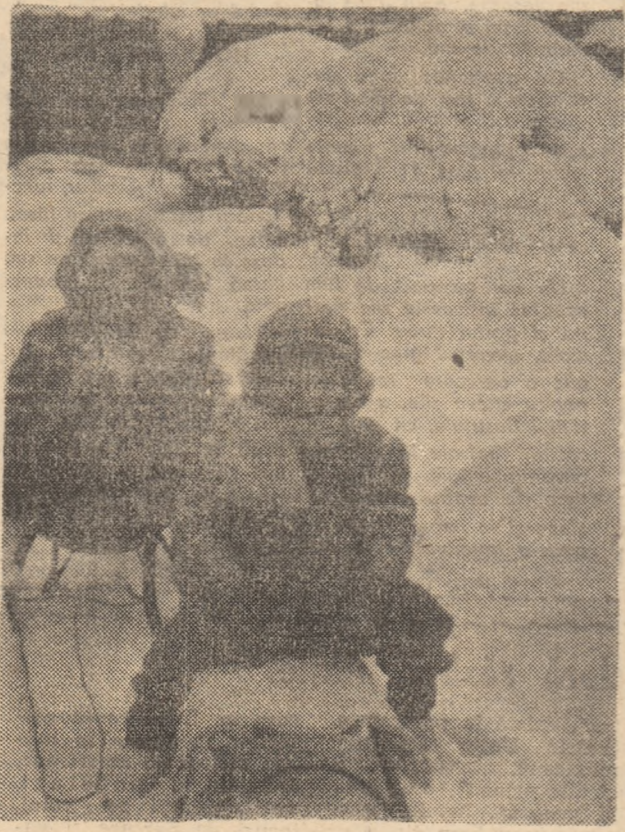
Unde e zăpada vacanței?