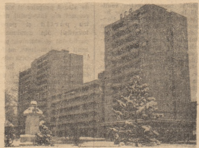
Centrul civic din Petroșani, în scurtele zile cu zăpadă...