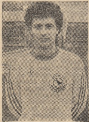
MIRCEA REDNIC — așa cum îl înțeleg la suflet hunedorenii, și cum dorește el însuși...

te menții, în fapt să evoluezi, să crești pe măsură ce crește dificultatea meciurilor internaționale, o dată cu exigența și pretențiile iubitorilor fotbalului față de jocul echipei și pentru rezultate tot mai bune. Eu, împreună cu echipa națională, am avut șansa să urmez acest drum, de la Hunedoara pînă la... Paris și probabil mai departe. Am fost prezent în toate meciurile echipei lui Mircea Lucescu, prezent la toate victoriile și înfringerile, cite au fost. Oricum, a fost frumos, nespuse de frumos.