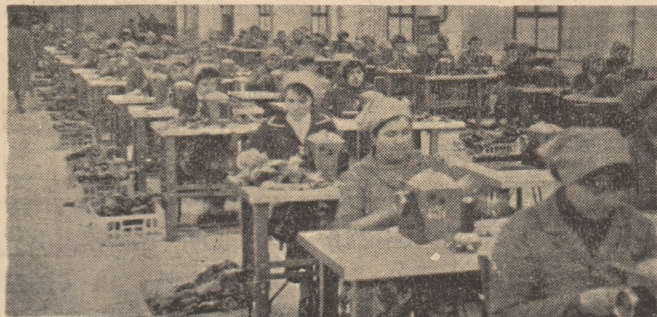
Recuperarea, recondiționarea, refolosirea materiilor și materialelor a devenit o problemă de conștiință și atitudine muncitorească. Una dintre materializările lor se întîlnește frecvent în atelierul de confecționat îmblănituri de la Humedoara, al întreprinderii „Vidra” Orăștie.

Reflectînd mai profund la comportamentul lor, unul față de celălalt, ca și la faptul că aceste conflicte întretinute permanent deranjează și pe ceilalți colocalitari de pe scară, poate vor găsi drumul împăcării. Pentru că ce poate fi mai omenos decît să-ți trăiești viața drept și frumos, cu respect și bunăcuviință față de semenii