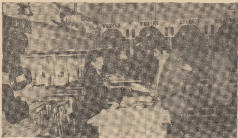
Aspect din interiorul magazinului „Romaria”, recent deschis în orașul Hațeg.

Același înălțător mesaj patriotic va străbate și manifestările fazei de masă de la sate și comune (ianuarie — 15 iunie 1984), cînd Ștăfeta folclorică „Căutătorii de comori” va trebui să-și releve frumu-