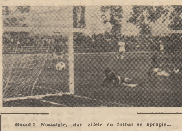
Goal! Nostalgie, dar zilele cu fotbal se apropie...