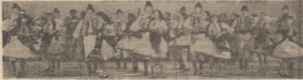
Ansambllul „Getusa” într-un spectacol dedicat sârbătorii de la 24 Ianuarie.