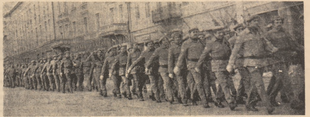
Aspect de la defilarea formațiunilor și detașamentelor de luptători din gărzile patriotice de la Deva.

șirea pregătirii de luptă și apărare. Momentul solemn al scoaterii drapelului de luptă și intonării Imnului de Stat al Republicii Socialiste România a fost urmat de festivitatea înmînării de diplome comandanților de formațiuni și detașamente, luptătorilor care s-au evidențiat în activitatea de pregătire în anul 1983. Revista de front s-a încheiat cu defilarea formațiunilor și detașamentelor de luptători.