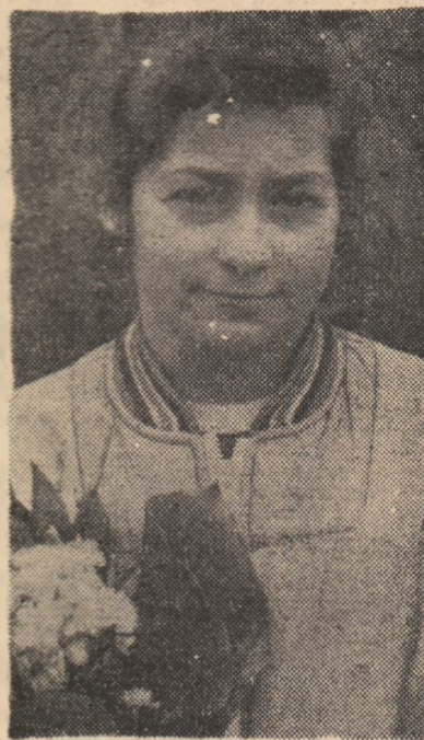
Flori și aplauze pentru marea sportivă Ecaterina Szabo.

Parcă o nostalgie fără margini au conținut aceste cuvinte rostite de marea campioană Ecaterina Szabo în fața participanților la analiza activității sportive desfășurate în 1983. Spunea atât de frumos Cati: „Împreună cu colegile mele am cucerit pentru culorile patriei noastre 8 medalii la mondiale, adică jumătate din totalul celor puse în joc, iar la europene 9, dintre care 3 de aur, din cele 5 disputate. Dacă era după mine și prietena mea Lavinia le-am fi luat pe toate, dar acolo a trebuit să înfruntăm gimnaste de mare valoare, cu experiență mult mai mare decât a noastră”.