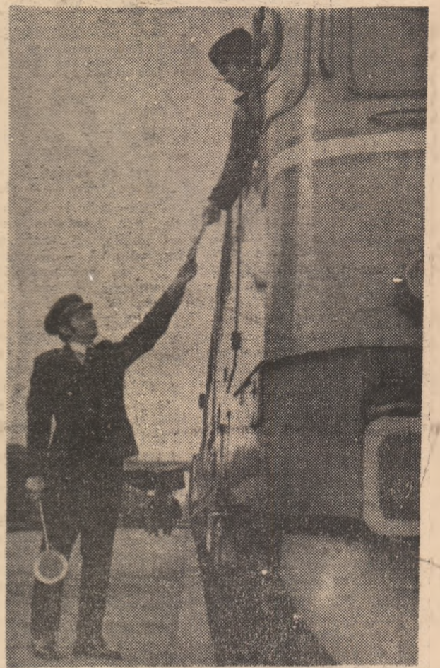
căldura pentru succesele dobîndite în munca lor de mare însemnătate și răs-