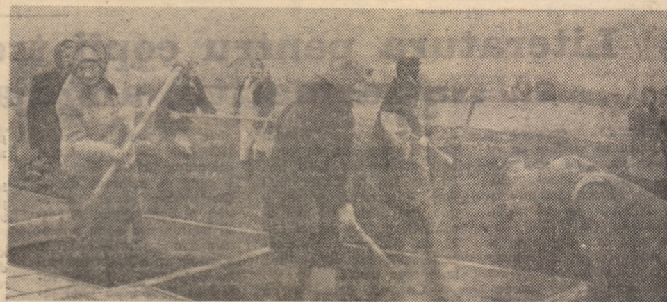
Legumicultorii din satul Aurel Vlaicu se preocupă de asigurarea răsădurilor.

Cunoscînd sarcinile ce revin unităților agricole cultivatoare de cartofi, cît și cerințele de a organiza culturi intensive de cartofi de pe care să se obțină cîte 40—50 tone tuberculi la hectar, este necesar ca