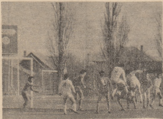
Dispută dirză pentru balon la meciul amical Mureșul Explorări Deva — Dacia Orăștie.