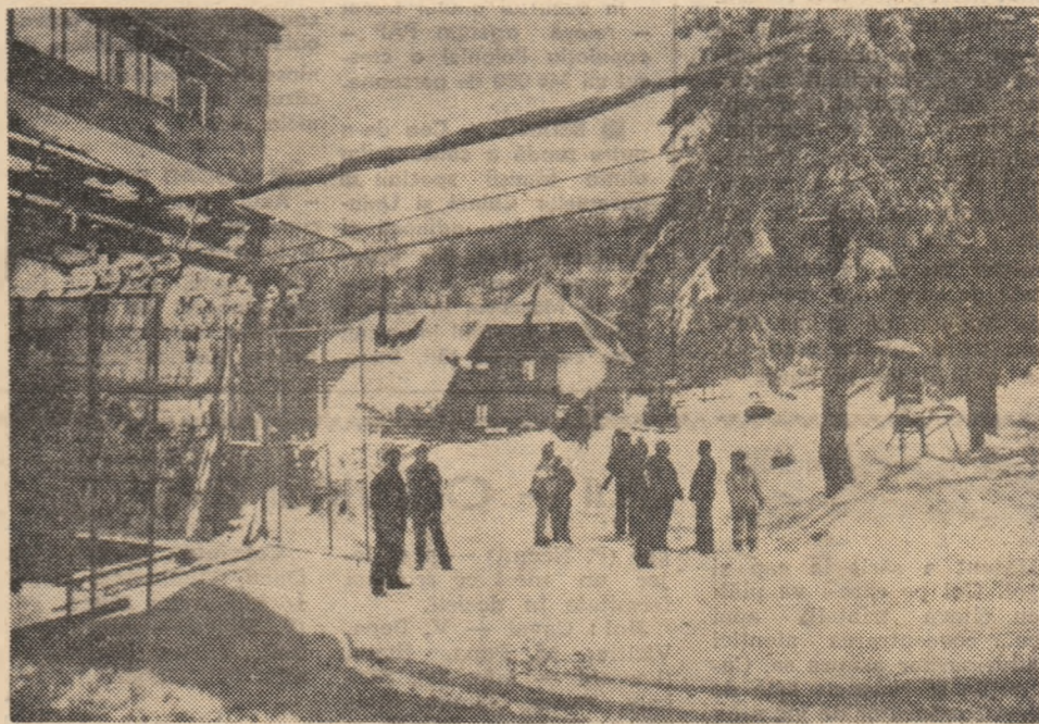
Iarna la munte...

● EXPOZIȚIE FOTO. Clubul sindicatelor din Simeria a găzduit vernisajul expoziției de fotografii aparținînd impieगतुलु de mișcare Kolubnan Csaba. Expoziția, care cuprinde peste 20 de fotografii alb-negru, de o calitate apreciabilă, reprezintă peisaj industrial și natural din județul nostru, fiind primită cu interes de publicul vizitator. (Argentina Ciotea, corespondent).