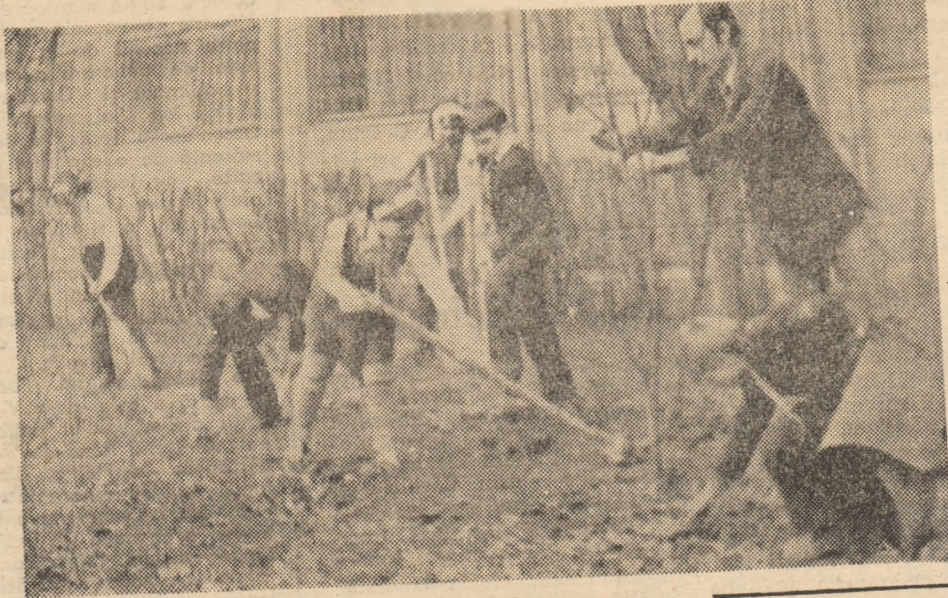
Alături de cei mari și copiii Hunedoarei își afirmă prin muncă dragostea pentru frumos.