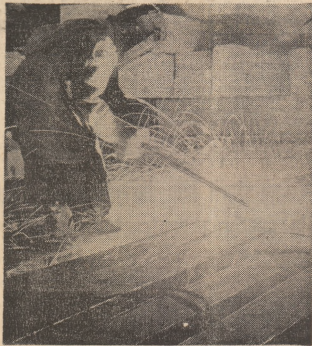
C.S. Hunedoara. Aspect de la flamarea laminatorilor.