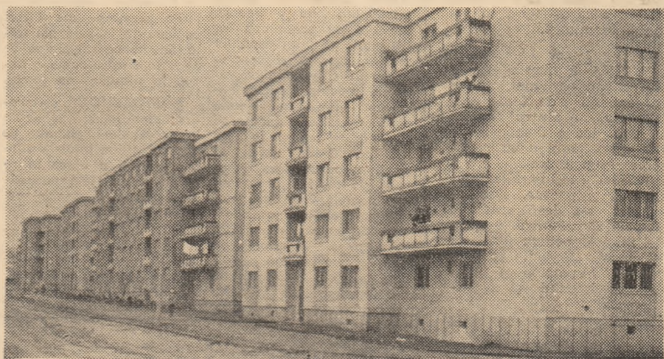
Lupeni. Noi blocuri în cartierul Bărbăteni.