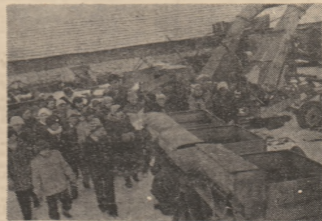
Elevii clasei a VIII-a de la Școala generală din Totești lan căminășă despre utilajele cu care se execută lucrările agricole în C.A.P.