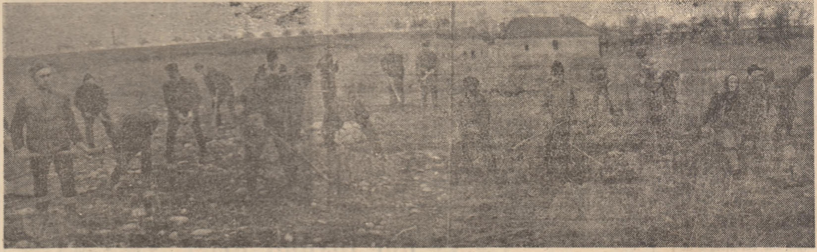
Pe ogoarele Cooperativei agricole din Totești, cooperatorii sînt mobilizați la curățarea terenului de vegetație lemnoasă și de pietre, asigurînd condiții pentru buna desfășurare a lucrărilor agricole și creșterea producției la hectar.

Intr-adevăr, azi, pe plața mondială pretențiile față de calitatea mărfurilor importate cresc de la o zi la