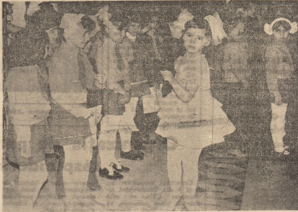
Sănătate, vigoare, grație. Despre acestea vorbesc fețele copiilor din fotografie.

Cele câteva elemente din pagina de față demonstrează cu prisosință aceste adevăruri pentru județul Hu- nedoara.