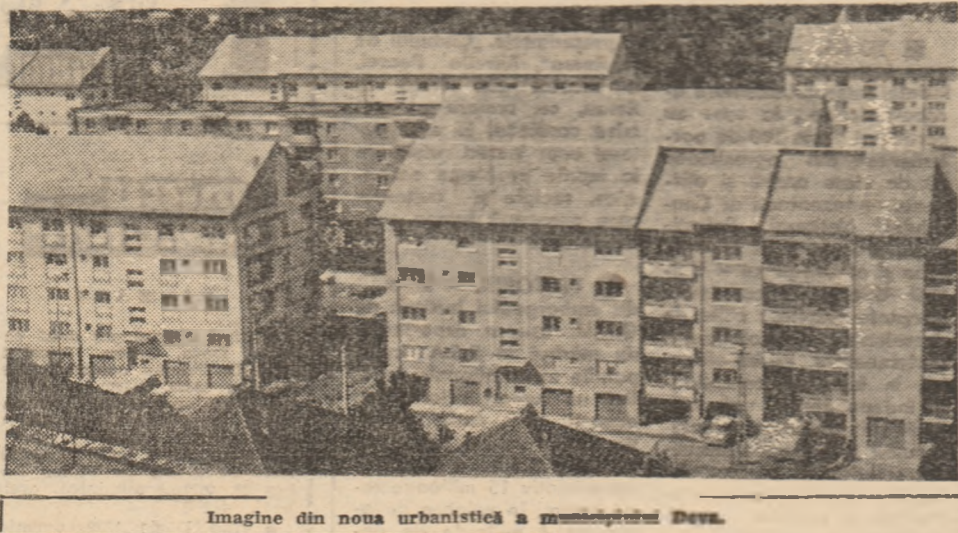
Imagine din noua urbanistică a municipiului Deva.

Pentru buna desfășurare a lucrărilor agricole din campania de primăvară, cînd se cere mobilizarea întregului potențial de forțe la însămințări, se suspendă, pînă la data de 1 Mai a.c., toate tîrgurile săptămîniale și tradiționale.