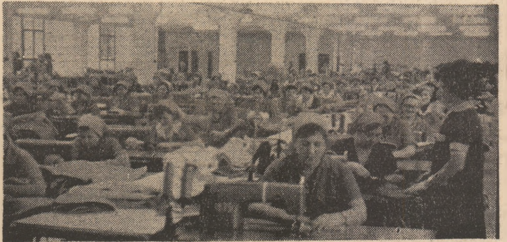
Întreprinderea „Vidra“ Orăștie: Aspect de muncă de la noua secție din Hunedoara a acestei unități.