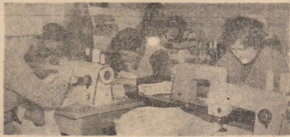
Cooperativa mestesugărească „Motul” Brad. Aspect din secția broderie mecanică.

Sintem convinși că unitățile din consiliul unic Brad dispun de posibilități reale pentru îndeplinirea sarcinilor și vom acționa cu toată hotărîrea pentru aceasta.