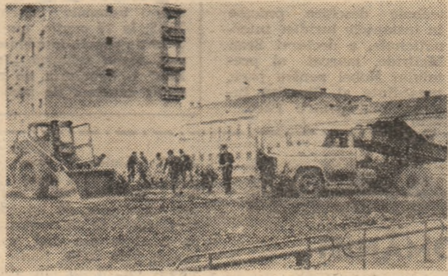
În fiecare duminică se acționează cu mijloace mecanice și forțe umane la amenajarea viitorului parc al orașului Hăgeș.