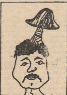
— După accident...

accidentelor de muncă și îmbolnăvirilor profesionale. În acest sens s-au întreprins o serie de acțiuni educative în scopul respec-