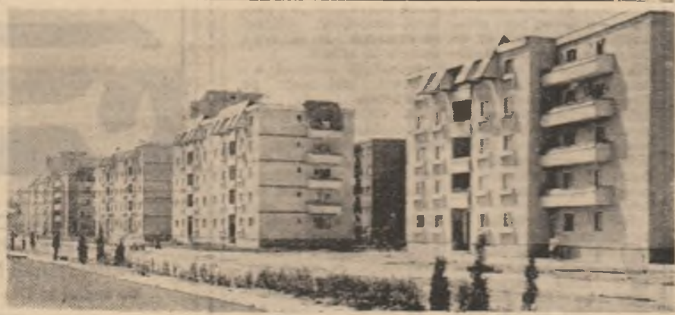
Deva. Vedere de pe centura orăștului.

Secvențele surprinse în timpul raidului nostru efectuat în câteva unități din C.U.A.S.C. Totești, dovedesc că, deși campania de primăvară nu se desfășoară aici pe front larg — datorită condițiilor climatice mai vitrege —, totuși, în toate unitățile se muncște cu răsunătoare, pregătindu-se temeinic semănatul culturilor din urgența I.