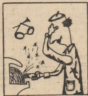
Palmele nu sînt în loc de ochelari!

Pagină realizată de: GH. I. NEGREA, LIVIU BRAICA