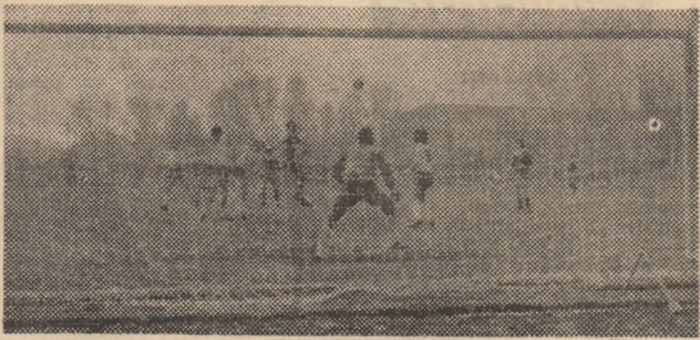
Un nou atac și o nouă minge amenințătoare la poarta echipei din Oravița. Fază din meciul de fotbal Mureșul Explorări Deva și Minerul Oravița.

Partida, de un real interes, va începe la orele 16,30.