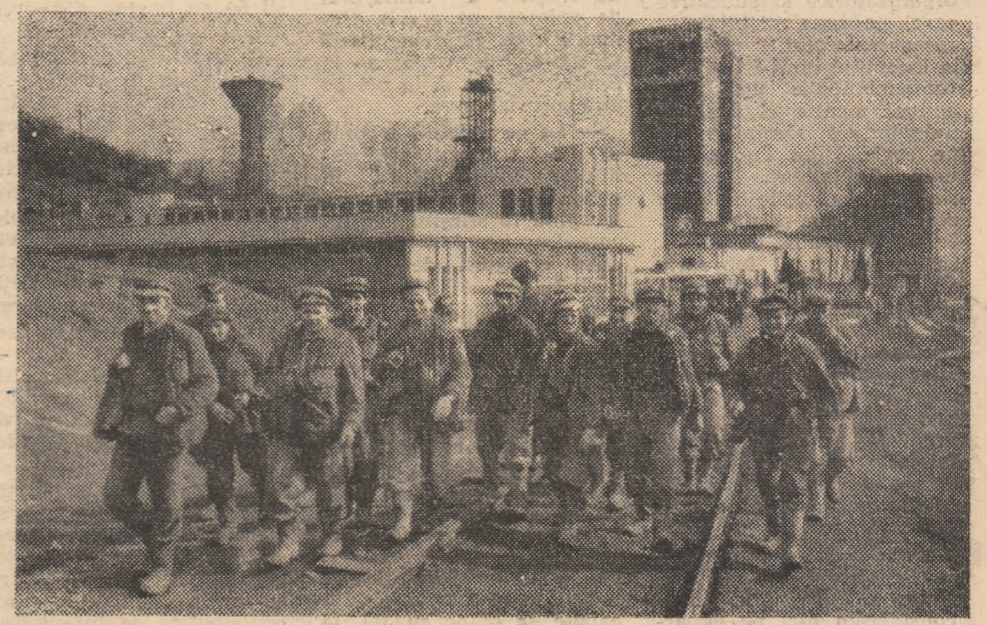
Intreprinderea minieră Vulcan. Aspect de la intrarea în șut a minerilor.