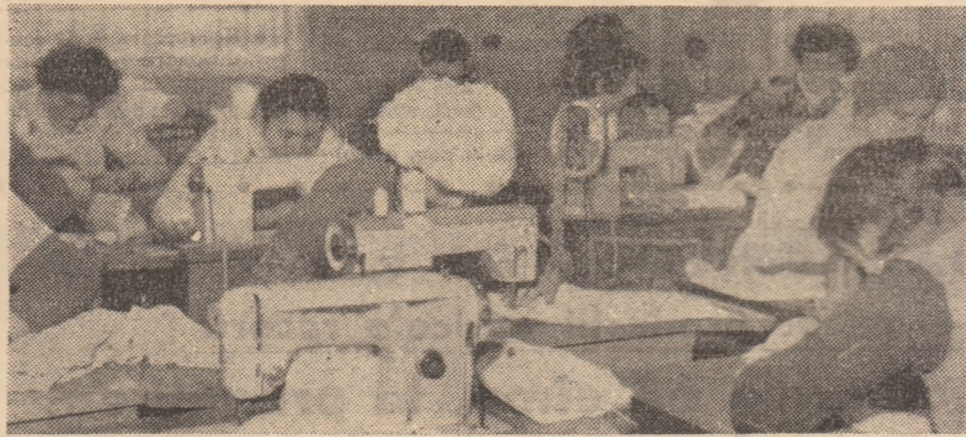
Cooperativa „Moșul” Brad. Aspect din secția broderie.

Silvicultorii din județul nostru acționează cu forțe sporite pentru dezvoltarea patrimoniului forestier. Pînă acum s-au realizat împăduriri pe mai mult de 200 hectare cu rășinoase și alte specii, s-au făcut culturi speciale pe 33 ha, s-au înființat răchitării pe 5 hectare, au fost scoși peste 4 milioane puieți din 10,5 milioane planificați, iar la comuna s-au împădurit peste 9 hectare din cele 110 planificate. Cei peste 1300 lucrători ce participă la acțiunile amintite depun eforturi susținute pentru depășirea sarcinilor de plan.